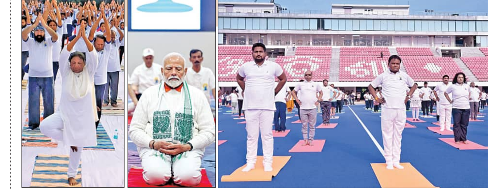
ଯୋଗମୁଦ୍ରାରେ ରାଷ୍ଟ୍ରପତି ଦ୍ରୌପଦୀ ମୁର୍ମୁ, ପ୍ରଧାନମନ୍ତ୍ରୀ ନରେନ୍ଦ୍ର ମୋଦୀ ଏବଂ ମୁଖ୍ୟମନ୍ତ୍ରୀ ମୋହନ ଚରଣ ମାଝୀ