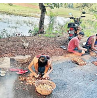
ପଦ୍ମପୁର ଅଞ୍ଚଳରେ ବନଜାତ ଦ୍ରବ୍ୟ ଉତ୍ପାଦନ ହେଉଛି।

ବାହାର କରାଯାଇ ଥାଏ। ବର୍ତ୍ତମାନ ରିପାଇନ ତେଲ, ସୋରିଷ ତେଲ ଆକାଶ ଛୁଆଁ ଦର ହୋଇଥିବା ବେଳେ ଏହି ଟୋଲରୁ ତେଲ ପ୍ରସ୍ତୁତ କରି ବ୍ୟବହାର କରାଯାଇଥାଏ। ସକାଳ ହେଲେ ବିଭିନ୍ନ ପରିବାରର ଲୋକେ ଟୋଲ ସଂଗ୍ରହ କରିବା ପାଇଁ ଯାଆନ୍ତି ଏହାର ମଞ୍ଜୁକୁ ବାହାର କରି ତୋପା ଛଡ଼େଇ ଖରାରେ ଶୁଖାନ୍ତି। ଭଲ ଭାବରେ ଶୁଖିଗଲା ପରେ ଏହାକୁ ବ୍ୟବସାୟୀ ମାନେ କିଣି ପ୍ରକ୍ରିୟାକରଣ କରି ତେଲ ପ୍ରସ୍ତୁତ କରିଥାନ୍ତି। ମାତ୍ର ପଦ୍ମପୁର ଅଞ୍ଚଳରେ ଏହି ପ୍ରକ୍ରିୟାକରଣ ପାଇଁ କୌଣସି ବ୍ୟବସାୟ ନଥିବାରୁ ଲୋକମାନେ ଏହା ସଂଗ୍ରହ କରି ଅତି କମ ମୂଲ୍ୟରେ ବେପାରୀ ହାତରେ ବାଧ୍ୟ ହୋଇ ଦେଉଛନ୍ତି। ତେଣୁ ଏହି ଅଞ୍ଚଳରେ ବନଜାତ ଦ୍ରବ୍ୟ ପାଇଁ ବଜାର ବ୍ୟବସ୍ଥା କଲେ ଏ ଅଞ୍ଚଳର ଆଦିବାସୀ ଉପକୃତ ହେବେ ବୋଲି ପତ୍ତା ପ୍ରକାଶ ପାଇଛି।