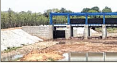
ଉପକୃତ ହେବେ ୮୯୧୨ ପରିବାର

ଚାଷୀ ଉପକୃତ ହେବ ବୋଲି ଜଣାପଡ଼ିଛି। ଏହାର ଜଳଧାରଣ କ୍ଷମତା ୮୮.୬୬ ହେକ୍ଟାମିଟର ହୋଇଥିବାବେଳେ ବ୍ୟାରେଜରୁ ୧୧୫୨.୪୦ କ୍ୟୁସେକ ଜଳ ନିଷ୍କାସନ ହୋଇପାରିବ। ଜୁଲକୋ