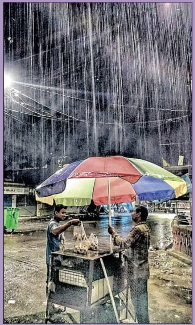
ବର୍ଷାରେ ଭିଜିଲା ଅନୁଗୋଳ ସହର

ବକ ଓ ୧୮୦୦ ପକ୍ଷୀ ବାରମ୍ବାର ଆଘାତ, ଦାବି କରାଯିବା ପରେ ଏଠାରେ ରାଜ୍ୟ ସରକାରଙ୍କ ପକ୍ଷରୁ ମେଡିକାଲ କଲେଜ ପାଇଁ ଜମି ଯୋଗାଇ ଦିଆଯାଇଥିଲା । ଏହିପରି ପକ୍ଷୀ ପ୍ରାୟ ୫୦୦ କୋଟି ଟଙ୍କା ବ୍ୟୟରେ ଏହି ମେଡିକାଲ କଲେଜ ନିର୍ମାଣ କାର୍ଯ୍ୟ କରାଯାଇଥିଲା । ଏଠାରେ ୧୦୦ ବିଡ଼ରେ ଛାତ୍ରଛାତ୍ରୀ ପାଠ ପଢ଼ିବା ସହିତ ୫୦୦ ଶଯ୍ୟା ବିଶିଷ୍ଟ ହସ୍ପିଟାଲ ଖୋଲିବା ପାଇଁ ତୃତୀୟ ନିଷ୍ପତ୍ତି ନିଆଯାଇଥିଲା । କିନ୍ତୁ ପରିତାପର ବିଷୟ କଲେଜ ପାଇଁ କୋଠା ନିର୍ମାଣ ହୋଇଗଲା । ବାରମ୍ବାର ଦାବି ଫଳରେ ଏହାର ନାମ ପରିବର୍ତ୍ତନ କରାଯାଇ ପବିତ୍ର ମୋହନ ପ୍ରଧାନ ଇନ୍ସ୍ଟିଚ୍ୟୁଟ ଅଫ ମେଡିକାଲ ସାଇନ୍ସ ରଖାଗଲା । ପରବର୍ତ୍ତୀ ସମୟରେ ମେଡିକାଲ କଲେଜ ବଦଳରେ ଏହିପରି ସେଣ୍ଟ୍ରାଲ ହସ୍ପିଟାଲ ଗଠନକୁ ପବିତ୍ର ମୋହନ ସରକାରୀ ଚିକିତ୍ସାଳୟ ଭାବେ ନାମିତ କରି ପ୍ରାୟ ୧୧ କୋଟି ଟଙ୍କା ବିଦ୍ୟୁତ୍ ସେବା ଚଳାଇଛନ୍ତି । ହେଲେ ଏ ପର୍ଯ୍ୟନ୍ତ କଲେଜ ଖୋଲିବାର ନାଁଗଣ ଧରୁ ନାହିଁ । ତେବେ ନୂଆ ସରକାର ଆସିଲେ ତାଳଚେରର ଏହି ପବିତ୍ର ମୋହନ ପ୍ରଧାନ ମେଡିକାଲ କଲେଜ ଖୋଲିବା ପାଇଁ ଉପଯୁକ୍ତ ପଦକ୍ଷେପ ନେବ ବୋଲି ଅଞ୍ଚଳବାସୀ ଚାହିଁ ରହିଥିଲା ବେଳେ ଏହା କେବେଠାରୁ କାର୍ଯ୍ୟକ୍ଷମ ହେବ, ତାହା ଦେଖିବାକୁ ବାକି ରହିଛି । ଏହି ମେଡିକାଲ କଲେଜ ଖୋଲିଲେ ତାଳଚେର ସମେତ ଅନୁଗୋଳ ଜିଲ୍ଲାବାସୀ, ତେଜନାମା, ଦେବଗଡ଼ ଓ ଅନ୍ୟ ଜିଲ୍ଲାର ଲୋକମାନେ ଉପକୃତ ହେବା ସହିତ ଉତ୍ତମ ସ୍ୱାସ୍ଥ୍ୟସେବା ପାଇପାରିବେ ବୋଲି ଆଶା କରାଯାଉଛି ।