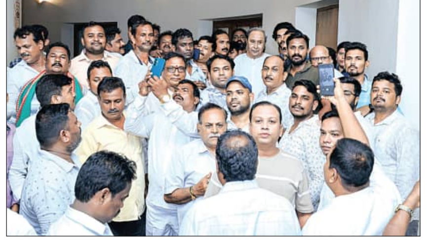
ରୁଧିରା ବିରୋଧୀ ଦଳ ନେତା ନିର୍ବାଚିତ ହେବା ପରେ ନବୀନ ନିବାସରେ ଦଳର ସଭାପତି ନବୀନ ପଟ୍ଟନାୟକଙ୍କୁ ଦକାୟ ନେତା ଓ କର୍ମୀଙ୍କ ଶୁଭେଚ୍ଛା