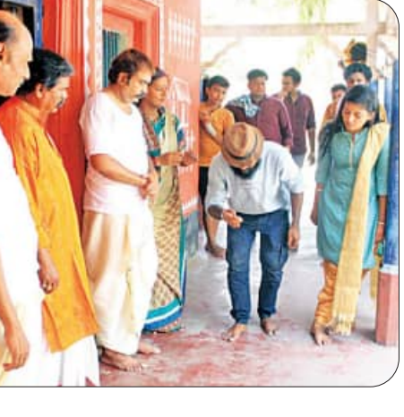
ବ୍ରହ୍ମପୁର, ୧୯।୬(ସମ୍ପାଦକ): ଗୋଷାଣାନ୍ତରାଳୀ... ସେହିଭଳି କେମିଟି ଗଠନ କରି ରୋଗୀଙ୍କୁ ଚିକିତ୍ସାରେ ଅବହେଳା କଲେ ଅପରାଧୀ ଭାବରେ ଚାର୍ଜ୍ ଜାରି କରାଯାଇଥିବା ବିଷୟ ସମ୍ବନ୍ଧରେ ସମୀକ୍ଷା କରାଯାଇଥିବା ଜଣାପଡ଼ିଛି।

ଗୋଷାଣାନ୍ତରାଳୀକୁ ପ୍ରସ୍ତୁତ କରିବ କ୍ଷୁଦ୍ର ଚଳଚ୍ଚିତ୍ର... ସେହିଭଳି କେମିଟି ଗଠନ କରି ରୋଗୀଙ୍କୁ ଚିକିତ୍ସାରେ ଅବହେଳା କଲେ ଅପରାଧୀ ଭାବରେ ଚାର୍ଜ୍ ଜାରି କରାଯାଇଥିବା ବିଷୟ ସମ୍ବନ୍ଧରେ ସମୀକ୍ଷା କରାଯାଇଥିବା ଜଣାପଡ଼ିଛି।