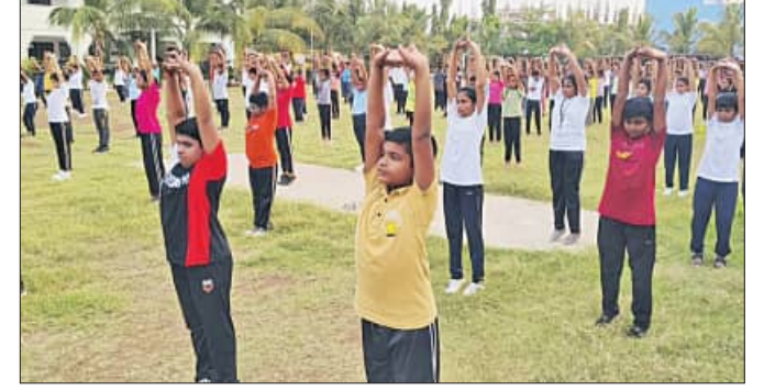
ଅକ୍ଷୟୋତ୍ ପବ୍ଲିକ୍ ସ୍କୁଲ ପକ୍ଷରୁ ଯୋଗାଣ... ସେହିଭଳି କେମିଟି ଗଠନ କରି ରୋଗୀଙ୍କୁ ଚିକିତ୍ସାରେ ଅବହେଳା କଲେ ଅପରାଧୀ ଭାବରେ ଚାର୍ଜ୍ ଜାରି କରାଯାଇଥିବା ବିଷୟ ସମ୍ବନ୍ଧରେ ସମୀକ୍ଷା କରାଯାଇଥିବା ଜଣାପଡ଼ିଛି।

ବ୍ରହ୍ମପୁର, ୧୯।୬(ସମ୍ପାଦକ): ସ୍ଥାନୀୟ ଅକ୍ଷୟୋତ୍ ପବ୍ଲିକ୍ ସ୍କୁଲ... ସେହିଭଳି କେମିଟି ଗଠନ କରି ରୋଗୀଙ୍କୁ ଚିକିତ୍ସାରେ ଅବହେଳା କଲେ ଅପରାଧୀ ଭାବରେ ଚାର୍ଜ୍ ଜାରି କରାଯାଇଥିବା ବିଷୟ ସମ୍ବନ୍ଧରେ ସମୀକ୍ଷା କରାଯାଇଥିବା ଜଣାପଡ଼ିଛି।