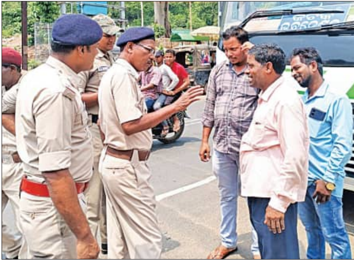
ଜିଲ୍ଲା ସାରା ଚାଲିଛି ସଚେତନତା ଲୋକଙ୍କ ନିକଟରେ ହେଉଛି ପୁଲିସ

ପରିମାଣରେ ପାମାୟ ଜଳ ପିଇବା ପାଇଁ ପରାମର୍ଶ ଦେଉଛନ୍ତି। ସେହିପରି ଭାବେ ସଦରଥାନା ପକ୍ଷରୁ ବିଭିନ୍ନ ସ୍ଥାନରେ ଶାନ୍ତି ବଜାୟ ରଖିବା ପ୍ରୟାସ କରାଯାଇଥିବା ଦେଖାଯାଇଛି। କ୍ରିକାସପୁର