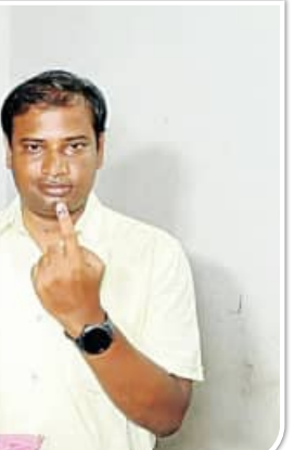
ମାନକୁ ନେଇ ଉଭୟ ବୁଝା ଥିବା ହୁଏ କରାଯାଇଛି। ଅପରାଜିତା ମୋଟ ୬୮ଟି ବୁଝା କାକଟପୁରରେ ୯୪୯ଟି ବୁଝା ହୋଇଛି, ଏହି ବୁଝା ଭିତରେ ସଖି ବୁଝା କରାଯାଇଛି, କଳା ସଂସ୍କୃତି ନେଇ ବିଭିନ୍ନ ରୂପରେଖ ଦିଆଯାଇଛି। ଏହି ସବୁ କେନ୍ଦ୍ରରେ ଭୋଟରମାନେ ନିଜର ମତଦାନ ସାଧ୍ୟତା କରି ଶୁଣି ଅନୁଭବ କରିଛନ୍ତି। ଶୁଣିଲାର ସହିତ ମତଦାନ