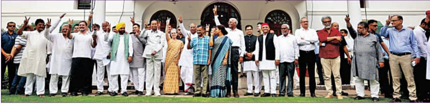
ନୂଆଦିଲ୍ଲୀ, ୧୬

୨୦୨୪ ସାଧାରଣ ନିର୍ବାଚନର ସପ୍ତମ ତଥା ଅନ୍ତିମ ପର୍ଯ୍ୟାୟ ମତଦାନ ଶନିବାର ଶେଷ ହୋଇଛି। ମତଦାନ ଶେଷ ହେବାର କିଛି ସମୟ ପରେ ବିଜେଡି ଗଣମାଧ୍ୟମ ପକ୍ଷରୁ ରୁଥ ବାହୁଡ଼ା ମତ(ଏକଜିଟି) ପୋଲ ରିପୋର୍ଟ ପ୍ରକାଶ ପାଇଛି। କିନ୍ତୁ ଏହି ରିପୋର୍ଟ ପ୍ରକାଶ ପାଇବା ପୂର୍ବରୁ ବିରୋଧୀ ଇଣ୍ଡିଆ ମେଣ୍ଟର ନେତା ଦିଲ୍ଲୀରେ ଏକାଠି ହୋଇଛନ୍ତି। ନିର୍ବାଚନ ଫଳାଫଳ ପ୍ରକାଶ ପାଇବା ପରେ ବିରୋଧୀଙ୍କ ରଣନୀତି କ'ଣ ହେବ ତାହାକୁ ନେଇ ଏହି ବୈଠକରେ ଆଲୋଚନା କରାଯାଇଥିବା ଜଣାପଡ଼ିଛି। କଂଗ୍ରେସ ଅଧ୍ୟକ୍ଷ ମଲ୍ଲିକାର୍ଜୁନ ଖଡ଼ଗେଙ୍କ ଦିଲ୍ଲୀ ବାସଭବନରେ ଅନୁଷ୍ଠିତ ଏହି ବୈଠକରେ କଂଗ୍ରେସ ନେତା ରାହୁଲ ଗାନ୍ଧି, ସୋନିଆ ଗାନ୍ଧି ଓ ପ୍ରିୟଙ୍କା ଗାନ୍ଧି ଉଦ୍ଧୃତ ହେବେ। ଆପ ସୁପ୍ରିମୋ ଅରବିନ୍ଦ କେଜ୍ରିୱାଲ,