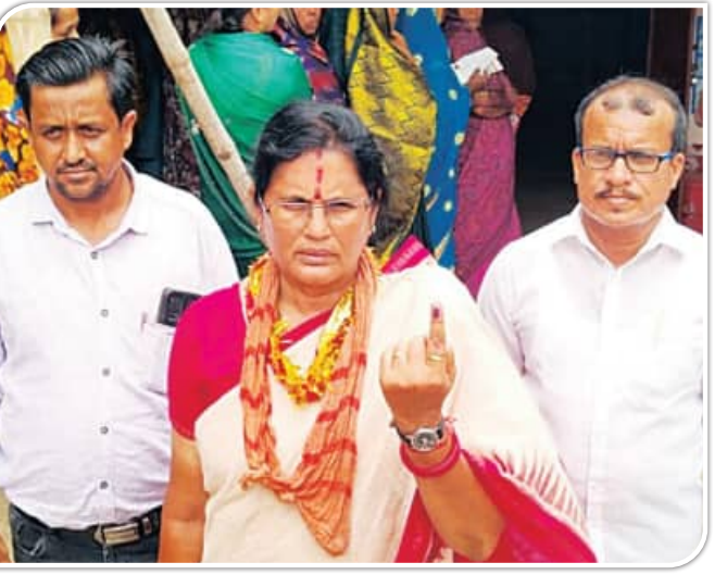
ନିମାପଡ଼ା, ୧।୬ (ସମିସ): ନିମାପଡ଼ା ନିର୍ବାଚନମଣ୍ଡଳୀ ୩୨ ପଞ୍ଚାୟତ, ୧୧ଟି ଓଡ଼ିଆ ଓ ଗୋପାଳ ରୁକ୍ମିଣୀ ୧୪ଟି ପଞ୍ଚାୟତକୁ ନେଇ

ଗୁଡ଼ିକରେ ସକାଳୁ ଭୋଟଦାତାମାନେ ଲମ୍ବାଲମ୍ବା ଲଗାଲଗାଣା ଶାନ୍ତିଶୃଙ୍ଖଳା ସହ ମତଦାନ କରିଛନ୍ତି। ଡେଇଁ ଯିବାକୁ ଲୋକମାନେ କେତୋଟି କୁଥି ଅଧିକ ସଂଖ୍ୟକ ଭୋଟ ଦାତା ଥିବାରୁ