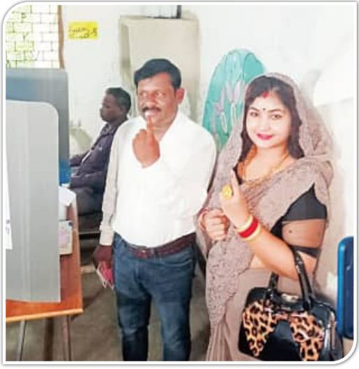
ନିମାପଡ଼ା, ୧।୬ (ସମିସ): ନିମାପଡ଼ା ନିର୍ବାଚନମଣ୍ଡଳୀ ୩୨ ପଞ୍ଚାୟତ, ୧୧ଟି ଓଡ଼ିଆ ଓ ଗୋପାଳ ରୁକ୍ମିଣୀ ୧୪ଟି ପଞ୍ଚାୟତକୁ ନେଇ

ଗଠିତ। ନିମାପଡ଼ା ୧୦୭ ବିଧାନସଭା କ୍ଷେତ୍ରରେ ନିମାପଡ଼ା ବ୍ଲକରେ ୧୯୬୯ଟି ମତଦାନ କେନ୍ଦ୍ରକୁ ୩୦ଟି ଆଦର୍ଶ ସଖି ମତଦାନ କେନ୍ଦ୍ର ହୋଇଥିବା ବେଳେ ସବୁ ମତଦାନ କେନ୍ଦ୍ର