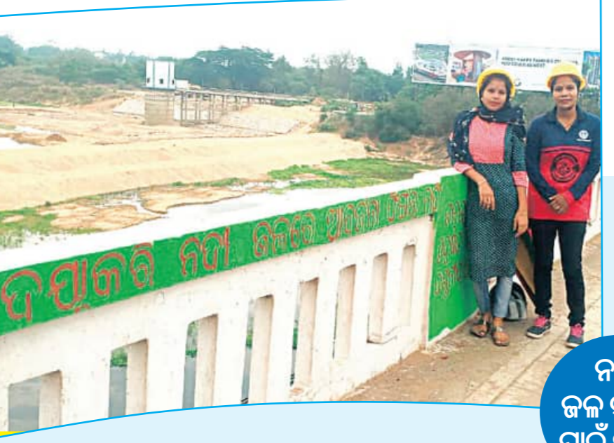
ନଦୀ ଜଳ ସୁରକ୍ଷା ପାଇଁ ପ୍ରୟାସ

ପ୍ରାୟତଃ ନିର୍ମିତଗାର ଥିବା ବେଳେ ଅଧିକ ଶକ୍ତି ଉପଭୋଗ ପ୍ରଭାବିତ ହେଉଥିବା କେତେକ କଳ୍ପନା କରାଯାଇଛି । ଶୁଣ୍ଠି ଉଦ୍ଧାରଣ ପ୍ରୋଗ୍ରାମ୍ ଇତିମଧ୍ୟ ୨୦୨୪ ଅନୁଯାୟୀ, ଜଳବାୟୁ ପରିବର୍ତ୍ତନ ଆରମ୍ଭ ହେଉଥିବା ସମ୍ଭାବନାକୁ ବୁଝାଇ ଦେଇଛି ।