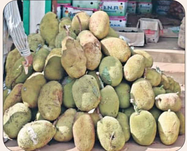
ଆସୁଛି ସାରିତ୍ରୀ, ଜମିଲାଣି ଫଳ ବଜାର