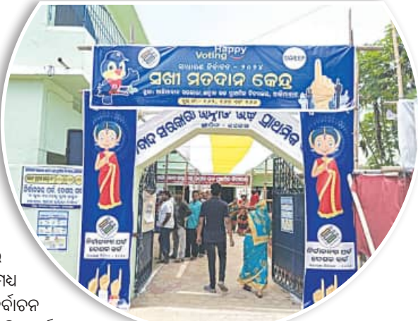
ମହିଳା ଭୋଟର ମାନେ ମଧ୍ୟ ଧାଡ଼ି କରି ଉତ୍ସାହର ସହ ଭୋଟ୍ ଦେଇଥିବା ଦୃଶ୍ୟ ନଜରକୁ ଆସିଥିଲା। ଏହି ସଖା ମତଦାନ କେନ୍ଦ୍ର ନିର୍ବାଚନ ଦାୟିତ୍ୱ ତୁଲାଇଛନ୍ତି ବିଭିନ୍ନ ସ୍ତରର ଶିକ୍ଷୟିତ୍ରୀ, ଅଧ୍ୟାପିକା ଓ ବ୍ୟାଙ୍କ ମହିଳା କର୍ମଚାରୀ। ସୂଚନାଯୋଗ୍ୟ, ବାଲେଶ୍ୱର ଜିଲ୍ଲାର ୮ଟି ବିଧାନସଭା ନିର୍ବାଚନ ମଣ୍ଡଳୀରେ ସର୍ବମୋଟ ୮୮୯୯ଟି ମିଶ୍ରିତ ରୁଥ୍ ରହିଛି। ଏଥିରୁ ୨୫୯୯ଟି ଆଦର୍ଶ ମତଦାନ କେନ୍ଦ୍ର ନିର୍ବାଚନ କରାଯାଇଛି ଯେଉଁଥିରେ ସଖା ମତଦାନ କେନ୍ଦ୍ର ୧୮୯୯ଟି, ଯୁବବର୍ଗଙ୍କ ଦ୍ୱାରା ପରିଚାଳିତ ମତଦାନ କେନ୍ଦ୍ର ୧୬୯ଟି, ପରିବେଶ ଅନୁକୂଳ ମତଦାନ କେନ୍ଦ୍ର ୨୨୯ଟି, ଜାତିଗତ ମତଦାନ କେନ୍ଦ୍ର ୧୫୯ଟି ଏବଂ

ଶେଷ ପର୍ଯ୍ୟାୟ ମତଦାନରେ 'ଆଇ ଆମ୍ ଏ ପ୍ରାଉଡ୍ ଭୋଟର' ଭାବେ ଭୋଟର ମାନେ ଭୋଟ୍ ସାଧ୍ୟତା କରିବା ପରେ ସେଲଫି ପଏଣ୍ଟରେ ସେଲଫି ନେଇଛନ୍ତି। ବାଲେଶ୍ୱରରେ ହୋଇଥିବା ବିଭିନ୍ନ ସଖା ମତଦାନ କେନ୍ଦ୍ରରେ ଭୋଟରମାନେ ବେଶ୍ ଶୁଣି ଉତ୍ସାହର ସହ ଭୋଟ୍ ଦେଇ ନିଜକୁ ଉତ୍ସାହ ମନେ କରିଥିବା କହିଛନ୍ତି। ଶେଷ ପର୍ଯ୍ୟାୟ ମତଦାନରେ ଓଡ଼ିଶାରେ ୬ଟି ଲୋକସଭା ଏବଂ ୪୨ଟି ବିଧାନସଭା ଆସନରେ ମତଦାନ ହୋଇଛି। ଏଥିରେ ବାଲେଶ୍ୱରରେ ମଧ୍ୟ ମତଦାନ ଶେଷ ହୋଇଛି। ଏହି ସାଧାରଣ ନିର୍ବାଚନ ପ୍ରକ୍ରିୟାରେ ମହିଳାମାନେ ମଧ୍ୟ ଦାୟିତ୍ୱ ତୁଲାଇଛନ୍ତି। ପୂର୍ବରୁ ପିଙ୍କ ରୁଥ୍ ଥିବାବେଳେ ବର୍ତ୍ତମାନ ସଖା ମତଦାନ କେନ୍ଦ୍ରରେ ନିର୍ବାଚନ ପରିଚାଳନାରେ ଗୁରୁତ୍ୱପୂର୍ଣ୍ଣ ଦାୟିତ୍ୱ ତୁଲାଇଛନ୍ତି ମହିଳା ଅଧିକାରୀ ଓ କର୍ମଚାରୀମାନେ। ତେବେ ଆଜି ଭୋଟରମାନେ ସେମାନଙ୍କ ନେତା ବାଛିବା ନେଇ ବେଶ୍ ଉତ୍ସାହିତ ଥିଲେ। ଏଥିରେ ମହିଳା ଭୋଟରମାନେ ମଧ୍ୟ ଉତ୍ସାହର ସହ ମତଦାନ କେନ୍ଦ୍ରରେ ପହଞ୍ଚି ମତ ସାଧ୍ୟତା କରିଛନ୍ତି। ଖରା ଓ ଗରମ ଥିବା ସତ୍ତ୍ୱେ ବି ନିଜର ମତଦାନ ଦେଇଛନ୍ତି। ଶନିବାର ରିଜ ବାଲେଶ୍ୱରରେ ମତଦାନ ସରିଥିବା ବେଳେ ଗରମ ଓ ଗୁଲୁଗୁଲିରେ ଅସ୍ତବ୍ୟସ୍ତ ହୋଇଥିଲେ ସମସ୍ତେ। ଏହାରି ଭିତରେ ସଖା ରୁଥ୍ ଗୁଡ଼ିକର ଦାୟିତ୍ୱରେ ଥିବା ମହିଳା ନିଜର ଦାୟିତ୍ୱ