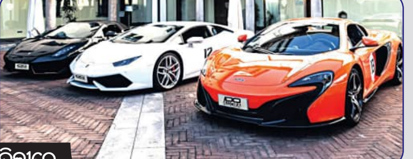
ମୁମ୍ବାଇ, ଦିଲ୍ଲୀରେ ବଢୁଛି ଚାହିଦା