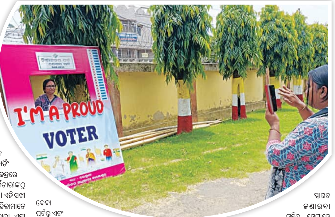
ଦେବା ପୂର୍ବରୁ ଏବଂ ଭୋଟ୍ ଦେବା ପରେ ମତଦାନ ପାଇଁ ଉତ୍ସାହିତ ମତଦାନ ପାଇଁ ଉତ୍ସାହିତ ଥିବା ଦେଖିବାକୁ ମିଳିଥିଲା। ରୁଥ୍ ପରିସରରେ ବୁଲି ଦେଖିବା ସହିତ ସେଲଫି ନେଇଛନ୍ତି। ଏହାବ୍ୟତୀତ କିଛି ଖରା ନିଜର ରୁଖି ପାନୀୟ ଜଳ ବ୍ୟବସ୍ଥା, ମତଦାନୀଙ୍କ ନିମନ୍ତେ ପାନୀୟ ଜଳ ବ୍ୟବସ୍ଥା କରାଯାଇଥିଲା।

ଅନ୍ୟାନ୍ୟ ଥିଏ ଆଧାରିତ ମତଦାନ କେନ୍ଦ୍ର ୧୫୯ଟି ରହିଥିଲା। ତେବେ ଜିଲ୍ଲାରେ ଥିବା ୧୮୮ ସଖା ମତଦାନ କେନ୍ଦ୍ରକୁ ମହିଳାମାନେ ପରିଚାଳନା କରିଥିଲେ। ୧୮୯ ସଖା ମତଦାନ କେନ୍ଦ୍ର ମଧ୍ୟରୁ ଜଳେଶ୍ୱରରେ ୧୫୯ଟି, ଭୋଗରାଇରେ ୧୦୯ଟି, ବସ୍ତାରେ ୨୯୯ଟି, ରେମୁଣା (ଏସସି)ରେ ୨୪୯ଟି, ନାଳଗିରିରେ ୧୪୯ଟି, ସୋର(ଏସସି)ରେ ୧୯୯ଟି, ସିପୁଲିଆରେ ୧୨୯ଟି ଏବଂ ବାଲେଶ୍ୱରରେ ୬୯୯ଟି ଖୋଲିଥିଲା। ବାଲେଶ୍ୱରର ବିଭିନ୍ନ ସ୍ତରର ଯଥା ଚରଣ ହାଇସ୍କୁଲ, ଜିଲ୍ଲା ସ୍କୁଲ, ସତ୍ୟବାଇ ବିଦ୍ୟାଳୟ, ଆଜିମାବାଦ ସରକାରୀ ଉଚ୍ଚ ପ୍ରାଥମିକ ବିଦ୍ୟାଳୟ ଆଦି ବିଭିନ୍ନ ବିଦ୍ୟାଳୟକୁ ସଖା କେନ୍ଦ୍ରରେ ପରିଣତ କରାଯାଇଥିଲା। ସଖା ମତଦାନ କେନ୍ଦ୍ର ପାଇଁ ପ୍ରବେଶ ରୋଟ୍ ନିକଟରେ ହୋଇଁ ଦିଆଯାଇଥିଲା। ଗୋଟିଏ ଲେଖାଏଁ ସଖା ମତଦାନ କେନ୍ଦ୍ରରେ ୬ ଜଣ ମହିଳା ଦାୟିତ୍ୱରେ ଥିଲେ। ପୂର୍ଣ୍ଣ କର୍ମଚାରୀଙ୍କୁ ଆରମ୍ଭ କରି ପ୍ରଜାଳିତ ଅଫିସର ବି ମହିଳା ରହିଛନ୍ତି। ଏହି ସଖା ମତଦାନ କେନ୍ଦ୍ର ତଥା ଭୋଟରଙ୍କ ସୁରକ୍ଷା ଦାୟିତ୍ୱ ମହିଳାମାନେ ବୁଝିଛନ୍ତି। ମହିଳା ପୋଲିଂ କର୍ମଚାରୀମାନଙ୍କ ଦ୍ୱାରା ଏହା ମତଦାନ କାର୍ଯ୍ୟ ପରିଚାଳନା କରାଯାଇଛି। ଗଣତନ୍ତ୍ରର ମହାପର୍ବ ନିର୍ବାଚନରେ ବିଦାହ ତଥା କୌଣସି ଏକ କାର୍ଯ୍ୟକ୍ରମର ଭ୍ରମ ସୃଷ୍ଟି କରିବା ଅନେକ ସଖା ମତଦାନ କେନ୍ଦ୍ର। କାରଣ ଅନେକ ସଖା ମତଦାନ କେନ୍ଦ୍ରରେ ବେଲୁନ୍ ରେ ସଜାଯାଇଥିଲା। ଭୋଟ