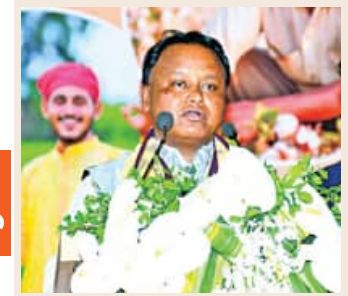
ରାଜ୍ୟର ୩୧.୬୨ ଲକ୍ଷ ଚାଷୀଙ୍କୁ ମିଳିଲା ୬୩୨.୪୮ କୋଟି ଟଙ୍କା

■ ଭୁବନେଶ୍ୱର, ୧୮।୬ (ସମ୍ବିଧ): ପ୍ରଧାନମନ୍ତ୍ରୀ କିଷାନ ସମ୍ମାନ ନିଧି ଯୋଜନାରେ ଆଜି ଓଡ଼ିଶାରେ ୩୧.୬୨ ଲକ୍ଷ ଟଙ୍କା ପାଇଛନ୍ତି ୬୩୨.୪୮ କୋଟି ଟଙ୍କା। ପ୍ରତ୍ୟେକ ପ୍ରତ୍ୟେକ ଚାଷୀଙ୍କ ବ୍ୟାଙ୍କ ଆକାଉଣ୍ଟକୁ ୨୦୦୦ ଟଙ୍କା ଲେଖାଏଁ ପ୍ରଦାନ କରାଯାଇଛି। ବାରଣାସୀରେ ଆୟୋଜିତ ରାଷ୍ଟ୍ରୀୟ କାର୍ଯ୍ୟକ୍ରମରେ ପ୍ରଧାନମନ୍ତ୍ରୀ ନରେନ୍ଦ୍ର ମୋଦୀ ଏହି କାର୍ଯ୍ୟକ୍ରମର ଶୁଭାରମ୍ଭ କରିଥିବା ବେଳେ ଓଡ଼ିଶାରେ ମୁଖ୍ୟମନ୍ତ୍ରୀ ମୋହନ ଚରଣ ମାଝୀ ଆଜି ବରଗଡ଼ରେ ପ୍ରଧାନମନ୍ତ୍ରୀ କିଷାନ ସମ୍ମାନ ଉତ୍ସବରେ ଯୋଗ ଦେଇଛନ୍ତି। ଏହି ଅବସରରେ