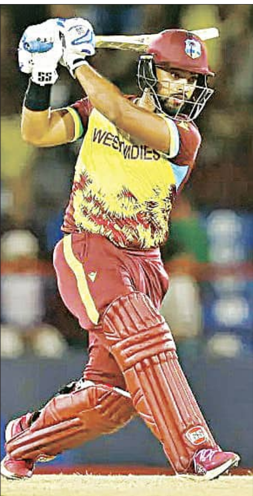
ସେଣ୍ଟ ଲୁସିଆ, ୧୮।୬ (ଏକେଡି): ଓକେଟ୍‌ରସକ ନିକୋଲସ ପୁରନଙ୍କ ବିଶ୍ୱୋତ୍ତର ଟି-୨୦ ବିଶ୍ୱକପର ଅନ୍ତିମ ଗ୍ରୁପ୍ ମ୍ୟାଚରେ ଆୟୋଜକ ଷ୍ଟେସ୍‌କ୍ରିକେଟ୍