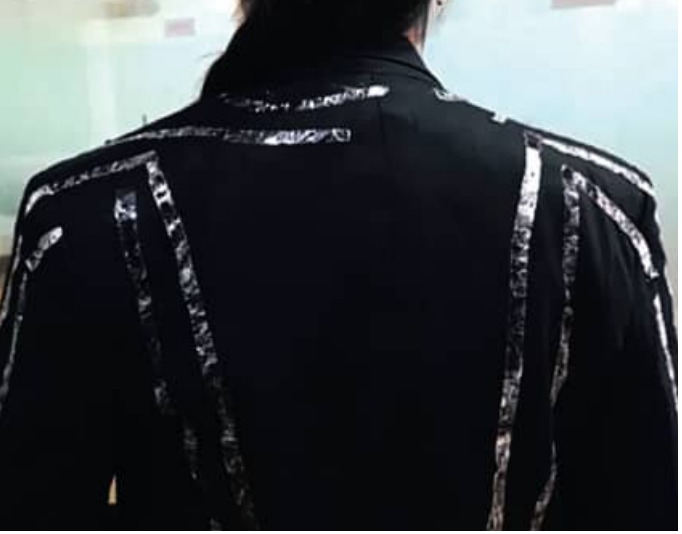
ପାଖରେ ପହଞ୍ଚିଯିବ । ଏହା ଜରୁରୀକାଳୀନ ପରିସ୍ଥିତିରେ ମହିଳା ଜଣକ ବେଉଥିବା ଇମେଜକୁ ନିର୍ମୂଳକରେ ସେ ବିପଦରେ ଅଛନ୍ତି ବୋଲି ମେସେଜ୍ ପଠାଇବ । ତେବେ ସମସ୍ତେ ଏହି ଜ୍ୟାକେଟ୍ଟୁ ବ୍ୟବହାର କରିପାରିବେ । ଏହି ସ୍ମାର୍ଟ ଜ୍ୟାକେଟ୍ଟୁ ମୂଲ୍ୟ ୪୦୦୦ଟଙ୍କା । ଏବେ ବି ତିନି ଇଞ୍ଜିନିୟର୍ ଏହି ଜ୍ୟାକେଟ୍ଟୁ ତିଆରି ଏବଂ ମାର୍କେଟିଂରେ ବ୍ୟସ୍ତ ଅଛନ୍ତି । ମହିଳାମାନେ ଏହାକୁ ପସନ୍ଦ କରିବେ ବୋଲି ସେମାନେ ଆଶା କରୁଛନ୍ତି ।