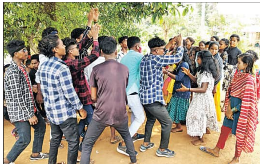
ଅନ୍ୟତ ବସବାସ କରୁଥିବା ଜନଜାତି ସମ୍ପଦାୟର ଗାଁକୁ ଯାଇଥାନ୍ତି। ଗାଁ ମୁଣ୍ଡରେ ରଜଦୋଳିର ବ୍ୟବସ୍ଥା ସାଙ୍ଗକୁ ବିବାହଯୋଗ୍ୟ ଯୁବତୀମାନେ ଏକତ୍ରିତ ହୋଇଥାନ୍ତି।

ବେତନଟା, ୧୮।୬(ସମ୍ବିଧ): ଓଡ଼ିଆମାନଙ୍କ ବାରମ୍ବାରରେ ତେରପର୍ବ ଭଳି ଓଡ଼ିଶାରେ ବସବାସ କରୁଥିବା ଭିନ୍ନଭିନ୍ନ ଜାତି ଏବଂ ଜନଜାତିକ ପର୍ବପର୍ବାଣି ସହିତ ଜଡ଼ିତ ରହିଛି ନିଆରା ପରମ୍ପରା; ଯାହାକୁ ନେଇ ସମ୍ପୂର୍ଣ୍ଣ ଜାତିର ରହିଥାଏ ଏତର ପରିଚୟ ସାଙ୍ଗକୁ ଚାଳିଚଳନ ଓ ସଂସ୍କୃତି। ସେହିଭଳି ଓଡ଼ିଶାରେ ବସବାସ କରୁଥିବା ଆଦିମ ଜନଜାତି ଖଡ଼ିଆ ସମ୍ପଦାୟ ପକ୍ଷରୁ ରଜସଂକ୍ରାନ୍ତି ଅବସରରେ ପାଳନ କରାଯାଇଥାଏ 'ଦିନିପାଳୀ'। ଏହା ଏହି ସମ୍ପଦାୟର ନିଆରା ପରମ୍ପରା। ଯେଉଁଥିରେ କେବଳ ଅବିବାହିତ ଯୁବକ/ଯୁବତୀ ଅଂଶଗ୍ରହଣ କରିଥାନ୍ତି। ଫଳରେ ଏହି ସମ୍ପଦାୟର ଯୁବକମାନେ ଆଖପାଖ ଖଡ଼ିଆ ସମ୍ପଦାୟ ବହୁଳ ଗାଁକୁ ଯାଇଥାନ୍ତି। ସେଠାରେ ବାଦୀଗୀତ ପ୍ରତିଯୋଗିତା ଆୟୋଜନ ହୋଇଥାଏ। ଆଉ ଏହି ବାଦୀଗୀତର ହାରଜିତ୍‌କୁ ହିଁ ସେମାନେ ତରଫ କରିଥାନ୍ତି ନିଜର ଜୀବନସାଥୀ। ପହିଲି ରଜରେ ସମସ୍ତେ ପିଠାପକା ଖାଇ ବୋଲିଖେଳ, ତାପଖେଳରେ ସମୟ ଅତିବାହିତ କରିଥାନ୍ତି। ବିଡ଼ାଏ ଏବଂ ଡ଼ୁଡ଼ାୟ ଦିନରେ ଖଡ଼ିଆ ସମ୍ପଦାୟର ଅବିବାହିତ ଯୁବକମାନେ