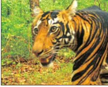
ବାଘ ରହିଛନ୍ତି। ଏଥିପାଇଁ ଶିମିଳିପାଳ ଅଭୟାରଣ୍ୟ ବିଶ୍ୱ ଚରବାରରେ ପ୍ରକାଶ ମଧ୍ୟ ସାଫିଟିଛି।

ନେଇ ଚର୍ଚ୍ଚା ଆରମ୍ଭ ହୋଇଛି। ଅପରପକ୍ଷେ, ଏହାକୁ ନେଇ ପଶୁପ୍ରୋକା ମଧ୍ୟରେ ଖୁସି ପ୍ରକାଶ ପାଇଛି। କିଛି ଦିନ ପୂର୍ବେ ଏକ କଳା ବାଘ ଓ ସାଧାରଣ ବାଘ ଛୁଆ ଶିମିଳିପାଳ ଅଭୟାରଣ୍ୟ ମଧ୍ୟରେ ଏକା ସାଙ୍ଗରେ ବିଚରଣ ସହ କଳା ବାଘ ଛୁଆ ଶିକାର କୌଶଳ ଶିଖୁଥିବାର ପଟେ ପିସିସିଏସ୍ ସେୟାର କରିଥିଲେ। ସୁତନାଯୋଗ୍ୟ, ଗତ ୨୦୨୨ର ବାଘ ଗଣନା ଅନୁଯାୟୀ, ମୟୂରଭଞ୍ଜ ଜିଲ୍ଲାର ଶିମିଳିପାଳ ଅଭୟାରଣ୍ୟରେ ୧୦ଟି କଳା