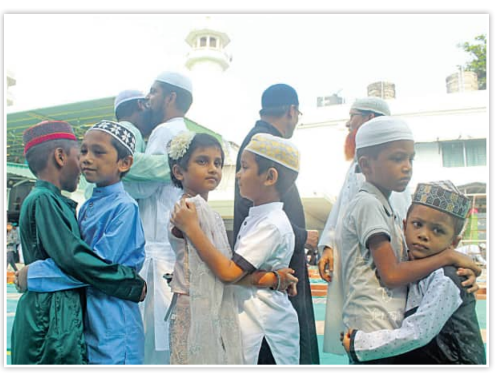
ଇନ୍-ଉଲ୍-ଲୁହା ଅବସରରେ ଭୁବନେଶ୍ୱର ସ୍କୁଲିଙ୍ଗ-୪ ମସିହାରେ ଶୁଭେଚ୍ଛା ଆବାନପ୍ରଦାନ