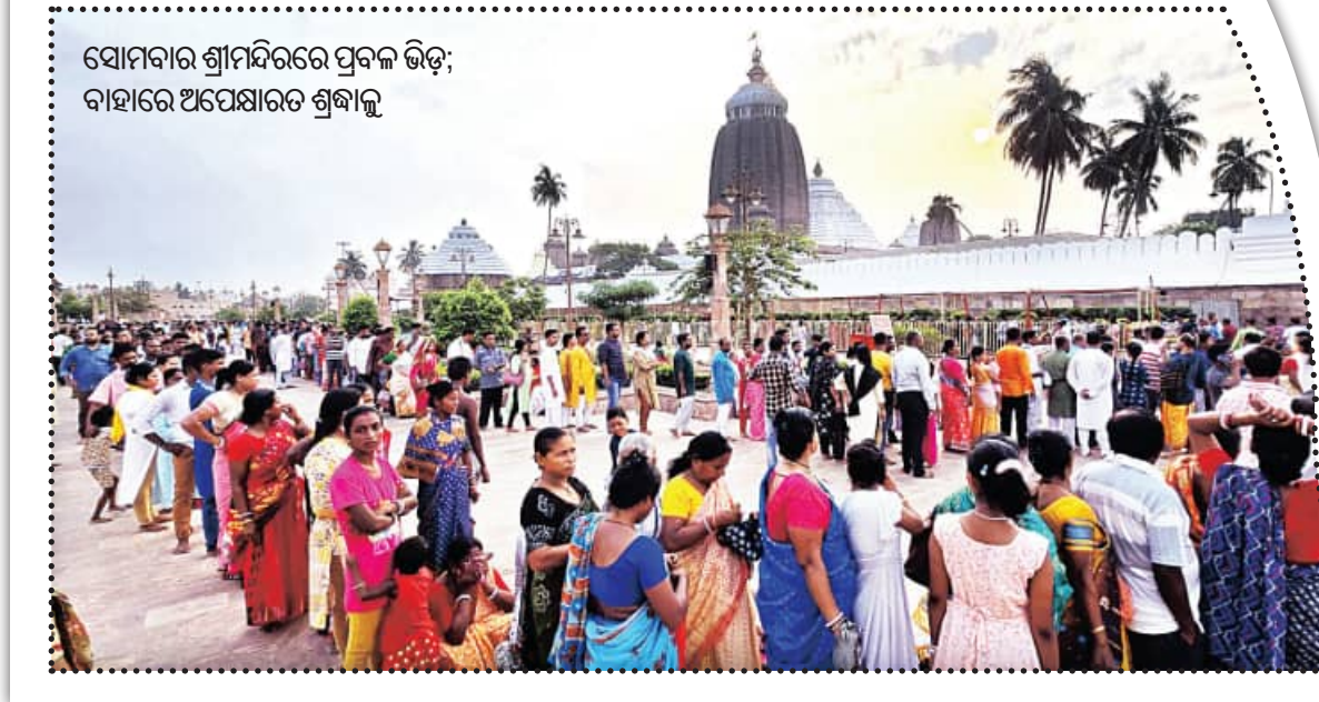
ସୋମବାର ଶ୍ରୀମନ୍ଦିରରେ ପ୍ରବଳ ଭିଡ଼; ବାହାରେ ଅପେକ୍ଷାରତ ଶ୍ରଦ୍ଧାଳୁ