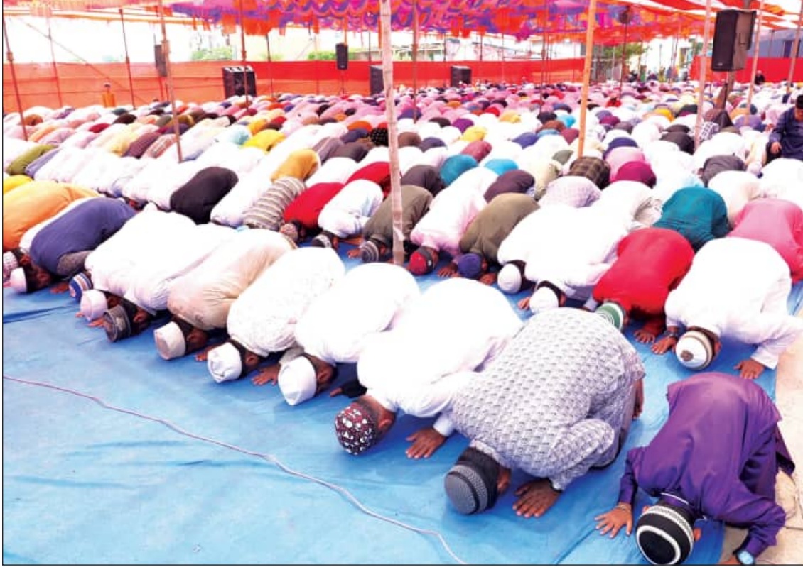
ଲକ୍ଷ୍ମୀ-ଭକ୍ତ-କୃତ୍ ଆବସରରେ ସୋମବାର ବ୍ରହ୍ମପୁର ସୋମନାଥ ନଗର ଜାମିଆ ମସଜିଦରେ ସମୂହ ନମାଜ ପାଠ