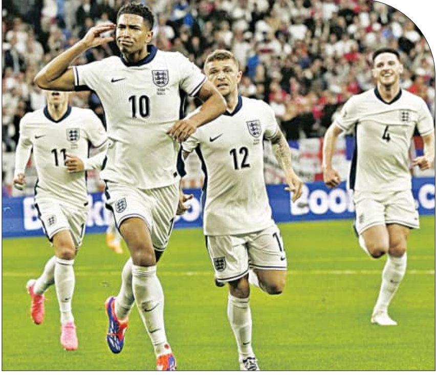
ଗୋଲ ଖେଳିବା ପରେ ଜୁଡ୍ ବେଲିଂହାମ୍ ଓ ସାଥୀ ଖେଳାଳି।