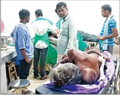
ଆଜି ହୋଇଥିବା ଆପୋଷ ସମାଧାନ ଗହୀର ମଝିରେ ଘଟିଲା ହତ୍ୟାକାଣ୍ଡ ଶବ୍ଦକୁ ଗୋଦାରେ ଘୋର ଅଣିଆ ପୁଲିସ୍ ଗଣ୍ଡଗୋଳ ଆଖକାରେ ଗାଁ କରିଛନ୍ତି ଯୋଗ୍ୟ

ଦଣ୍ଡପାଣିଙ୍କ ବେକକୁ ଚୋଟ ପକାଇଥିଲେ। ପକରେ ଘଟଣାସ୍ଥଳରେ ଦଣ୍ଡପାଣିଙ୍କ ମୃତ୍ୟୁ ହୋଇଯାଇଥିଲା।