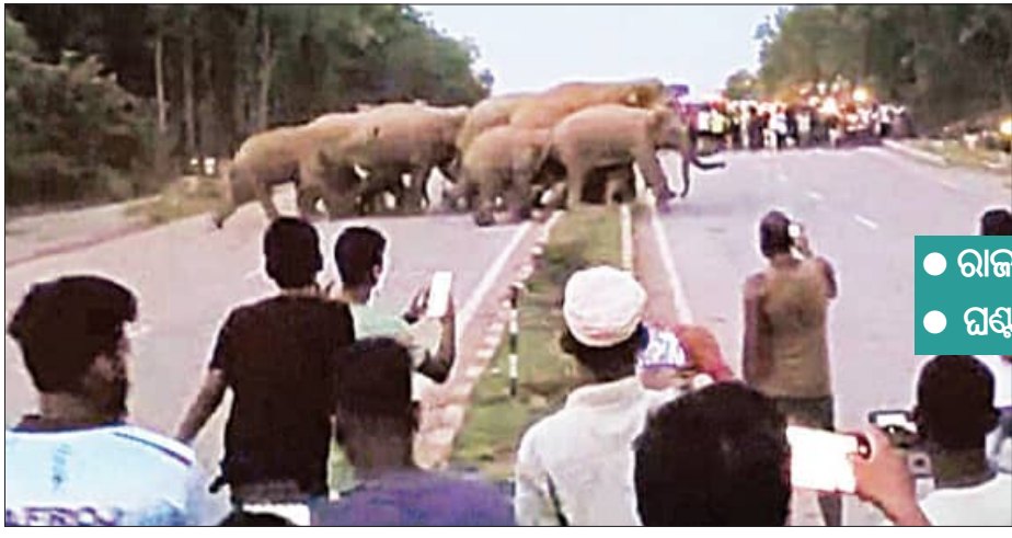
ଭୁବନେଶ୍ୱର, ୧୬।୬ (ସମିପ)

କେନ୍ଦୁଝର ଜିଲ୍ଲା ପାଟଣା ରେଞ୍ଜର ବିଭାଗ ସମ୍ପାଦକଙ୍କ ନେତୃତ୍ୱରେ ୨୭ ଝାରଖଣ୍ଡୀ ହାତୀପଲ ଧସେଇ ପଶିଛି। ହାତୀପଲ ନରାଜିଆ ସେକ୍ସନ୍ ଯୋଗ୍ୟ ଅଞ୍ଚଳକୁ ଆସି ଚଢ଼େଇଭୋଲ ନିକଟରେ ୪ଟି ନମୁନା ଜାତୀୟ