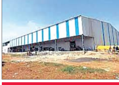
ପିପିପିରେ ହୋଇଥାନ୍ତା କାର୍ଯ୍ୟକ୍ଷମ

କଟକ, ୧୬।୬(ସମ୍ବିଧ): କୃଷି ପ୍ରଧାନ କଟକ ଜିଲ୍ଲାରେ ଉତ୍ପାଦିତ ପରିପରିବା ସଂରକ୍ଷଣ ପାଇଁ ଆବଶ୍ୟକ ଶାତଳଭଣ୍ଡାର ଆରମ୍ଭ ରହିଆସିଛି । ଜିଲ୍ଲାରେ ସମବାୟ ବିଭାଗର ଥିବା ବହୁ ଶାତଳଭଣ୍ଡାର ଦୀର୍ଘ ଦଶନ୍ଧି ଧରି ଅଚଳ ହୋଇପଡ଼ିଛି । ତେବେ ଏହି ଶାତଳଭଣ୍ଡାର ଗୁଡ଼ିକ କେବେ କାର୍ଯ୍ୟକ୍ଷମ ହେବ ସେନେଇ ସାଧାରଣରେ ପ୍ରଶ୍ନବାଚୀ ସୃଷ୍ଟି ହୋଇଛି । ଯାହାକୁ ପୂର୍ବକ ପ୍ରାଇଭେଟ ପାର୍ଟନରସିପି (ପିପିପି) ରେ ପୁନରୁଦ୍ଧାର କରିବା ପାଇଁ ଏକ ପ୍ରୟାସ ହୋଇଥିଲା । ଏପରିକି ଜିଲ୍ଲାରେ ୪ଗୋଟି ଶାତଳଭଣ୍ଡାର ପିପିପିରେ ସ୍ଥାନ କରାଯିବ କଥା ହେଲେ ବର୍ଷାଧିକ କାଳ ଧରି ଏହି ନିଷ୍ପତ୍ତି ମଧ୍ୟ ହୁଇପାରେ । କଟକ ଜିଲ୍ଲା ସମବାୟ ବିଭାଗର ଉପନିବନ୍ଧକଙ୍କ କହିବାମୁତାବେଳେ ଜିଲ୍ଲାର ଅଚଳ ହୋଇପଡ଼ିଥିବା ସମବାୟ ବିଭାଗର ୪ଗୋଟି ଶାତଳଭଣ୍ଡାରକୁ ପୂର୍ବକ ପ୍ରାଇଭେଟ ପାର୍ଟନରସିପି (ପିପିପି)ରେ ରଚାଯିବା ପାଇଁ ବାଟ ଫିଟିଥିଲା । ଏପରିକି ଏପ୍ରକାର ସମସ୍ତ ପ୍ରସ୍ତୁତି ଶେଷ ହୋଇଥିବା ବେଳେ ଏହା ସରକାରଙ୍କ ବିଚାରାଧୀନ ରହିଛି । ସାଲେପୁରର ବହୁଗ୍ରାମ, କଟକ ସଦରର ବୟାଳିଶମୌଳି, ନିଆଳି ନିର୍ବାହନମଣ୍ଡଳୀ ଅନ୍ତର୍ଗତ ଲକ୍ଷେଶ୍ୱର ଓ ଆଠଗଡ଼ରେ ବନ୍ଦ ହୋଇପଡ଼ିଥିବା ସମବାୟ ଶାତଳଭଣ୍ଡାରକୁ ପିପିପିରେ ରଚାଯିବା ପାଇଁ ଏକାଧିକ ଆବେଦନ ହୋଇଥିଲା । ଆବେଦନକାରୀ ମାନଙ୍କ ପକ୍ଷରୁ ସମବାୟ ନିବନ୍ଧକଙ୍କ କାର୍ଯ୍ୟକ୍ରମରେ ଏନେଇ ତଥ୍ୟ ଉପସ୍ଥାପନ କରାଯିବା ପରେ ଏହାକୁ ସରକାରଙ୍କ ନିକଟକୁ ପଠାଯାଇଥିଲା ।