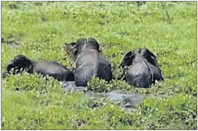
ବଡ଼ମ୍ବା, ୧୬।୬ (ସମିପ): ବଡ଼ମ୍ବା ନାଳରେ ୩ଟି ଦନ୍ତା ଫସିଥିବା ସୂଚନା ମିଳିଛି।