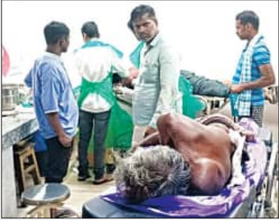
ଆଜି ହୋଇଥିବା ଆପୋଷ ସମାଧାନ ଗହୀର ମଝିରେ ଘଟିଲା ହତ୍ୟାକାଣ୍ଡ ଶବ୍ଦକୁ ଗୋଧରେ ଘୋର ଅଣିଆ ପୁଲିସ୍ ଗଣ୍ଡଗୋଳ ଆଖକାରେ ଗାଁ କରିଛନ୍ତି ଯୋଗ୍ୟ

ଦଣ୍ଡପାଣିଙ୍କ ବେକକୁ ଚୋଟ ପକାଇଥିଲେ। ପକରେ ଘଟଣାସ୍ଥଳରେ ଦଣ୍ଡପାଣିଙ୍କ ମୃତ୍ୟୁ ହୋଇଯାଇଥିଲା।