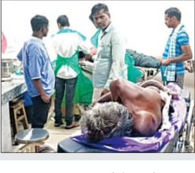
ଆଜି ହୋଇଥିବା ଆଠୋଟି ସମାଧାନ ଗହୀର ମଝିରେ ଘଟିଲା ହତ୍ୟାକାଣ୍ଡ ଶବ୍ଦକୁ ଘାନରେ ଘୋର ଅଣିଆ ପୁଲିସ୍ ଗଣଗୋଳ ଆଖକାରେ ଗାଁ କରିଛନ୍ତି ଯୋଗ୍ୟ

ଦଣ୍ଡପାଣିଙ୍କ ବେକକୁ ଚୋଟ ପକାଇଥିଲେ। ପକରେ ଘଟଣାସ୍ଥଳରେ ଦଣ୍ଡପାଣିଙ୍କ ମୃତ୍ୟୁ ହୋଇଯାଇଥିଲା।