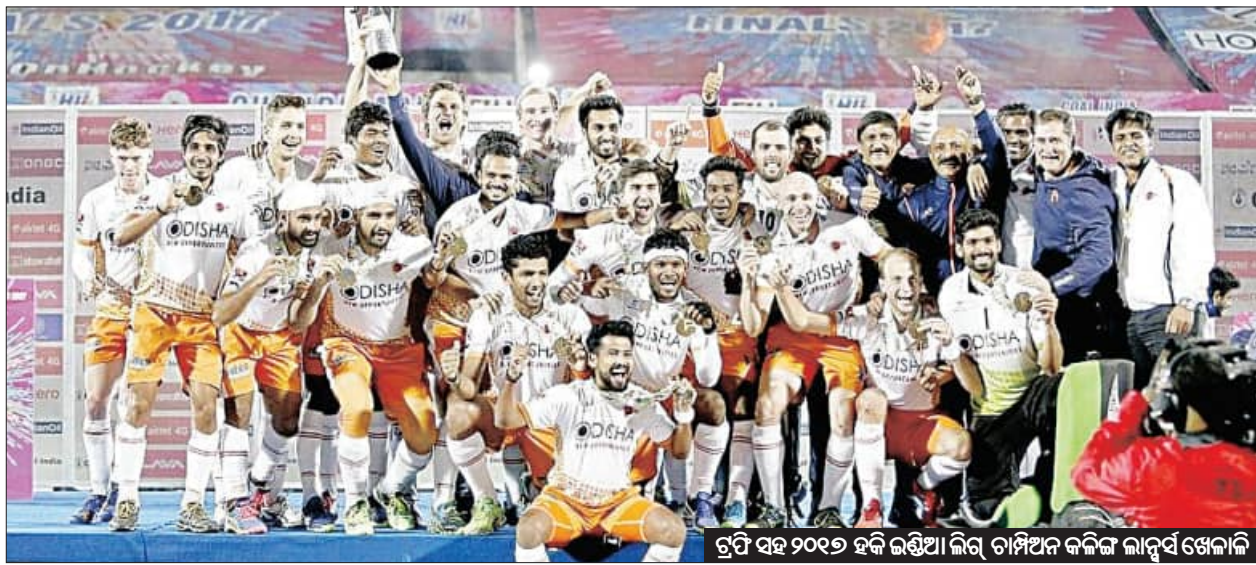
ରୁପି ସହ ୨୦୧୬ ହକି ଇଣ୍ଡିଆ ଲିଗ୍ ଚାମ୍ପିଅନ କଳିଙ୍ଗ ଲାନ୍ଦୁର୍ସ ଖେଳାଳି

ନୂଆଦିଲ୍ଲୀ, ୧୪।୬ (ଏକେନ୍ଦ୍ର): ଦୀର୍ଘ ୮ ବର୍ଷ ପରେ ହାଇଦ୍ରାବାଦରେ ହକି ଇଣ୍ଡିଆ ଲିଗ୍ (ଏସଆଇଏଲ) ପ୍ରଦୀପାରଣ କରିବାର ପ୍ରକ୍ରିୟା ଆରମ୍ଭ ହୋଇଛି । ୨୦୧୬ରେ ଶେଷପଥ ପାଇଁ ଏହି ଲିଗ୍ ଖେଳାଯାଇଥିଲା । ଏହାପରେ ଆର୍ଥିକ ସମସ୍ୟା ତଥା ବିଭିନ୍ନ କାରଣରୁ ଏହାକୁ ବନ୍ଦ କରି ଦିଆଯାଇଥିଲା । ଏହି ଲିଗ୍ ପୁଣି ଥରେ ଆରମ୍ଭ କରିବାକୁ ଗତବର୍ଷ ହକି ଇଣ୍ଡିଆ ଗୋଷ୍ଠୀ କରିଥିଲା । ହକି ଇଣ୍ଡିଆ ଲିଗ୍ରେ ମହିଳା ଫର୍ଷ୍ଟ ଡିଭିଜନ ଆରମ୍ଭ କରିବାକୁ ମଧ୍ୟ ଗୋଷ୍ଠୀ କରାଯାଇଥିଲା । ଅର୍ଥାତ୍ ଏଥର ମହିଳା ହକି ଇଣ୍ଡିଆ ଲିଗ୍ ପଦାର୍ପଣ କରିବାର ପଥ ପରିଷ୍କାର ହୋଇଛି । ଲିଗ୍ରେ ୨୦୨୪-୨୫ ଫର୍ଷ୍ଟ ଡିଭିଜନରେ ୮ଟି ପୁରୁଷ ଓ ୬ଟି ମହିଳା ଦଳ ସାମିଲ ହେବେ । ପ୍ରଥମଥର ପାଇଁ ମହିଳା ଦଳକୁ ଲିଗ୍ରେ ନେଇ ହକି ଇଣ୍ଡିଆ ଲିଗ୍ ଖେଳାଯିବ ବୋଲି ହକି