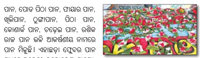
ଖୋର୍ଦ୍ଧା, ୧୪.୬ (ସମିପ)

ପହିଲି ରଜରେ ଗାଁଠାରୁ ସହର ସରୁଆଡ଼େ ବେଶ୍ ଚଳଚଞ୍ଚଳ। ରଜ ପାଇଁ ବଜାରରେ ମଧ୍ୟ ପ୍ରବଳ ଭିଡ଼। ଭଲିକି ଭଲି ପାନ ପସରାକୁ ନେଇ ବିଭିନ୍ନ ସ୍ଥାନରେ ସ୍ଵରଜ ରଜପାନ ଦୋକାନ ଖୋଲିଛି। ଥିବା ବେଳେ ପାରମ୍ପରିକ ରଜର ମଜା ନେବାକୁ ଗାଁଲେଖା ହେଉଛନ୍ତି ସହରବାସୀ।