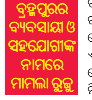
ବୁଢ଼ପୁରର ବ୍ୟବସାୟୀ ଓ ସହଯୋଗୀଙ୍କ ନାମରେ ମାମଲା ରୁଜୁ