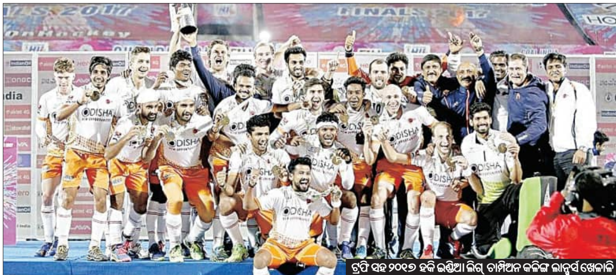
ରୁପି ସହ ୨୦୧୭ ହକି ଇଣ୍ଡିଆ ଲିଗ୍ ଚାମ୍ପିଅନ କଳିଙ୍ଗ ଲାନ୍ସ୍ ଖେଳାଳି

ନୂଆଦିଲ୍ଲୀ, ୧୪।୬ (ଏକେସ୍ପ୍ରେସ୍): ଦୀର୍ଘ ୮ ବର୍ଷ ପରେ ହାଇପ୍ରୋପାଲକ ହକି ଇଣ୍ଡିଆ ଲିଗ୍ (ଏସଆଇଏଲ) ପ୍ରତ୍ୟାବର୍ତ୍ତନ କରିବାର ପ୍ରକ୍ରିୟା ଆରମ୍ଭ ହୋଇଛି । ୨୦୧୭ରେ ଶେଷପଥର ପାଇଁ ଏହି ଲିଗ୍ ଖେଳାଯାଇଥିଲା । ଏହାପରେ ଆର୍ଥିକ ସମସ୍ୟା ତଥା ବିଭିନ୍ନ କାରଣରୁ ଏହାକୁ ବନ୍ଦ କରି ଦିଆଯାଇଥିଲା । ଏହି ଲିଗ୍ ପୁଣି ଥରେ ଆରମ୍ଭ କରିବାକୁ ଗତବର୍ଷ ହକି ଇଣ୍ଡିଆ ଗୋଷ୍ଠୀ ଗଠିଥିଲା । ହକି ଇଣ୍ଡିଆ ଲିଗ୍‌ର ମହିଳା ଫର୍ମେଟ ଆରମ୍ଭ କରିବାକୁ ମଧ୍ୟ ଗୋଷ୍ଠୀ ଗଠାଯାଇଥିଲା । ଅର୍ଥାତ୍ ଏଥର ମହିଳା ହକି ଇଣ୍ଡିଆ ଲିଗ୍ ପଦାର୍ପଣ କରିବାର ପଥ ପରିଷ୍କାର ହୋଇଛି । ଲିଗ୍‌ର ୨୦୨୪-୨୫ ଫର୍ମେଟରେ ୮ଟି ପୁରୁଷ ଓ ୬ଟି ମହିଳା ଦଳ ସାମିଲ ହେବେ । ପ୍ରଥମଥର ପାଇଁ ମହିଳା ଦଳକୁ ଲିଗ୍‌ରେ ନେଇ ହକି ଇଣ୍ଡିଆ ଲିଗ୍ ଖେଳାଯିବ ବୋଲି ହକି