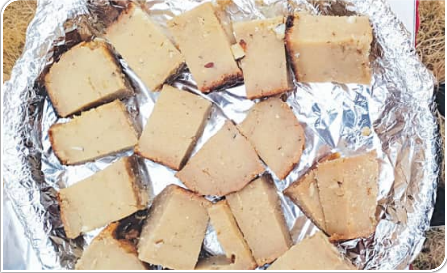
ବାଲେଶ୍ୱର, ୧୪.୬ (ସମ୍ପାଦକ):