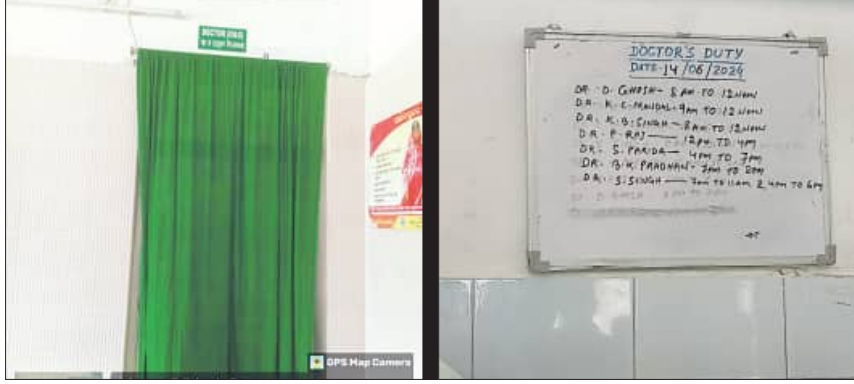
ହେଉ ଏବଂ କୌଣସି ସାହାଯ୍ୟ ଗତ ସମୟା ହେତୁ ଲୋକମାନେ ନିଜର ମୂଲ୍ୟବାନ ଜୀବନକୁ ବଞ୍ଚାଇବା ପାଇଁ ଜଳେଶ୍ୱର ଗୋପାଳିଶନ ଗୋଷ୍ଠୀ ସାହାଯ୍ୟକେନ୍ଦ୍ରକୁ ଆସିଥାନ୍ତି । ହେଲେଏଠାରେ ସାହାଯ୍ୟ ସେବା ସମ୍ପୂର୍ଣ୍ଣ

ବାଲେଶ୍ୱର ଜିଲ୍ଲାର ଏକ ଉପାନ୍ତ ଅଞ୍ଚଳ ଭାବରେ ପରିଗଣିତ ଜଳେଶ୍ୱର ବ୍ଲକ୍ । ଏହା ଓଡ଼ିଶା ଓ ପଶ୍ଚିମବଙ୍ଗ ସୀମାରେ ଅବସ୍ଥିତ । ଏଠାରେ ରାଜବଣିଆ ଅଞ୍ଚଳର ୧୪ଟି ଗ୍ରାମପଞ୍ଚାୟତ ସହିତ ଜଳେଶ୍ୱର ଅଞ୍ଚଳର ୧୪ଟି ଗ୍ରାମ ପଞ୍ଚାୟତର ରହିଛି । ତତ୍ ସହିତ ମୁନସିପାଲିଟି ଅଞ୍ଚଳର ୧୭ଗୋଟି ଖାତ ରହିଛି । ସେହିପରି ଜଳେଶ୍ୱର ବ୍ଲକ୍ ୬୦ ନମ୍ବର ଜାତୀୟ ରାଜପଥ ଯାଇଛି ଓ ଜଳେଶ୍ୱର ରେଳ ଷ୍ଟେସନ ଉପରେ ପାଖ ବୁକ୍ ଭୋଗରାଜ ସମତେ ପଶ୍ଚିମବଙ୍ଗରୁ ଲୋକମାନେ ବିଭିନ୍ନ କାମରେ ଜଳେଶ୍ୱର ଉପରେ ନିର୍ଭରଶୀଳ ହୋଇଥାନ୍ତି । ଯେହେତୁ ଜଳେଶ୍ୱର ବ୍ଲକ୍ ରାଜ୍ୟ ରାଜପଥ ଯାଇଛି ବିଭିନ୍ନ ସମୟରେ ବୁର୍ଲାଠାରୁ ହେତୁ କିମ୍ବା ସାପ କାମୁଡ଼ା