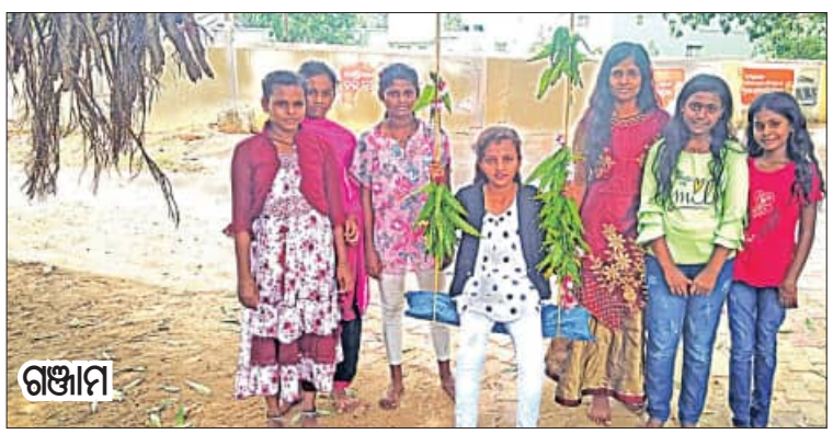
ଗଞ୍ଜାମ, ୧୪।୬ (ସମିପ)

ଆଧୁନିକତାର ପ୍ରଭାବରେ ଧରେ ଧରେ ସହରା ସଭ୍ୟତାରେ ରଜ ପର୍ବ ପିଲା ପଢୁଥିବା ଲକ୍ଷ୍ୟ କରାଯାଇଛି। ହେଲେ ଗ୍ରାମ୍ୟ ସଭ୍ୟତାରେ ବିଭିନ୍ନ ଗଛରେ ଗ୍ରାମ୍ୟ କୁମାରୀ ମାନେ ଦୋଳି ଖେଳି ଓଡ଼ିଶାର ଗଣପର୍ବ ରଜ ପର୍ବ ପାଳନ କରୁଥିବା ଦେଖିବାକୁ ମିଳିଛି। ଗଞ୍ଜାମ ଏନଏସି ଅନ୍ତର୍ଗତ ବାମୋଦରପୁରରେ ବିଭିନ୍ନ ଗଛ ମାନଙ୍କରେ ଦୋଳିଖେଳ ଖେଳାଯାଉଥିବା ଦେଖିବାକୁ ମିଳିଛି। ବିଶେଷକରି ପହିଲି ରଜ ଅବସରରେ ଗ୍ରାମ୍ୟ କୁମାରୀ ମାନେ ରଜ ଦୋଳି ଖେଳିବା ସହ ବିଭିନ୍ନ ରଜ ଦୋଳି ଗାତ ରେ ସ୍ଥାନୀୟ ପରିବେଶ ଉତ୍ସବ ମୁଖର ହୋଇଉଠିଛି। କିଶୋରୀ ବାଳିକା ମାନେ ମିଠା ପାନ ଖାଇବା ସହ ପୋଡ଼ିଠି ଖାଇ ରଜ ମଉଜ କରୁଥିବା ଲକ୍ଷ୍ୟ କରାଯାଇଛି। ସେହିପରି ବିଭିନ୍ନ ଗ୍ରାମରେ ରଜଦୋଳି ଖେଳ ଯୋଗୁଁ କୁମାରୀ ମାନେ ଆନନ୍ଦ ଭଙ୍ଗାସରେ ଏହି ପର୍ବ ପାଳନ କରୁଛନ୍ତି।