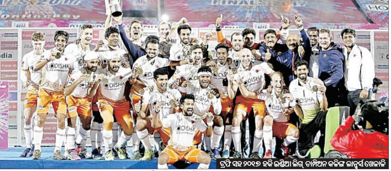
ରୁପି ସହ ୨୦୧୭ ହକି ଇଣ୍ଡିଆ ଲିଗ୍ ଚାମ୍ପିଅନ କଳିଙ୍ଗ ଲାନ୍ସ୍ ଖେଳାଳି

ନୂଆଦିଲ୍ଲୀ, ୧୪।୬ (ଏକେନ୍ଦ୍ର): ଦୀର୍ଘ ୮ ବର୍ଷ ପରେ ହାଇପ୍ରୋପାଲକ ହକି ଇଣ୍ଡିଆ ଲିଗ୍ (ଏସଆଇଏଲ) ପ୍ରତ୍ୟାବର୍ତ୍ତନ କରିବାର ପ୍ରକ୍ରିୟା ଆରମ୍ଭ ହୋଇଛି । ୨୦୧୭ରେ ଶେଷପଥ ପାଇଁ ଏହି ଲିଗ୍ ଖେଳାଯାଇଥିଲା । ଏହାପରେ ଆର୍ଥିକ ସମସ୍ୟା ତଥା ବିଭିନ୍ନ କାରଣରୁ ଏହାକୁ ବନ୍ଦ କରି ଦିଆଯାଇଥିଲା । ଏହି ଲିଗ୍ ପୁଣି ଥରେ ଆରମ୍ଭ କରିବାକୁ ଗତବର୍ଷ ହକି ଇଣ୍ଡିଆ ଗୋଷ୍ଠୀ ଗଠିଥିଲା । ହକି ଇଣ୍ଡିଆ ଲିଗ୍‌ର ମହିଳା ଫର୍ମେଟ ଆରମ୍ଭ କରିବାକୁ ମଧ୍ୟ ଗୋଷ୍ଠୀ ଗଠାଯାଇଥିଲା । ଅର୍ଥାତ୍ ଏଥର ମହିଳା ହକି ଇଣ୍ଡିଆ ଲିଗ୍ ପଦାର୍ପଣ କରିବାର ପଥ ପରିଷ୍କାର ହୋଇଛି । ଲିଗ୍‌ର ୨୦୨୪-୨୫ ଫର୍ମେଟରେ ୮ଟି ପୁରୁଷ ଓ ୬ଟି ମହିଳା ଦଳ ସାମିଲ ହେବେ । ପ୍ରଥମଥର ପାଇଁ ମହିଳା ଦଳକୁ ଲିଗ୍‌ରେ ନେଇ ହକି ଇଣ୍ଡିଆ ଲିଗ୍ ଖେଳାଯିବ ବୋଲି ହକି