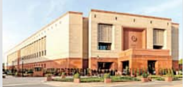
ଜୁଲାଇ ମାସରେ ଅର୍ଥନୈତିକ ସର୍ବୋଚ୍ଚ ଉପସ୍ଥାପନ

■ ନୂଆଦିଲ୍ଲୀ, ୧୫୬ (ଏକେନି): ସଂସଦର ମୌସୁମୀ ଅଧିବେଶନରେ ଉପସ୍ଥାପନ ହେବ କେନ୍ଦ୍ର ବଜେଟ। ଅର୍ଥମନ୍ତ୍ରୀ ନିର୍ମଳା ସୀତାରମଣ ଜୁଲାଇ ୨୨ରେ ସଂସଦରେ ବେଶର ଏହି ସାଧାରଣ ବଜେଟକୁ ଆଗତ କରିବେ। ଏହାବ୍ୟତୀତ ଜୁଲାଇ ମାସରେ ସରକାରଙ୍କ ଦ୍ୱାରା ଅର୍ଥନୈତିକ ସର୍ବୋଚ୍ଚ ଉପସ୍ଥାପନ କରାଯିବ। ଗତ ସାଧାରଣ ନିର୍ବାଚନ ପୂର୍ବରୁ ଅନ୍ତରାଳ ବଜେଟ ଶୋଭାପାଳିଥିଲା। ବର୍ତ୍ତମାନ ପରେ ବେଶର ଅଭିବୃଦ୍ଧି ଗତିକୁ ଆଗେଇନେବା ଏବେ ଅର୍ଥ ମନ୍ତ୍ରୀଙ୍କ ଆଗରେ ଲୋକସଭା ନିର୍ବାଚନ ଶେଷ ହେବା ପରେ ନୂଆ ସରକାର ଗଠନ ବଡ଼ ଆହ୍ୱାନ ଭାବେ ଛିଡା ହୋଇଛି।