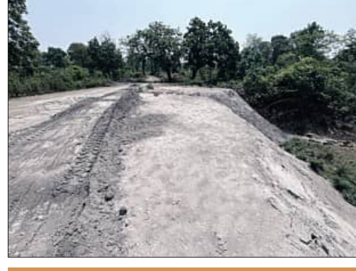
ପୂର୍ବତନ ବିଧାୟକଙ୍କ ଭାଇଙ୍କ ସମ୍ପୃକ୍ତ ଅଭିଯୋଗ

ସମ୍ବଲପୁର-ଅନୁଗୋଳ ଜାତୀୟ ଶାସ୍ତ୍ରୀୟ ରାଜପଥ ୫୫ ପ୍ରସ୍ତୁତି କରାଣ କାମ ପାଇଁ ବ୍ୟବହାର ହେବାକୁ ଯାଉଥିବା ପାଇଁ ବେଆଇନ ଭାବେ ଜାମଟାଳରେ ପକାଇବା ଘଟଣାରେ ପ୍ରତିକ୍ରିୟା ଦେଇ ଏନଏଚଆଇ ପିଡି ଡିଏଚ୍ ଚୌଧୁରୀ କହିଛନ୍ତି ଯେ, ଜାତୀୟ ରାଜପଥ କାମରେ ବ୍ୟବହାର ପାଇଁ ବିଭାଗ ପକ୍ଷରୁ ଅନୁମତି ଦିଆଯାଇଥାଏ। ପାଇଁ ବେଆଇନ କମ୍ପାନୀକୁ ଚିଠି କରାଯାଇଥାଏ। କେଉଁ ସ୍ଥଳରେ କେତେ ପରିମାଣ ପାଇଁ