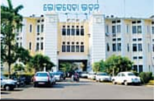
ମୁଖ୍ୟ ସଚେତକ ପଦ ଉପରେ ନଜର