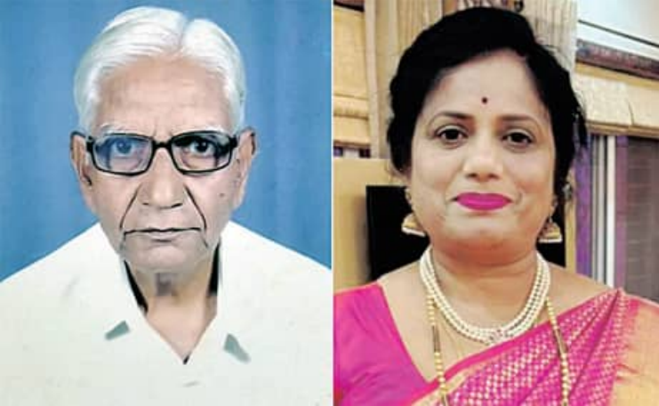
କୋଟିଏ ଟଙ୍କାରେ ଦେଇଥିଲା ସୁପାରି