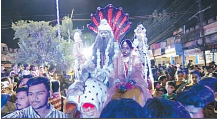
ବରଗଡ଼, ୧୨।୬ (ସମିପ):

ବରଗଡ଼ ଗୌରାଶଙ୍କର ମନ୍ଦିର ଶାତଳ ଷଷ୍ଠୀ ମହୋତ୍ସବର ଚୋପା ଉପଲକ୍ଷେ ପାଳିତ ହୋଇଥିଲା। ଶ୍ରୀକାଳୀ ଓ ଶ୍ରୀଦେବୀଙ୍କୁ ପ୍ରତ୍ୟାବର୍ତ୍ତନ ପରେ ଉତ୍ସବ ସମାପ୍ତ ହୋଇଛି।