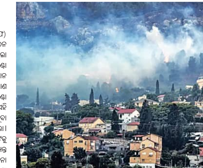
କାର୍ଯ୍ୟାନୁଷ୍ଠାନ ଗ୍ରହଣ କରି ହିଜବୁଲ୍ଲାହର ଅନେକ ରକେଟ ଲାଞ୍ଚକୁ ଧ୍ଵସ୍ତ କରିଦେଇଛି । ଲେବନାନ ସାମା ୧୦ କିମି ମଧ୍ୟରେ ରହୁଥିବା ଅଧିକାଂଶ କମାଣ୍ଡର ମୃତ୍ୟୁ ହେବା ପାଇଁ କୁହାଯାଇଛି ।