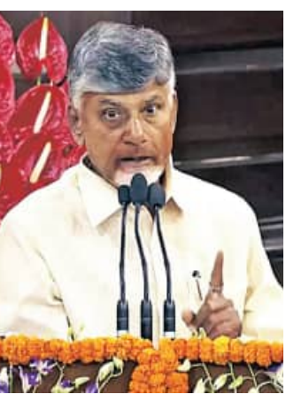
ନନ୍ଦା, କେନ୍ଦ୍ର ସେବାମିତ୍ର କମଳା ଚଳାଚଳ ବିଭାଗ ମନ୍ତ୍ରୀ ରାମ ମୋହନ ନାଲୁ, କେନ୍ଦ୍ର ଗୃହ ମନ୍ତ୍ରୀ ଶାନ୍ତ କେନ୍ଦ୍ର ସ୍ଵାସ୍ଥ୍ୟ ମନ୍ତ୍ରୀ ଜେପି

ଚେଲୁଗୁ ଦେଶମ୍ ପାର୍ଟି(ବିଡିପି) ସୁପ୍ରିମୋ ନାରାୟଣକୁମାରଙ୍କୁ ଆଜି ବିଜୟସାହାରେ ଆୟୋଜିତ ଏକ ଭବ୍ୟ ସମାରୋହରେ ଆଜ୍ଞା ପ୍ରଦେଶ ମୁଖ୍ୟମନ୍ତ୍ରୀ ଭାବେ ଶୁଭ ମୁହୂର୍ତ୍ତ ପୂର୍ବାହ୍ନ ୧୧:୩୯ ୨୭ ମିନିଟ୍‌ରେ ଶପଥ ଗ୍ରହଣ କରିଛନ୍ତି । ଚନ୍ଦ୍ରବାବୁଙ୍କ ସହିତ ଜନ ସେନା ପାର୍ଟି ମୁଖ୍ୟ ପବନ କଲ୍ୟାଣ, ଚନ୍ଦ୍ରବାବୁଙ୍କ ପୁତ୍ର ନାରା ଲୋକେଶ ଓ ଅନ୍ୟ ୨୨ ଜଣ ମନ୍ତ୍ରୀ ମଧ୍ୟ ଶପଥଗ୍ରହଣ କରିଛନ୍ତି । ରାଜ୍ୟପାଳ ଏସ୍ ଅବଦୁଲ ନାଜିର ଚନ୍ଦ୍ରବାବୁ ଓ ଅନ୍ୟମାନଙ୍କୁ ଶପଥପଠା କରାଇଥିଲେ । ଚନ୍ଦ୍ରବାବୁଙ୍କ ଶପଥ ଗ୍ରହଣ ଉତ୍ସବରେ ସମାଜବାଦୀ ପାର୍ଟିର ନବ ନିର୍ବାଚିତ ସାମ୍ବଦ ଲାଲକି ବର୍ମା ମଧ୍ୟ ଇସ୍ତଫା ଦେଇଛନ୍ତି । ମାତ୍ର ବାଚସ୍ପତି ତାଙ୍କ ଇସ୍ତଫାକୁ ଗ୍ରହଣ କରିନାହାନ୍ତି ।