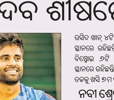
ବୋଲିଂରେ ରସିଦ୍ ନଂ୧

ଭୁବନେଶ୍ୱର, ୧୨।୬ (ଏକ୍ସପ୍ରେସ୍): ସନ୍ଧ୍ୟା ପ୍ରକାଶିତ ଅନ୍ତର୍ଜାତୀୟ କ୍ରିକେଟ୍ ପରିଷଦ (ଆଇସିସିଟି) ୧୨୦ ମାନ୍ୟତାରେ ଭାରତର ସୂର୍ଯ୍ୟକୁମାର ଯାଦବ ବ୍ୟାଟି ତାଲିକାରେ ତାଙ୍କର ଶୀର୍ଷ ସ୍ଥାନ ବଜାୟ ରଖିଛନ୍ତି। ବ୍ୟାଟି ତାଲିକାରେ ସୂର୍ଯ୍ୟ ନଂ ୧ ସ୍ଥାନରେ ପୂର୍ବପରି ରହିଥିବା ବେଳେ ପାକିସ୍ତାନ ଅଧିନାୟକ ବାବର ଆଜମ ଗୋଟିଏ ସ୍ଥାନ ଉପରକୁ ଉଠି ତୃତୀୟ ଓ ମହମ୍ମଦ ରିଜ୍ୱାନ ଗୋଟିଏ ସ୍ଥାନ ତଳକୁ ଖସି ଚତୁର୍ଥ ରହିଛନ୍ତି। ସେହିପରି ଜେମ୍ସ୍ ଫିଲ୍ ସଲ୍ସ୍ ବିଶ୍ୱାସୀ ସ୍ଥାନରେ ସ୍ଥିର ରହିଛନ୍ତି। ଜର୍ମାନୀର ଜୋଶ ବଟଲର ୨ଟି ସ୍ଥାନ ଉପରକୁ ଉଠି ୫ମ ସ୍ଥାନରେ ରହିଛନ୍ତି। ଭାରତର ଯଶସୀ ଜୟସାଲ ଷଷ୍ଠ ସ୍ଥାନରେ ସ୍ଥିର ରହିଛନ୍ତି। ଆପଗାନିସ୍ତାନର ରହମାମୁଲ୍ଲା ଗୁରବାଜ ୮ଟି ସ୍ଥାନ ଉପରକୁ ଉଠି ୯ମ ସ୍ଥାନରେ ରହିଛନ୍ତି।