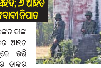
ତାକୁ ଠାବ କରି ନିପାତ କରାଯାଇଥିଲା । ଆତଙ୍କବାଦୀମାନେ ପାଳିସ୍ତାନ ପଟ୍ଟ ସାମା ଦେଇ ଭାରତ ମଧ୍ୟକୁ ପ୍ରବେଶ କରିଥିବା କୁହାଯାଇଛି । ଅନ୍ୟଏକ ଘଟଣାରେ ଗତ ରାତ୍ରରେ ତୋଡା ଜିଲ୍ଲାର ଛାଟେରଗାଲରେ ଥିବା ସୁରକ୍ଷା ବାହିନୀର ଏକ ଚେକ୍ ପୋଷ୍ଟ ଉପରେ ଆତଙ୍କବାଦୀମାନେ ଆକ୍ରମଣ କରିଥିଲେ । ସେଥିରେ ଉଭୟ ପକ୍ଷ ପ୍ରବଳ ଗୁଳି ବର୍ଷଣ ହେଇଥିଲା । ଘଣ୍ଟା ଘଣ୍ଟା ଧରି ଗୁଳି ବିନିମୟ ପରେ ଅଞ୍ଚଳରେ

ଆତଙ୍କବାଦୀ ଦୁଇ ଗୁଳି ଚଳାଇବା ଆରମ୍ଭ କରିଥିଲେ ଓ ସିଆରପିଏସ୍ ଯବାନଙ୍କୁ ଗୁଳି ଲାଗିଥିଲା । ସୁରକ୍ଷା ବାହିନୀର ପାଇଟା ଗୁଳିରେ ଜଣେ ଆତଙ୍କବାଦୀ ନିହତ ହୋଇଥିବା ବେଳେ ଅନ୍ୟ ଗଣକ ଜଣକ ଶବ୍ଦିତ ହୋଇଥିଲା । ପରେ ଏକ ସର୍ବ ଅପରେସନ୍ ଚାଲିଥିବା ସମୟରେ ଆତଙ୍କବାଦୀଙ୍କ ଗୁଳିରେ ଜଣେ ସିଆରପିଏସ୍ ଯବାନ ଗୁରୁତର ଆହତ ହୋଇଥିଲେ । ତାଙ୍କୁ ନିକଟସ୍ଥ ହସ୍ପିଟାଲରେ ଭର୍ତ୍ତି କରାଯାଇଥିଲା । ଚିକିତ୍ସାଧୀନ ଥିବା ଅବସ୍ଥାରେ ତାଙ୍କର ମୃତ୍ୟୁ ଘଟିଛି । ଗତ ରାତ୍ରରେ ଦୁଇ ଜଣ ଆତଙ୍କବାଦୀ କାଠୁଆ ଜିଲ୍ଲାର ସାମାନ୍ତରା ସରଦା ସୁଖାଲ ଗ୍ରାମକୁ ପ୍ରବେଶ କରି ଜଣେ ବାସିନ୍ଦାଙ୍କୁ ପାଣି ମାଗିଥିଲେ । ଗ୍ରାମରେ ଆତଙ୍କବାଦୀଙ୍କ ଉପସ୍ଥିତି ଲୋକଙ୍କୁ ଆତଙ୍କିତ କରିଥିଲା । ପୁଲିସକୁ ଖବର ମିଳିବାରୁ ସେହି ଗ୍ରାମକୁ ସୁରକ୍ଷାବାହିନୀର ଏକ ଟିମ୍ ଯାଇ ଘେରାବନ୍ଦୀ ଓ ତଲାସି ଅଭିଯାନ ଆରମ୍ଭ କରିଥିଲେ । ସେତିକିବେଳେ ସିକ୍ୟୁରିଟି କର୍ତ୍ତୃ ଉଦ୍ଧାରକୁ