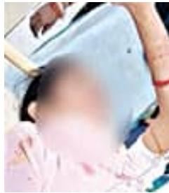
ପ୍ରେମରେ ଭଙ୍ଗା ପଡ଼ିବା ଯୋଗୁଁ ଉଭୟଙ୍କ ମଧ୍ୟରେ ମାନମାନାନ୍ତର ସୃଷ୍ଟି ହୋଇ ଉତ୍ତମିତ୍ର ପ ନେଇଥିଲା ।

ଅପରପକ୍ଷେ ପ୍ରେମିକା ସୁସ୍ଥ ହେବା ପରେ କାହିଁକି ଏଭଳି ଘଟିଲା, ସେ ନେଇ ସ୍ୱପ୍ନ ହେବ ବୋଲି ପୁଲିସ୍ କହିଛି । ଅପରପକ୍ଷେ ପୁଲିସ୍ ମୃତ ସାମାଜିକଙ୍କ ନାଁରେ ୩୦୬ ଦସ୍ତାରେ ଏକ ମାମଲା ରୁଜୁ କରି ଘଟଣାର ଅନୁସନ୍ଧାନ ଆରମ୍ଭ କରିଛି ବୋଲି କହିଛନ୍ତି ଦେବଗଡ଼ ଥାନା ଆଇଆଇସି ସରୋଜ ସେଠା । ଆଇଆଇସି ଶ୍ରୀ ସେଠାଙ୍କ ନେତୃତ୍ୱରେ ସେହି ଦିନଠାରୁ ଘଟଣାର ତଦନ୍ତ ଆରମ୍ଭ କରିଥିଲା ଦେବଗଡ଼ ଥାନା ପୁଲିସ୍ । ସେହିପରି ଛୁରାମାଡ଼ ସ୍ଥଳରେ ପୁଲିସ୍ ପହଞ୍ଚି ଆଖପାଖ ଲୋକଙ୍କଠାରୁ ଏହାକୁ ତଥ୍ୟ ସଂଗ୍ରହ କରିଥିବାବେଳେ ସୁଦୂର ଗଞ୍ଜାମ ଲୁଗାଧୁଆଳୀ ମୃତ ଯୁବକ କେବେ ଠାରୁ ଆସିଥିଲା, କେଉଁଠାରେ ରହୁଥିଲା, ପୋନ ବାର୍ତ୍ତାକାପରେ ପ୍ରେମିକା ଡାକିଥିଲେ ନା ସେ ନିଜେ ଆସିଥିଲେ, କେତେ ଦିନ ଧରି ପ୍ରେମ ସମ୍ପର୍କ ରହିଥିଲା, କ'ଣ ପାଇଁ ରକ୍ତପୁଣ୍ୟ ହେଲେ ସାମାଜିକ, ଏ ସବୁ ଦିଗ ଉପରେ ପୁଲିସ୍ ତଦନ୍ତ ଚଳାଇଛି ।