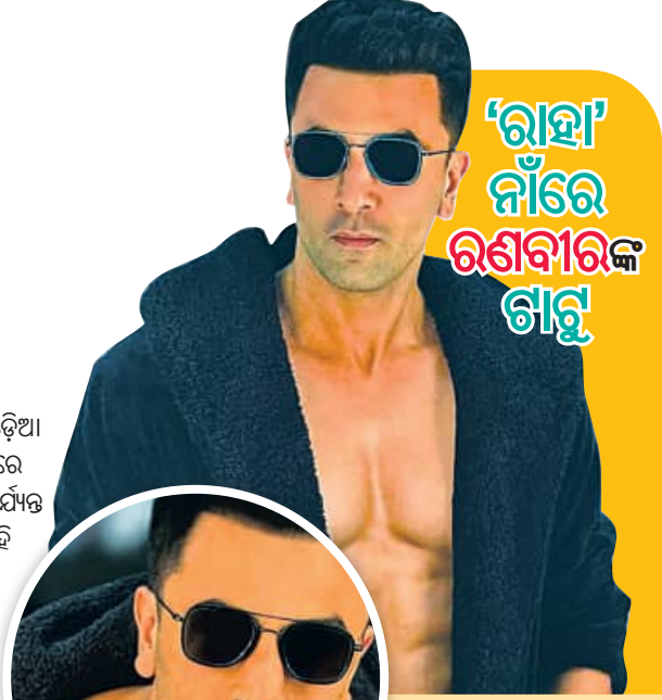
'ରାହା' ନାଁରେ ରଣବୀରଙ୍କ ଟାଟୁ

ବିଶେଷ କଥା ହେଉଛି, ଯେଉଁ ସିନେ ଗୀତରେ ଶୁଦ୍ଧ ଓଡ଼ିଶା ଶାସ୍ତ୍ରୀୟ ପ୍ରୟୋଗ ରହିଛି, ସେହି ଗୀତସବୁ ଆହୁରି ବିଶୁଦ୍ଧ ହେବା ଓ ସାତାବିକ କଥା, କିନ୍ତୁ ଯେଉଁ ଗୀତରେ ନୂଆ ଜନ୍ମର ଶାଣ ଛିଟା ରଳି ଶାସ୍ତ୍ରୀୟ ସଂଗୀତ ଚହଟି ଯାଇଛି, ସେହି ଗୀତ ଆହୁରି ସଂସ୍କରଣ ହୋଇଛି। ବୋଧହୁଏ, ଏହା ଓଡ଼ିଶା ଶାସ୍ତ୍ରୀୟତାକୁ ଆହୁରି ମିଠା, ଆହୁରି ମାଦକରଣ। ଏହା ଓଡ଼ିଆ ସିନେମା ଗୀତର ପରାକ୍ଷା ନିରୀକ୍ଷାର ଲକ୍ଷକାଳ।