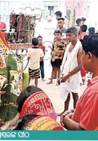
ସୋଡି ଇଶାନେଶ୍ଵର ମନ୍ଦିର