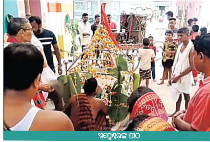
ସୋଡି ଇଶାନେଶ୍ଵର ମନ୍ଦିର

ଦଶରଥପୁର: ଦଶରଥପୁର ବ୍ଲକ ଖଣ୍ଡୁରା ପଞ୍ଚାୟତ ସ୍ଵପ୍ନେଶ୍ଵରୀ ଗ୍ରାମରେ ବିରାଜମାନ ପ୍ରସିଦ୍ଧ ଶୈବପୀଠ ସ୍ଵପ୍ନେଶ୍ଵରଙ୍କ ମନ୍ଦିରରେ ଶିବ ବିବାହ ଓ ପବିତ୍ର ଶୀତଳଷଷ୍ଠୀ ମହୋତ୍ସବ ପାରମ୍ପରିକ ରୀତିରେ ସମ୍ପନ୍ନ ହୋଇଛି।