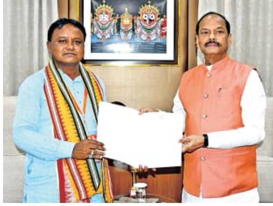
ଆସନ୍ତାକାଲି ଅପରାହ୍ଣ ପ୍ରତ୍ୟୁଷ ସେ ରାଜ୍ୟପାଳଙ୍କୁ ନିକଟରେ ସମ୍ମାନ କରିଛନ୍ତି । ସମର୍ଥନ ପତ୍ର ଶ୍ରୀ ମାଝୀ ତାଙ୍କ ପୃଷ୍ଠା-୯

■ ଭୁବନେଶ୍ୱର, ୧୧।୬ (ସମ୍ପାଦକ): ବିଜେପି ବିଧାୟକ ଦଳ ନେତା ଭାବେ ନିର୍ବାଚିତ ହୋଇଥିବା ମୋହନ ଚରଣ ମାଝୀ ମଙ୍ଗଳବାର ସଂଧ୍ୟାରେ ରାଜ୍ୟପାଳ ଉତ୍ତର ଦାସଙ୍କୁ ଭେଟି ସରକାର ଗଠନ ପାଇଁ ଦାବି କରିଛନ୍ତି । ଏହି ଅବସରରେ ସେ ତାଙ୍କ ପ୍ରତି ବିଜେପିର ସମସ୍ତ ୬୮ ଜଣ ଓ ୩ ଜଣ ସ୍ୱାଧୀନ ବିଧାୟକଙ୍କ ସମର୍ଥନ ରହିଥିବା ଅବଗତ କରିଛନ୍ତି । ୩ ସ୍ୱାଧୀନ ବିଧାୟକ ବିଜେପିକୁ ସମର୍ଥନ କରୁଥିବା ଗୋଟିଏ ପ୍ରାୟ ହେବା ପରେ ରାଜ୍ୟପାଳ ଆସନ୍ତାକାଲି ଅପରାହ୍ଣ ପ୍ରତ୍ୟୁଷ ସେ ରାଜ୍ୟପାଳଙ୍କୁ ନିକଟରେ ସମ୍ମାନ କରିଛନ୍ତି । ସମର୍ଥନ ପତ୍ର