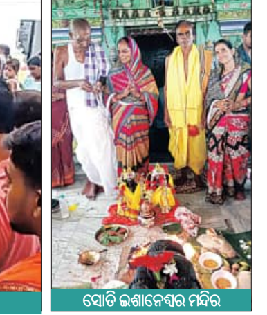
ସୋଡି ଇଶାନେଶ୍ଵର ମନ୍ଦିର