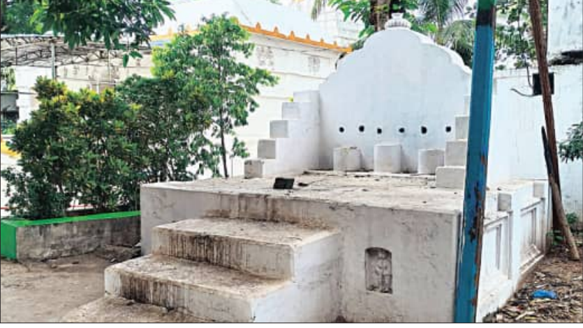
ସୁକିନ୍ଦା, ୧୧.୬ (ସମିପ)

ପବିତ୍ର ସ୍ନାନ ପୂର୍ଣ୍ଣିମାକୁ ଆଠଦିନ ବାକି... ସୁକିନ୍ଦା ଜଗନ୍ନାଥ ମନ୍ଦିରରେ ଚତୁର୍ଥା ମୂର୍ତ୍ତିକ ବିଗ୍ରହ ପରିବର୍ତ୍ତନ କାର୍ଯ୍ୟ ଯଥାବିଧି ମହାଆଡ଼ମ୍ବରରେ ଅନୁଷ୍ଠିତ ହୋଇଯାଇଛି।