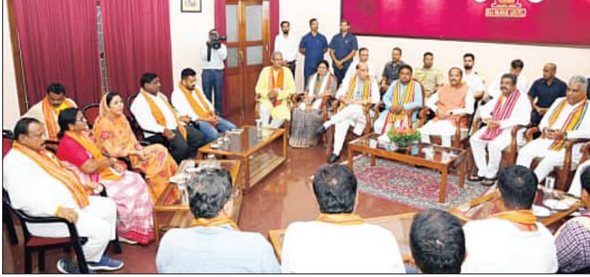
ମୁଖ୍ୟମନ୍ତ୍ରୀ ଓ ଉପମୁଖ୍ୟମନ୍ତ୍ରୀଙ୍କ ନାମ ଘୋଷଣା ପରେ ରାଜ ଭବନରେ ରାଜ୍ୟ ବିଜେପି ନେତାଙ୍କ ସହ ଓଡ଼ିଶାର ୩ କେନ୍ଦ୍ରମନ୍ତ୍ରୀ ଓ ୨ ପର୍ଯ୍ୟଟନମନ୍ତ୍ରୀ

◆ ବର୍ଷ-୪୧ ◆ ସଂଖ୍ୟା-୩୪୬ ◆ ଭୁବନେଶ୍ୱର ◆ ରୁଧିବାର ◆ ୧୨ ଜୁନ ୨୦୨୪ ◆ ପୃଷ୍ଠା-୧୬ ◆ ଟ. ୬.୦୦