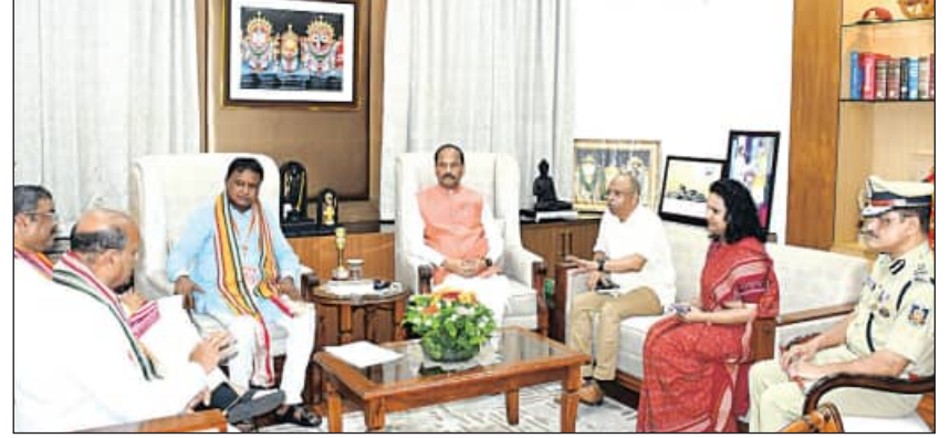
ରାଜଭବନରେ ମୁଖ୍ୟ ସଚିବ ପ୍ରତାପ କୁମାର ଜେନା, ଉନ୍ନୟନ କମିସନର ଅନୁ ଗର୍ଗ, ପୁଲିସ ମହାନିର୍ଦ୍ଦେଶକ ଅରୁଣ ଷଡ଼ଙ୍ଗୀ