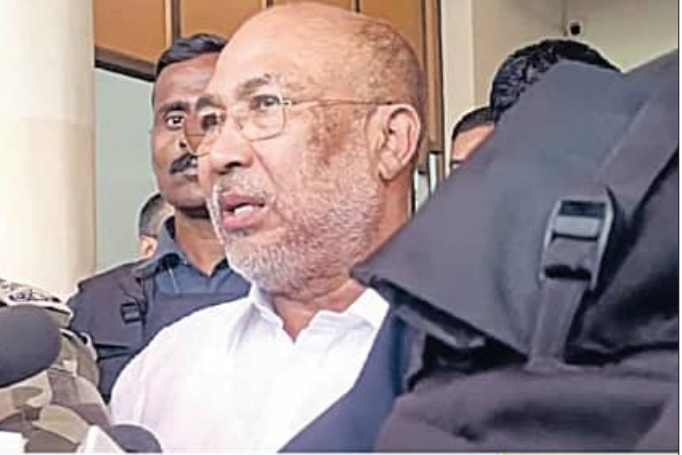
ATTACK ON ADVANCE SECURITY CONVOY, AN ATTACK ON ME PERSONALLY: CM

ପରିବର୍ତ୍ତନ କରିବାର କାର୍ଯ୍ୟକ୍ରମ ଥିଲା। ଏହା ପୂର୍ବରୁ ସୁରକ୍ଷା ଟିମ୍ ଷ୍ଟେଡ଼ ପରିବର୍ତ୍ତନ ପାଇଁ ଆଗ୍ରହ ପଠାଯାଇଥିଲା। ସୁରକ୍ଷାକର୍ମୀମାନେ ଯାଉଥିବା ସମୟରେ କାଙ୍ଗାପୋକି ଜିଲ୍ଲାର କୋଟଲେନ ଗାଁ ନିକଟରେ ସଭିନ୍ଦ୍ର ଆତଙ୍କବାଦୀମାନେ କନକଭର ଉପରେ ଗୁଳିମାଡ଼ କରିଥିଲେ। ସୁରକ୍ଷାକର୍ମୀମାନେ ମଧ୍ୟ ଏହାର ପାଇଟା ଯବାବ ଦେଇଥିଲେ। ତେବେ ଏଥିରେ ଦୁଇ ଜଣଙ୍କ ସୁରକ୍ଷାକର୍ମୀ ଆହତ ହୋଇଥିଲେ। ଦୁଇ ଜଣଙ୍କୁ ଟିକିସ୍ତା ପାଇଁ ହସ୍ପିଟାଲରେ ଭର୍ତ୍ତି କରାଯାଇଥିବାବେଳେ ଜଣେ ଅସୁସ୍ଥ। ଗୁରୁତର ହେବାରୁ ତାଙ୍କୁ ଇମ୍ଫାଲ ହସ୍ପିଟାଲକୁ ସ୍ଥାନାନ୍ତର କରାଯାଇଛି।