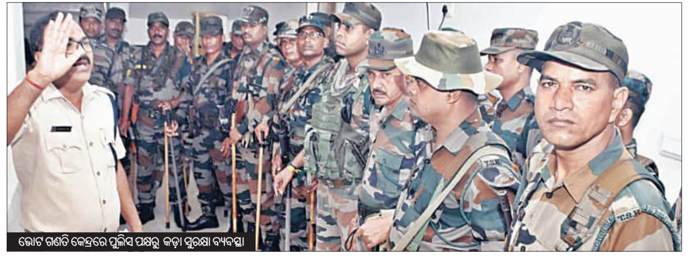
ଭୋଟ ଗଣତି କେନ୍ଦ୍ରରେ ପୁଲିସ ପକ୍ଷରୁ କଡ଼ା ସୁରକ୍ଷା ବ୍ୟବସ୍ଥା