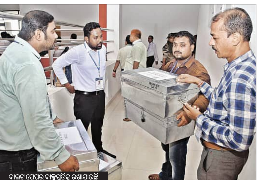
ବାଲଟ ପେପର ବାକ୍ସଗୁଡ଼ିକୁ ରଖାଯାଉଛି