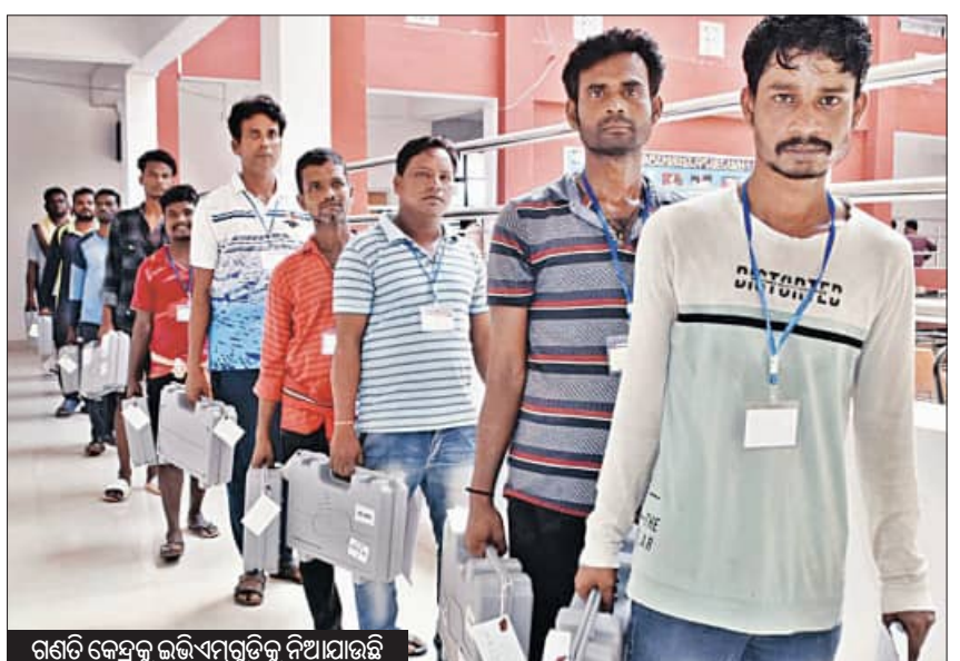
ଗଣତି କେନ୍ଦ୍ର ଉଭିଏମ୍ପୁଡ଼ିକୁ ନିଆଯାଉଛି