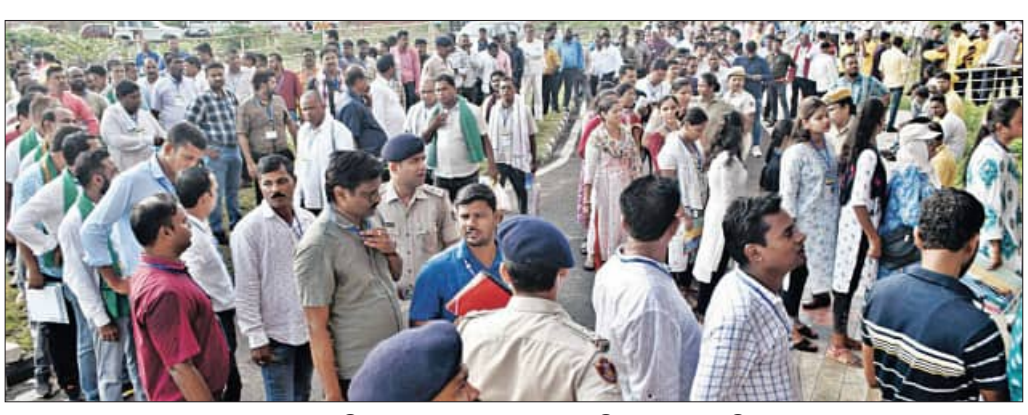
ଭୋଟ ଗଣତି କେନ୍ଦ୍ର ବାହାରେ ଜନାଦେଶ ଜାଣିବାକୁ ଲୋକଙ୍କ ଭିଡ଼ ।