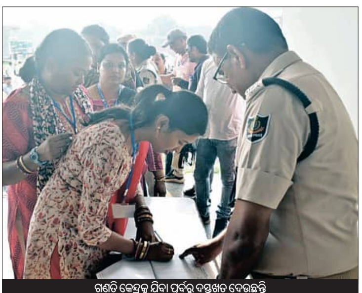
ଗଣତି କେନ୍ଦ୍ରକୁ ଯିବା ପୂର୍ବରୁ ଦସ୍ତଖତ ଦେଉଛନ୍ତି