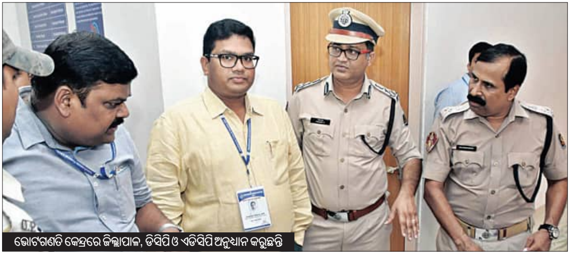
ଭୋଟଗଣତି କେନ୍ଦ୍ରରେ ଜିଲ୍ଲାପାଳ, ଡିପିଓ ଏଡିସିପି ଅନୁଧ୍ୟାନ କରୁଛନ୍ତି