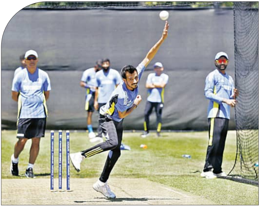
ଦୁୟର୍ଲ, ୪।୬

ଚଳିତ ଟି-୨୦ ବିଶ୍ୱକପରେ ରୋହିତ ଶର୍ମାଙ୍କ ନେତୃତ୍ୱାଧୀନ ଭାରତୀୟ ଦଳ ବୁଧବାର ଅଭିଯାନ ଆରମ୍ଭ କରିବ । ସ୍ଥାନୀୟ ନାସାଲ କାଉଣ୍ଟି ଅନ୍ତର୍ଗତ ଷ୍ଟାଡ଼ିୟମରେ ଭାରତ ତା'ର ପ୍ରଥମ ମ୍ୟାଚ୍ରେ ପଲ ସ୍କିଲିଙ୍କ ଆୟର୍ଲାଣ୍ଡକୁ ଭେଟିବ । ଟି-୨୦ରେ ଆୟର୍ଲାଣ୍ଡ ଏକ ବିପଜ୍ଜନକ ଦଳ ଭାରତୀୟ ଟିମ୍ ମ୍ୟାଚ୍ରେ ଯେଉଁ ଯୁଦ୍ଧମାନ କରିଥିବ । ତେଣୁ ଭାରତ ପାଇଁ ନିଶ୍ଚିତ ଭାବେ ଏହି ମ୍ୟାଚ୍ରେ ଚ୍ୟାଲେଞ୍ଜ ରହିଛି । ଶେଷଥର ପାଇଁ ଦୁଇ ଦଳ ୨୦୨୩ ପରସ୍ପରକୁ ଭେଟିଥିଲେ । ସବୁ ବିଭାଗରେ ଭାରତ ଅପେକ୍ଷାକୃତ ଶକ୍ତିଶାଳୀ ମନେ ହେଉଛି । ଏହି ବିଶ୍ୱକପ ପରେ ମୁଖ୍ୟ କୋଚ୍ ରାହୁଲ ଦ୍ରାବିଦ୍ଙ୍କ କାର୍ଯ୍ୟକାଳ ଶେଷ ହେବ । ତେଣୁ ତାଙ୍କ ଚତୁର୍ଥାଧିକାରୀ ଭାବେ ଏହି ମ୍ୟାଚ୍ରେ ସହ ଯୋଗ ଦେଖିବାକୁ ସମ୍ଭାବ୍ୟ ।