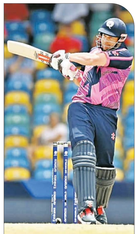
ବାର୍ବାଡ୍, ୪।୨ (ଏକେନ୍ଦ୍ର):

ଓଭରରେ ୧୦୯ ରନ କରି ଅଲଆଉଟ୍ ହୋଇଯାଇଥିଲା । ୪୮ ବଲର ଏହି ପାଲିରେ ମାତ୍ର ୪ଟି ଚୌକା ଓ ଗୋଟିଏ ଛକା ମାରିଥିଲା ।