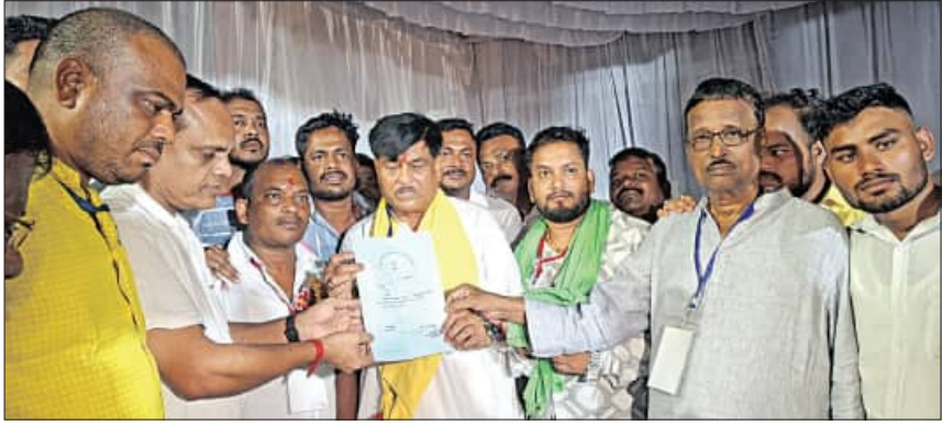
ଡିଜିଆ, ୪।୬ (ସମିପ)