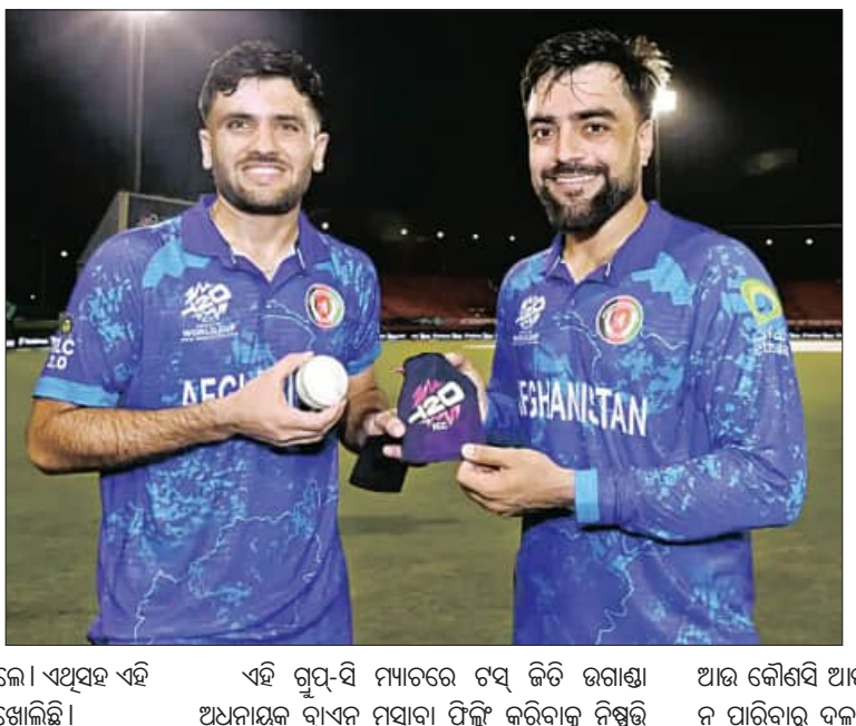
ଭୁବନେଶ୍ୱର, ୪।୨ (ଏକେନ୍ଦ୍ର):

ଚଳିତ ଆଇସିସି ଟି-୨୦ ବିଶ୍ୱକପରେ ଆଫଗାନିସ୍ତାନ ଦଳଦ୍ୱାରା ଭଗାଣ୍ଡାକୁ ୧୨୫ ରନ୍ରେ ହରାଇଥିଲା ।