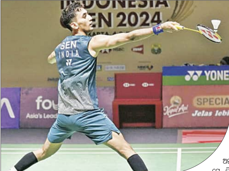
କାକର୍ଡା, ୪।୬ (ଏକେନ୍ଦ୍ରି)

ସ୍ୱାମୀୟ ଇଣ୍ଡୋନେସିଆ ଚେନିସ୍ ବୁକ୍ସ କାକର୍ଡା ଇଣ୍ଡୋନେସିଆ ଓପନ୍ ଯୁଗଳ ୧୦୦୦ ବ୍ୟାଡମିଣ୍ଟନ ଚୁର୍ଣ୍ଣାମେଣ୍ଟ।