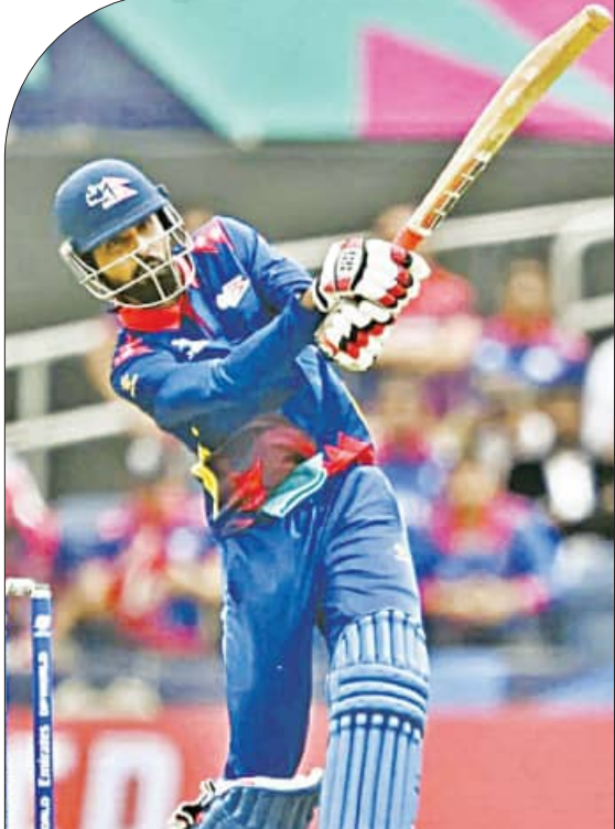
ଭୁବନେଶ୍ୱର, ୪।୨ (ଏକେନ୍ଦ୍ର):