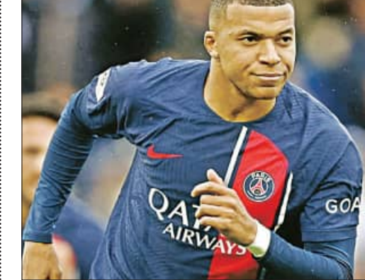
ମାଡ୍ରିଡ୍, ୪।୬ (ଏକେନ୍ଦ୍ରି): ଫ୍ରାନ୍ସ ଯୁଗଳ ସୁପରସ୍ତାର ଲିଲିଆନ ଏମ୍ବାପେ

୧୫ ବର୍ଷ ରିଅଲ ମାଡ୍ରିଡ୍ ସହିତ ଜଡିତ ରହିବେ ଆଗାମୀ ୫ ବର୍ଷ ପାଇଁ ମାଡ୍ରିଡ୍ ତରଫରୁ ଖେଳିବେ। ପିଏସ୍ଡିଲି ସେ ଫ୍ରାନ୍ସର ମାଧ୍ୟମରେ ମାଡ୍ରିଡ୍ରେ ଯୋଗ ଦେଇଥିଲେ।