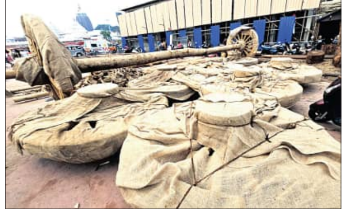
ନିର୍ମାଣାଧୀନ ରଥ ଚକଗୁଡ଼ିକୁ ପ୍ରତ୍ୟେକ ଖରାବୁ ରକ୍ଷା ନିମନ୍ତେ ଅଖାରେ ଘୋଡ଼ାଯାଇଛି