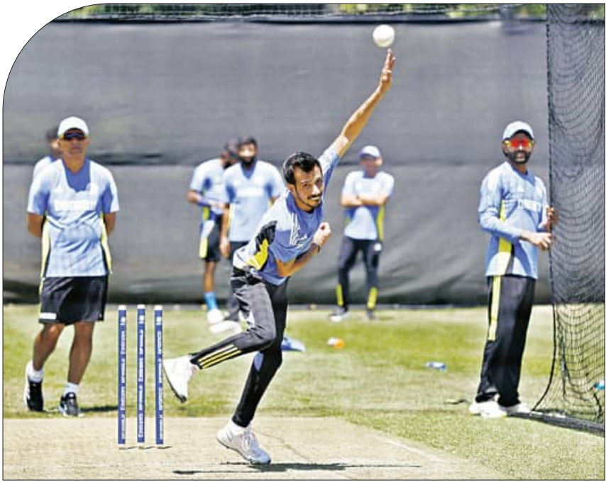
ଦୁୟର୍ଭ, ୪।୨ (ଏକେନ୍ଦ୍ର):