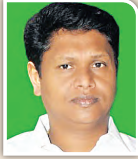
କଟା ଘା'ରେ ନୂଆତୁନ

ତା ଚିର ପାରଦ ସହ ରାଜ୍ୟରେ ଏବେ ରାଜନୀତି ପାରଦ ଉର୍ଦ୍ଧ୍ୱମୁଖୀ । ନିର୍ବାଚନ ପ୍ରଚାର ପାଇଁ ବିଭିନ୍ନ ଦଳର ନେତା, ପ୍ରାଥୀ ରାଜରାଷ୍ଟ୍ରରେ । ସକାଳୁ ବିଳମ୍ବିତ ରାତି ପର୍ଯ୍ୟନ୍ତ ପ୍ରଚାର ସରୁନାହିଁ । ମାତ୍ର ପ୍ରଚାରର ଘମାଘୋଟ ମଧ୍ୟରେ ପଦ୍ମ ଦଳର ଜାତୀୟ ଉପାଧ୍ୟକ୍ଷ ତଥା କେନ୍ଦ୍ରୀୟ ଆସନର ପ୍ରାଥୀ ବୈଜୟନ୍ତ ଆଖି ଅସ୍ତ୍ରୋପଚାର କରି ଶାତଳଗୃହରେ ବିଶ୍ରାମ ନେଉଛନ୍ତି । ତାଙ୍କ ଆଖିରେ କି ପ୍ରକାର ଅସ୍ତ୍ରୋପଚାର ହୋଇଛି ତାହାର ସୂଚନା ଯଦିଓ ସାର୍ବଜନୀନ କରାଯାଇ ନାହିଁ; ତଥାପି କିଛିଦିନ ସେ ନିର୍ବାଚନ ପ୍ରଚାରରୁ ବିରତ ରହିବେ ବୋଲି ତାଙ୍କ ନିକଟତମ ମହଲରେ ଆଲୋଚନା ହେଉଛି । ତେବେ ନିର୍ବାଚନ ମହାସମର ସମୟରେ ତାଙ୍କର ଆଖି ଅସ୍ତ୍ରୋପଚାରକୁ ନେଇ ତାଙ୍କର ପଦ୍ମ ଦଳର ରାଜ୍ୟ ନେତାଙ୍କଠାରୁ ଆରମ୍ଭ କରି ଚଳଚଳିଆ କର୍ମୀମାନେ ପ୍ରଶ୍ନ ଉଠାଇଛନ୍ତି । ଏପରିକି ଜାତୀୟ ନେତାମାନେ ମଧ୍ୟ ଅସୁଖୀ ବୋଲି କୁହାଯାଉଛି । ବୈଜୟନ୍ତଙ୍କ ଆଖିରେ କ'ଣ ଏମିତି ଅସୁବିଧା ହେଲା ଯେ ଆକସ୍ମିକ ଅସ୍ତ୍ରୋପଚାରର ଆବଶ୍ୟକତା ପଡ଼ିଲା । ଆଉ ଦୁଇ/ତିନି ସପ୍ତାହ ଅସ୍ତ୍ରୋପଚାର ଏଡ଼ାଇ ଯାଇଥିଲେ କ'ଣ ଅସୁବିଧା ହୋଇ ଯାଇଥାନ୍ତା? ହେଲେ ମାହାଙ୍ଗା ଆଉ ତେରାବିଶିରେ ତାଙ୍କ ନିୟୁକ୍ତମାନଙ୍କ କହିବା କଥାଟା ହେଲା ବାବୁ ବୈଜୟନ୍ତ ହେଉଛନ୍ତି ଶାତଳ ଗୃହ ଆବାସୀ ହେଲିକପଟର ନେତା । ଖରାତରାରେ ବୁଲିବା, ପ୍ରତ୍ୟକ୍ଷ ନିର୍ବାଚନ ଲଢ଼ିବା ତାଙ୍କ ପାଇଁ ବଡ଼ ଅସ୍ୱସ୍ତିକର ବ୍ୟାପାର । ନିର୍ବାଚନର ପରିଣାମ କ'ଣ ହେବ କାହାକୁ ଅଜଣା ନାହିଁ । ନଳିନୀ ସୁତଙ୍କ ଦିଲ୍ଲୀ ଚିକିତ୍ସା ପ୍ରାୟ ପକ୍ୱା । ତେଣୁ ୪୪ ଡ଼ିଗ୍ରୀ ପ୍ରଚଣ୍ଡ ଖରାରେ ଝାଳନାଳ ହୋଇ ଲୋକଙ୍କ ସହ ବୁଲି ଟଙ୍କା ଖର୍ଚ୍ଚ କରିବା ସମ୍ପୂର୍ଣ୍ଣ ନିରର୍ଥକ । ସେଇଥିପାଇଁ କୁଆଡ଼େ ଆଖି ଅସ୍ତ୍ରୋପଚାର । କି ବୁଦ୍ଧି ସତରେ... । ■