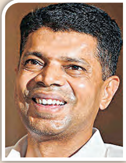
ବିରୋଧୀ ଶିବିରରେ ଆତଙ୍କ