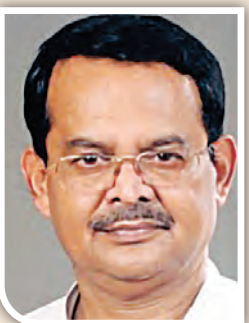
ଗୁମର ଖୋଲିଲେ ଖାରବେଳ