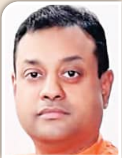
ସାମାହାନ ଅହଙ୍କାର ପ୍ରଦର୍ଶନ

ସମାଲୋଚନାର ଶସ୍ତ୍ରାଘାତ କାର୍ତ୍ତିକଙ୍କୁ ଏଇ କେଲ ମାସରେ ଦାୟବଙ୍କ ପୋଖର ରାଜନେତାରେ ପରିଣତ କରିବାକୁ ସକ୍ଷମ ହୋଇଛି । ବିରୋଧୀଙ୍କ ଅପଶବ୍ଦ, କୁସୂଚ ସମ୍ବୋଧନକୁ ଅତ୍ୟନ୍ତ ସଂଯମ ତଥା ରାଜନୀତି ଭାଷାରେ ଉତ୍ତର ଦେବାକୁ ସେ ସକ୍ଷମ ହୋଇ ପାରିଛନ୍ତି । କେଲଦିନ ତଳେ ନିଜ ଶତ୍ରୁର ଘର ଅଞ୍ଚଳ କେନ୍ଦ୍ରାପଡ଼ା ଜିଲ୍ଲାରେ ଅନୁଷ୍ଠିତ ସମାବେଶରେ ପୂର୍ବତନ ସାଂସଦ ତଥା ବିରୋଧୀ ଦଳର ସାଂସଦ ପ୍ରାର୍ଥୀଙ୍କ ନାମ ଉଲ୍ଲେଖ ନ କରି ସେ ଯେପରି କଳା-ଧଳା କୁସାର ପ୍ରସଙ୍ଗର ଅବତାରଣା କରିଛନ୍ତି, ତାହା ତାଙ୍କର ରାଜନୈତିକ ପରିପକ୍ୱତାକୁ ପ୍ରଦର୍ଶିତ କରିଛି । ଖାଲି ସେତିକି ନୁହେଁ, ପାଞ୍ଚବର୍ଷ ଧରି ଅଜ୍ଞାତବାସରେ ଥିବା ନେତାମାନଙ୍କର ନିର୍ବାଚନ ଚକ୍ରରେ ଆବିର୍ଭାବ ହେବାକୁ ସେ ଯେପରି କଟାକ୍ଷ କରିଛନ୍ତି, ସେଥିରେ ତାଙ୍କର ପ୍ରଶଂସକ ବିମୁଗ୍ଧ, ବିରୋଧୀ ବିଚଳିତ । ■