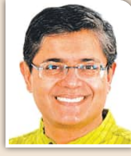
ମାଗି ଖାଉଥାଏ ବାସୀ ଅଇଁଠା

ଅହଙ୍କାରର ଗୋଟାଏ ସୀମା ଥାଏ; ମାତ୍ର ପଦ୍ମ ଦଳର କିଛି ନେତା ଅହଙ୍କାରର ସବୁ ସୀମାକୁ ଅତ୍ୟନ୍ତ ନିର୍ଲକ୍ଷ୍ୟତାର ସହ ଅତିକ୍ରମ କରି ଯାଇଥିବା ମନେହେଉଛି । ନିଜ ନେତାଙ୍କୁ 'ଦେଶ୍ କା ବାପ' ବୋଲି ସମ୍ବୋଧନ କରୁଥିବା ପଦ୍ମ ଦଳର ରାଷ୍ଟ୍ରୀୟ କୁହାଲିଆ ସମ୍ପ୍ରଦାୟ 'ମୋଦୀଙ୍କ ଭକ୍ତ ଜଗନ୍ନାଥ' ବୋଲି ବଡ଼ଦାଣ୍ଡରେ ନିଷ୍ପତ୍ତ ସ୍ୱରରେ ବର୍ଣ୍ଣନାର ଔଚିତ୍ୟ ସାରା ଦେଶବାସୀଙ୍କୁ ଆତମ୍ବିତ କରିଛି ସିନା ପଦ୍ମ ଦଳର ନେତାଙ୍କୁ ବିଚଳିତ ବା ବିକୃତ କରିଥିବା ମନେ ହେଉନାହିଁ । ଏହା ପୂର୍ବରୁ ସମ୍ପ୍ରଦାୟ ପରି ତାଙ୍କ ଦଳର କିଛି ତୋଷାମଦକାରୀ ନେତାମାନେ ରାମଙ୍କୁ ତାଙ୍କ ଦଳର ଶୀର୍ଷ ନେତା ଆଣିଥିବା ପ୍ରଚାର କରୁଥିବା ଶୁଣା ଯାଇଛି । ତେଣୁ ଜଗନ୍ନାଥଙ୍କୁ ନିଜ ନେତାଙ୍କ ଭକ୍ତରେ ପରିଣତ କରିବା ସମ୍ପ୍ରଦାୟ ପାଇଁ କେଉଁ ବଡ଼ କଥା କି ? କିନ୍ତୁ ବିତମ୍ବନା ହେଉଛି ଏହି ଘଟଣାକୁ ନେଇ ସାରା ଦେଶରେ ଲୋକଙ୍କ ମଧ୍ୟରେ ପ୍ରତିକ୍ରିୟା, ଅନ୍ୟ ଦଳର ଜାତୀୟ ନେତାମାନଙ୍କ ତୀବ୍ର ସମାଲୋଚନା ସମ୍ପୂର୍ଣ୍ଣ ବା ତାଙ୍କ ଦଳର ନେତାମାନଙ୍କ ଉପରେ କାଣିତାଏ ପ୍ରଭାବ ପକାଇନାହିଁ । ଦଳର ବଡ଼ ନେତାମାନେ ଭର୍ତ୍ସନା କରିବା ବଦଳରେ ସମ୍ପ୍ରଦାୟ ଖାଲି ସୁରକ୍ଷା ଦେଇ ନାହାନ୍ତି; ବିପ୍ଳବ ଅର୍ଥ ବ୍ୟୟରେ 'କ୍ଷମା ଯାଚନା' ଓ 'ଉପବାସ' ବିଜ୍ଞାପନ ନେଇ ତାଙ୍କର ଏହି ଭୟଙ୍କର ଭୁଲର ଦୁର୍ଗନ୍ଧକୁ ବାଲିରେ ଢାଳିବାକୁ ଉଦ୍ୟମ କରିଛନ୍ତି । ଏହି ଅକ୍ଷମଶାୟ ଭୁଲକୁ ସୁଯୋଗରେ ପରିଣତ କରି ନିର୍ବାଚନ ବୈତରଣୀ ପାର ହେବା ପରି ଅତ୍ୟନ୍ତ ନୀଚ ସ୍ତରର ରାଜନୀତି କରିବା ଆରମ୍ଭ କରିଛନ୍ତି । ଅତୀତରେ ପୁରୀର ଜନସାଧାରଣ ସମ୍ପ୍ରଦାୟ ଧ୍ୟାନ ବୁଝା, ପଖାଳ ଖୁଆ, ପୋଖରୀ ବୁଡ଼ା, ମୁଣ୍ଡରେ ଠାକୁରଙ୍କୁ ବୁଝା ନାଟକ ଦେଖୁଥିଲେ । ମାତ୍ର 'ଜଗନ୍ନାଥ ମୋଦୀଙ୍କ ଭକ୍ତ' ପରି ଭୟଙ୍କର ଧୂସୃତାକୁ ଓଡ଼ିଶାବାସୀ ସହ୍ୟ କରିବେ ତ ? ■