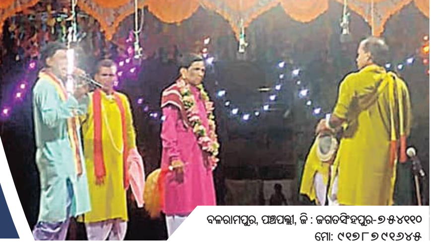
ବଳରାମପୁର, ପଞ୍ଚପଲ୍ଲୀ, ଜି: ଜଗତସିଂହପୁର-୧୫୪୧୧୦ ମୋ: ୯୧୭୮୭ ୯୧୭୪୫