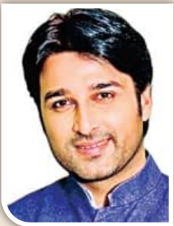
ବନ ପୋଡ଼ି ଗଲେ ଜାଣିବ କିଏ

କେନ୍ଦ୍ରାପଡ଼ାର ହେଲିକପ୍ଟର ଜୟ ପଣ୍ଡା ଏକଦା ଥିଲେ ଶଙ୍ଖପତି ନବୀନଙ୍କ ଘନିଷ୍ଠ । ଜୟ ଏ ସମ୍ପର୍କରେ ବିଭିନ୍ନ ସମୟରେ ଅବତାରଣା କରିଥିବା ଅନେକ ଶୁଣିଛନ୍ତି । ଶଙ୍ଖପତିଙ୍କ ଆଶୀର୍ବାଦରେ ଜୟ ଦୁଇଥର ରାଜ୍ୟସଭାକୁ ଯାଇଥିଲେ, ଦୁଇଥର ଲୋକସଭାକୁ ନିର୍ବାଚିତ ହୋଇଥିଲେ ଓ ଦିଲ୍ଲୀରେ ଶଙ୍ଖ ଦଳର ଛାତ୍ରୁଆଁ ନେତା ମାନ୍ୟତା ପାଇଥିଲେ ବୋଲି ପ୍ରାୟ ସମସ୍ତେ ଜାଣନ୍ତି । ମାତ୍ର ପଦ୍ମାଧିପତିଙ୍କ ହାତ ଆପୁଡ଼ା ନିଜ ପିଠିରେ ଖାଇ ଜୟ ଯେବେଠାରୁ ଓଡ଼ିଶାର 'ବିଶ୍ୱଖର୍ମା' ହେବା ଲକ୍ଷ୍ୟରେ ଶଙ୍ଖପତିଙ୍କ ସ୍ୱାସ୍ଥ୍ୟକୁ ନେଇ ଗୁଜବ ଅଭିଯାନ ଆରମ୍ଭ କଲେ, ସେବେଠାରୁ ଶଙ୍ଖ ଦଳ ଆଉ ଜୟଙ୍କ ମଧ୍ୟରେ ବଡ଼ି ଚାଲିଲା ଦୂରତ୍ୱ । ନିଲମ୍ବନ ପରେ ପଦ୍ମ ଧାରଣ ନିମନ୍ତେ ସେ ଶଙ୍ଖ ଦଳ ତ୍ୟାଗ କଲେ ସିନା, ପଦ୍ମ ଧରି ଆଉ ସେ ସଂସଦ ପ୍ରବେଶ କରିପାରିଲେ ନାହିଁ । ୨୦୧୯ରେ ଲକ୍ଷ୍ୟଧିକ ଭୋଟ ବ୍ୟବଧାନରେ ପରାଜୟ ବରଣ କଲେ । ତଳିତ ନିର୍ବାଚନରେ ବି କୁଆଡ଼େ ସିଏ ସମଦଶା ଭୋଗିବାକୁ ଯାଉଛନ୍ତି ବୋଲି ବଳଦେବଜୀଉ ମାଟିବାସୀ ଖୋଲାଖୋଲି କହୁଛନ୍ତି । ସେଥିପାଇଁ ଜୟ ଓ ତାଙ୍କର ପଦ୍ମ ଦଳିଆ ଶୁଭାକାଂକ୍ଷୀମାନେ ଭାରି ବିଚଳିତ । ବିଜୟର ସମ୍ଭାବନା କମୁଥିବା ଦେଖି ଅନ୍ତତଃ ସମ୍ମାନଜନକ ପରାଜୟ ପାଇଁ ଏବେ ସବୁ ସାଧନକୁ ଜୟ ଏଣୁ କୋଃ କାମରେ ଲଗାଇ ଦେଇଛନ୍ତି । ମୋଦୀଙ୍କଠାରୁ ଯୋଗାଳ ପର୍ଯ୍ୟନ୍ତ ସମସ୍ତଙ୍କୁ ତାଙ୍କ ନିର୍ବାଚନ କ୍ଷେତ୍ରରେ ପ୍ରଚାର ପାଇଁ ଅନୁରୋଧ କରୁଛନ୍ତି । ବିତମ୍ବନା ହେଉଛି ପଦ୍ମ ଦଳର ଜାତୀୟ ଉପସଭାପତିଙ୍କ ପାଇଁ ଅନ୍ୟ ରାଜ୍ୟରେ ଦଳର ସାଂସଦ ପ୍ରାର୍ଥୀଙ୍କ ପ୍ରଚାର । ଯେଉଁ ଗୋଭଲ୍ ମିରଟ୍ରେ ନିଜ ପ୍ରଚାର ପାଇଁ ରାମାୟଣର ଅଭିନେତାମାନଙ୍କୁ ବ୍ୟବହାର କରୁଥିଲେ, ସେହି ଗୋଭଲ୍ ଆସି ଜୟଙ୍କ ପାଇଁ କେନ୍ଦ୍ରାପଡ଼ାରେ ପ୍ରଚାର କରୁଛନ୍ତି । କି ବିତମ୍ବନା । ସେଇଥିପାଇଁ ପରା କୁହାଯାଇଛି- ଯାଚିଲେ ନ ରୁଡ଼େ ମଣ୍ଡା ଗଇଁଠା । ମାଗି ଖାଉଥାଏ ବାସୀ ଅଇଁଠା । ■