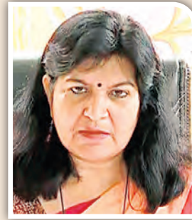
କର୍ମ ଅଧିକ ଯେ ଲୋଡ଼ନ୍ତି...

କିଆ କହିବା ବେଳେ ବାଟୁଳି ବାକୁ ନ ଥିବା ଗୋପାଳପୁରର କୁହାଳିଆ ପାଣିଗ୍ରାହୀଙ୍କ ପାଟି ଏବେ ଖନି ମାରିବା ଆରମ୍ଭ ହେଲାଣି । ଆଉ ଦି' ଦିନ ପରେ ଭୋଟ, ତା' ପରେ ଅବସ୍ଥା କ'ଣ ହେବ ତାହାକୁ ଭାବି କୁଆଡ଼େ ପାଣିଗ୍ରାହୀ ଓ ତାଙ୍କ ମୁଣ୍ଡିମେୟ ଅନୁଗତ ଘନଘନ ଯୋଖରାପାଣି ଯାଉଛନ୍ତି । ଏତିକି ବେଳକୁ ପୁଣି ଶଙ୍ଖପତିଙ୍କ ଅଧୀନ ମାଡ଼ରେ ଆକ୍ରାମାକ୍ରା ପାଣିଗ୍ରାହୀ ଏବେ ବାତାଳ ପରି ଗପିବା ଆରମ୍ଭ କରିଛନ୍ତି । ରୁମ୍‌ଫାରାମାନଙ୍କ ଦେଖିବା କ୍ଷଣି ଯାହା ପାଟିକୁ ଆସୁଛି ସିଏ ଗପୁଛନ୍ତି । ଆଉ ନିଜ ବିଆରପି ପାଇଁ ବୁଝାଧାରାମାନେ ବି ତାଙ୍କ ଚାରିପଟେ ଗହଳ କରୁଛନ୍ତି । ସମସ୍ତେ ଜାଣନ୍ତି ଦାପ ଲିଭିବା ବେଳେ ନିଜର ସବୁ ଶକ୍ତିକୁ ସଞ୍ଚୟ କରି ଜଳେ, ତା'ପରେ ଧପ କରି ଲିଭିଯାଏ । ଶେଷରେ ଯୋଡ଼ା ସଳିତା ଆଉ କଳା ଧୂଆଁ ଛଡ଼ା କିଛି ନ ଥାଏ । ନିଜ କାର୍ଯ୍ୟ ଓ ଆଚରଣ ପାଇଁ ଜେଲରେ ଡେଇଁ ଦିନ କାଟିଥିବା ପାଣିଗ୍ରାହୀ ଏବେ ବେଳରେ । କୌଣସି ପ୍ରକାରେ ରାମମନ୍ଦିର ପଦ୍ମ ଆଖଡ଼ାର ମନମୋହନଙ୍କୁ ସନ୍ତୁଷ୍ଟ କରି ପାଣିଗ୍ରାହୀ ସିନା ଟିକଟ ଖଣ୍ଡକ ନେଇଗଲେ; ମାତ୍ର ପରିଶାମ କ'ଣ ହେବ ସିଏ ବୋଧେ ଭାବି ନ ଥିଲେ । ତାଙ୍କ ପୂର୍ବ କାର୍ଯ୍ୟ ଓ ଆଚରଣକୁ ନେଇ କ୍ଷୁଦ୍ର ଜନସାଧାରଣ; ଉପାଡ଼ନରେ ଶିକାର ପଦ୍ମ ଦଳିଆ କର୍ମୀ ବି ଗୋଲ୍ଲି କାଟିବାକୁ କରୁଛନ୍ତି ସଜ୍ଜା କରି ବସିଛନ୍ତି । ଯେଉଁମାନେ ତାଙ୍କ ଦ୍ୱାରା ପ୍ରତାରିତ ହୋଇଥିଲେ, ସେମାନେ ଏବେ ପ୍ରତିଶୋଧ ନେବାକୁ ଅପେକ୍ଷା କରିଛନ୍ତି । ଏହି ସମୟରେ ଶଙ୍ଖପତି ଆଉ ତାଙ୍କର ମୁଖ୍ୟ ସେନାଧ୍ୟକ୍ଷ ଚୋରଙ୍କ ସ୍ଥାନ ସଂସଦରେ ନୁହେଁ, ଜେଲରେ ବୋଲି ଦେଇଥିବା ଆହ୍ୱାନ ପାଣିଗ୍ରାହୀଙ୍କୁ ପାଗଳ କରି ଦେଇଛି । ତାଙ୍କ ପାଟିରୁ ଏବେ କୁଆଡ଼େ ଖାଲି ଅଶ୍ରୁବ୍ୟ ଶବ୍ଦ ବାହାରୁଛି । ■