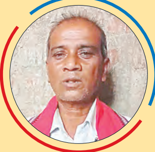
ଅରକ୍ଷିତ ସ୍ୱାଇଁ ସଂକୀର୍ତ୍ତନ ଗାୟକ, ନିଆଳି, କଟକ

କଳି କଳୁଷ ନିବାରଣା କେବଳ ନାମ ସଂକୀର୍ତ୍ତନ ॥ କୃଷ୍ଣ ମୂରତି ଭଗବାନ \ କେବଳ ନାମ ସଂକୀର୍ତ୍ତନ... ଯେଉଁଠି ନାମ ହୁଏ, ସେହି ସ୍ଥାନରେ ପରମବ୍ରହ୍ମ ନାରାୟଣ ବିରାଜମାନ କରନ୍ତି । ସେ ସ୍ଥାନ ପାଲଟିଯାଏ ବୈକୁଣ୍ଠପୁର । ନାମ ହିଁ ପରମ ଧର୍ମ, ନାମ ହିଁ ପରମ ତପ । ନାମ ହିଁ ପରମ ବନ୍ଧୁ । ନାମଠାରୁ ଶ୍ରେଷ୍ଠ ପଦାର୍ଥ ସଂସାରରେ କିଛି ନାହିଁ । କାଶୀ କ୍ଷେତ୍ରରେ ଲକ୍ଷେ ଧେନୁ ଦାନ କଲେ ଯେତକି ପୂର୍ଣ୍ଣ ହୁଏ, ମାତ୍ର ମାସରେ ପ୍ରୟାଗ ଚାର୍ଯ୍ୟରେ ସ୍ନାନ କଲେ ତାହାର ପୂର୍ଣ୍ଣଫଳ ଏବଂ ସୁମେରୁ ତୁଲ୍ୟ ସୁନା ଦାନ କଲେ ଯେତକି ପୂର୍ଣ୍ଣ ହୁଏ, ନାମ ସଂକୀର୍ତ୍ତନ କଲେ ସେତକି ପୂର୍ଣ୍ଣ ମିଳେ । ତେଣୁ ପ୍ରଭୁଙ୍କ ନାମ ସଂକୀର୍ତ୍ତନ ଓ ତାଙ୍କ ଗୁଣକୁ ସବୁଠି ପ୍ରଚାର କରିବାକୁ ୧୦ଜଣ ସଦସ୍ୟଙ୍କୁ ନେଇ ‘ମାଧ୍ୟବାନନ୍ଦ ଜାଉ ସଂକୀର୍ତ୍ତନ ମଣ୍ଡଳୀ’ ଗଢ଼ିଛି । ୧୯୮୦ ମସିହାରୁ ଏଯାବତ ଓଡ଼ିଶାର ପ୍ରାୟତଃ ଜିଲ୍ଲାର ଗ୍ରାମାଞ୍ଚଳ, ସହରାଞ୍ଚଳ ସମେତ ରାଜ୍ୟ ସଂକୀର୍ତ୍ତନ ମହୋତ୍ସବରେ ଯୋଗଦେଇ ପ୍ରଭୁଙ୍କ ଗୁଣଗାନ କରୁଛି । ଅଧିକାଂଶ ନାମ ସଂକୀର୍ତ୍ତନ, ଓଡ଼ିଶା ସଂକୀର୍ତ୍ତନ, ଗୁଣ କୀର୍ତ୍ତନ କରି ପ୍ରଭୁଙ୍କ ସମସ୍ତ ଲାଳା, ତାଙ୍କର ମହିଳା ଓ ଜୀବନଭିତ୍ତିକ ଗାଥାକୁ ସଂକୀର୍ତ୍ତନ ମାଧ୍ୟମରେ ଲୋକଙ୍କ ସାମ୍ନାରେ ପରିବେଷଣ କରୁଛି । ନାମ ସଂକୀର୍ତ୍ତନକୁ ପେସା ନୁହେଁ, ନିଶା ଭାବେ ଗ୍ରହଣ କରିଛି । ତେବେ ଠାକୁରଙ୍କ ନାମ ଓ ଗୁଣ ପ୍ରଚାର କରିବା, ସଂକୀର୍ତ୍ତନ ଜରିଆରେ ଲୋକଙ୍କୁ ସଚେତନ କରିବା ଆମର ପୁଣ୍ୟ ଉଦ୍ଦେଶ୍ୟ । ■