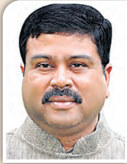
ସୁସ୍ୱରି ମାରି କିଳା ନିମନ୍ତଣ