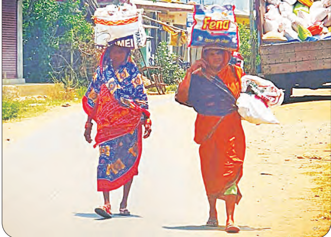
ପେଟ ପାଇଁ ନାଟ: ଅନୁଗୋଳ ହାଟରେ ପରିବା ବେପାର ସାରି ଘରକୁ ଫେରୁଛନ୍ତି ଦୁଇ ବୟସ୍କ ମହିଳା