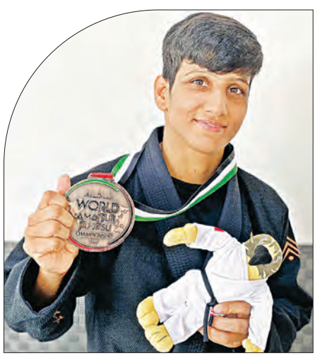
ଏସୀୟ କ୍ଲବ୍-ଚିତ୍ରସ୍ତ୍ରୀ ଚାମ୍ପିଅନସିପ ଅନୁପମାଙ୍କୁ କାମସ୍ୟ ପଦକ

ଜାତୀୟ ମହିଳା ହକି ଲିଗ୍ ହୋଇଥିଲା। ଓଡ଼ିଶା ଏହାର ୩ୟ ମ୍ୟାଚରେ ଶୁକ୍ରବାର ୨-୧ ଗୋଲରେ ମଣିପୁରକୁ ପରାସ୍ତ କରିଥିଲା।