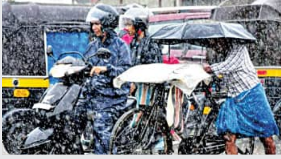
ଗ୍ରୀଷ୍ମ ଲହରୀ ଦ୍ୱାରା ଛଟପଟ ହେଉଥିବା ଉତ୍ତର ଏବଂ ଉତ୍ତର-ପଶ୍ଚିମ ଭାଗ ସମେତ ଦେଶର ବିଭିନ୍ନ ଭାଗରେ ଲୋକଙ୍କୁ ଆଶ୍ଚର୍ଯ୍ୟ ମିଳିବାର ଆଶା ଉଦ୍‌ଘୋଷଣା ହୋଇଛି । ମୌସୁମା କେରଳ ପହଞ୍ଚିବା ପରେ ଉତ୍ତର ଦିଗକୁ

■ କୁଆଁରୀ, ୩୦।୫ (ଏକେପି): ପୂର୍ବ ଆକଳନ ଅନୁସାରେ ବନ୍ଧିଣ ପଶ୍ଚିମ ମୌସୁମା ଗୁରୁବାର କେରଳ ଉପକୂଳ ଛୁଇଁବା ସହିତ ଏହା ଓ ଉତ୍ତର-ପୂର୍ବ ଦିଗରେ ଗତି କରିବା ଆରମ୍ଭ କରିଛି ବୋଲି ଭାରତୀୟ ପାଣିପାଗ ବିଭାଗ(ଆଇଏମଡି) ସ୍ୱସ୍ତ କରିଛି । ମୌସୁମା ପ୍ରାୟତଃ କୁନ୍ ପହିଲାରେ କେରଳ ପହଞ୍ଚିଥାଏ । କିନ୍ତୁ ଚଳିତ ବର୍ଷ ଦୁଇ ଦିନ ଆଗରୁ ପହଞ୍ଚିଯାଇଛି । ଗତବର୍ଷ ମୌସୁମା କେରଳକୁ ସାତ ଦିନ ବିଳମ୍ବରେ ପହଞ୍ଚିଥିଲା । ଠିକଣା ସମୟରେ ମୌସୁମା ପହଞ୍ଚିବା ଏବଂ ଏହାର ଗତି ସ୍ୱାଭାବିକ ରହିଥିବାରୁ ଦେଶର ବିଭିନ୍ନ ଭାଗରେ ବର୍ଷା ହେବାର ସମ୍ଭାବନା ବଢ଼ିଛି । ଏହାଦ୍ୱାରା ପ୍ରବଳ