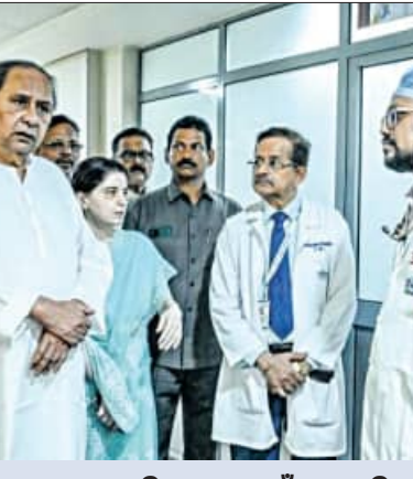
ଉଚ୍ଚସ୍ତରୀୟ ପ୍ରଶ୍ନାବଳିର ତଦନ୍ତ ପାଇଁ ଦେଲେ ନିର୍ଦ୍ଦେଶ ପ୍ରତି ମୃତକଙ୍କ ନିକଟ ଆତ୍ମୀୟଙ୍କୁ ମିଳିବ ୪ ଲକ୍ଷର ଅନୁକମ୍ପା ଘଟଣାସ୍ଥଳରେ ସ୍ଥିତି ଅନୁଧ୍ୟାନ କଲେ ମୁଖ୍ୟ ସଚିବ, ଏସ୍ଆରସି

■ ଭୁବନେଶ୍ୱର, ୩୦।୫ (ସମିପ): ଶ୍ରୀକ୍ଷେତ୍ର ଭଉଁରି ଯାତ ବାଣ ବିସ୍ଫୋରଣରେ ୩ଜଣଙ୍କ ମୃତ୍ୟୁ ହୋଇଥିବା ବେଳେ ୨୭ ଜଣ ରାଜ୍ୟର ବିଭିନ୍ନ ହସ୍ପିଟାଲରେ ଚିକିତ୍ସିତ ହେଉଛନ୍ତି । ଗୁରୁବାର ପୂର୍ବାହ୍ନରେ ମୁଖ୍ୟମନ୍ତ୍ରୀ ନବୀନ ପଟ୍ଟନାୟକ ଭୁବନେଶ୍ୱର ସ୍ଥିତ ସମ୍ ଅଲ୍ଟିମେଟ୍ ହସ୍ପିଟାଲକୁ ଯାଇ ଚିକିତ୍ସିତ ହେଉଥିବା ଆହତମାନଙ୍କୁ ଭେଟିବା ସହ ସେମାନଙ୍କ ଚିକିତ୍ସା ଦାୟିତ୍ୱରେ ଥିବା ମୁଖ୍ୟ ଡାକ୍ତରମାନଙ୍କ ସହିତ ଆଲୋଚନା କରିବା ସହ ସର୍ବୋତ୍ତମ ଚିକିତ୍ସା ଯୋଗାଇଦେବା ପାଇଁ ନିର୍ଦ୍ଦେଶ ଦେଇଛନ୍ତି । ଘରେ ମୁଖ୍ୟମନ୍ତ୍ରୀ ଆହତମାନଙ୍କ ପରିବାରବର୍ଗଙ୍କୁ ଭେଟି ସାହୁଦା ଦେବା ସହ ଆହତମାନଙ୍କ ଆଶୁ ଆରୋଗ୍ୟ କାମନା କରିଛନ୍ତି । ଏଥିସହିତ ବାଣ