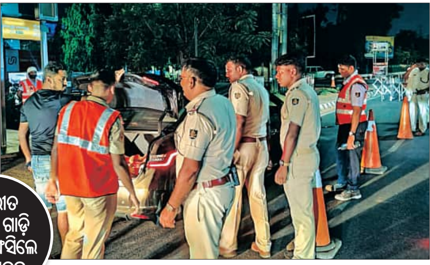
ବିପରୀତ ଦିଗରେ ଗାଡ଼ି ଚଳାଇ ଫସିଲେ ୬୦ ଚାଳକ

ସହରରେ ସମସ୍ତଙ୍କ ସୁରକ୍ଷା ଲାଗି ଶୁଖିଲା ଗାଡ଼ି ଚାଳକମାନଙ୍କୁ ଅଗ୍ରାଧିକାର ଦିଆଯାଉଛି। ଗ୍ରାମିକ କଟକଣା ଭୁଲି ଗାଡ଼ି ଚଳାଇଥିବା ଚାଳକଙ୍କ ବିରୋଧରେ ଧରାପଡ଼ିବା ଜାରିରହିଛି।