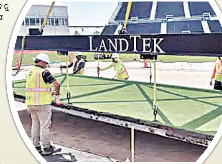
କ୍ରିକେଟ୍ ଷ୍ଟାଡ଼ିୟମରେ ହେବ ପିର୍ ଓ ଅନ୍ୟାନ୍ୟ ଷ୍ଟାଡ଼ିୟମରେ ଖେଳାଯାଇପାରିବ। ଏହାକୁ ହ୍ରାସ ପାଇଁ ସାଧନ କରାଯାଇଥାଏ। ଏହାକୁ ହ୍ରାସ ପାଇଁ ସାଧନ କରାଯାଇଥାଏ। ଏହାକୁ ହ୍ରାସ ପାଇଁ ସାଧନ କରାଯାଇଥାଏ।

ମୋଟ ଉପରେ କହିବାକୁ ଗଲେ ଏହା ଏକ ଅତ୍ୟନ୍ତ ଷ୍ଟାଡ଼ିୟମ। କ୍ରିକେଟ୍ କ୍ରିକେଟ୍ ଉପରେ ଅନୁମତି ଦେଲେ ଅନ୍ୟ କ୍ରୀଡ଼ା ପାଇଁ ମଧ୍ୟ ଏହି ଷ୍ଟାଡ଼ିୟମ ବ୍ୟବହାର କରାଯିବ।