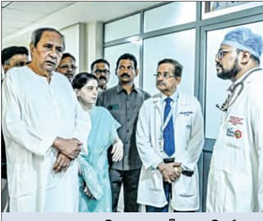
ଉଚ୍ଚସ୍ତରୀୟ ପ୍ରଶ୍ନାବଳି ତଦନ୍ତ ପାଇଁ ଦେଲେ ନିର୍ଦ୍ଦେଶ ପ୍ରତି ମୃତକଙ୍କ ନିକଟ ଆତ୍ମୀୟଙ୍କୁ ମିଳିବ ୪ ଲକ୍ଷର ଅନୁକମ୍ପା ଘଟଣାସ୍ଥଳରେ ସ୍ଥିତି ଅନୁଧ୍ୟାନ କଲେ ମୁଖ୍ୟ ସଚିବ, ଏସ୍ଆର୍ସି

■ ଭୁବନେଶ୍ୱର, ୩୦।୫ (ସମିସ): ଶ୍ରୀକ୍ଷେତ୍ର ଭଉଁରି ଯାତ ବାଣ ବିସ୍ଫୋରଣରେ ଗାଜଣକ ମୃତ୍ୟୁ ହୋଇଥିବା ବେଳେ ୨୭ ଜଣ ରାଜ୍ୟର ବିଭିନ୍ନ ହସ୍ପିଟାଲରେ ଚିକିତ୍ସିତ ହେଉଛନ୍ତି । ଗୁରୁବାର ପୂର୍ବାହ୍ନରେ ମୁଖ୍ୟମନ୍ତ୍ରୀ ନବୀନ ପଟ୍ଟନାୟକ ଭୁବନେଶ୍ୱର ସ୍ଥିତ ସମ୍ ପିଲିମେଟ୍ ହସ୍ପିଟାଲକୁ ଯାଇ ଚିକିତ୍ସିତ ହେଉଥିବା ଆହତମାନଙ୍କୁ ଭେଟିବା ସହ ସେମାନଙ୍କ ଚିକିତ୍ସା ଦାୟିତ୍ୱରେ ଥିବା ମୁଖ୍ୟ ଡାକ୍ତରମାନଙ୍କ ସହିତ ଆଲୋଚନା କରିବା ସହ ସର୍ବୋତ୍ତମ ଚିକିତ୍ସା ଯୋଗାଇଦେବା ପାଇଁ ନିର୍ଦ୍ଦେଶ ଦେଇଛନ୍ତି । ଘରେ ମୁଖ୍ୟମନ୍ତ୍ରୀ ଆହତମାନଙ୍କ ପରିବାରବର୍ଗଙ୍କୁ ଭେଟି ସାନ୍ତ୍ୱନା ଦେବା ସହ ଆହତମାନଙ୍କ ଆଶୁ ଆରୋଗ୍ୟ କାମନା କରିଛନ୍ତି । ଏଥିସହିତ ବାଣ