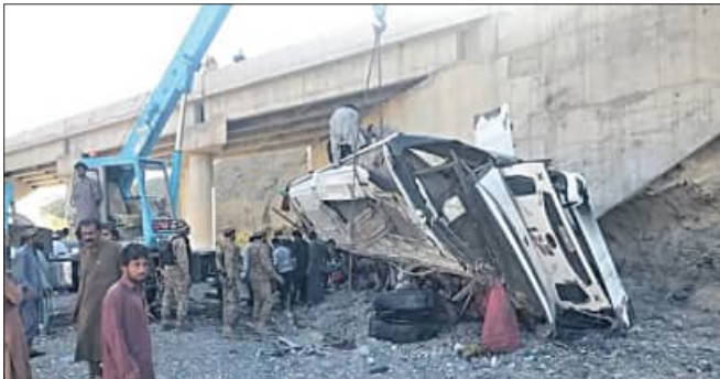
ଇସଲାମାବାଦ, ୨୯।୫ (ଏକେନ୍ଦ୍ର)

ଦକ୍ଷିଣ ପଶ୍ଚିମ ପାକିସ୍ତାନରେ ବେଲୁଚିସ୍ତାନ ପ୍ରଦେଶରେ ଏକ ମର୍ତ୍ତ୍ୟୁଦ ସୂଚକ ବସଟି ଘଟଣାରେ ୨୮ ଜଣଙ୍କ ମୃତ୍ୟୁ ହେବା ସହିତ ୨୦ ଜଣ ଗୁରୁତର ଆହତ ହୋଇଛନ୍ତି। ମିଳିଥିବା ସୂଚନା ଅନୁସାରେ ଏକ ଯାତ୍ରାବାହୀ ବସ ବୋଲୁଚିସ୍ତାନ ପ୍ରଦେଶର ସହର ରୁର୍ବତ ଠାରୁ ରାଜଧାନୀ କୋଟା ଅଭିମୁଖେ ଯାତ୍ରା କରୁଥିଲା ବେଳେ ହଠାତ୍ ବ୍ରାହ୍ମଣ ନିୟନ୍ତ୍ରଣ ହୋଇଥିଲେ। ପଞ୍ଜରେ ବସଟି ରାସ୍ତା କଡ଼ରୁ ଖସି ଏକ ଖାଇ ମଧ୍ୟରେ ପଡ଼ିଥିଲା। ଘଟଣାସ୍ଥଳରେ