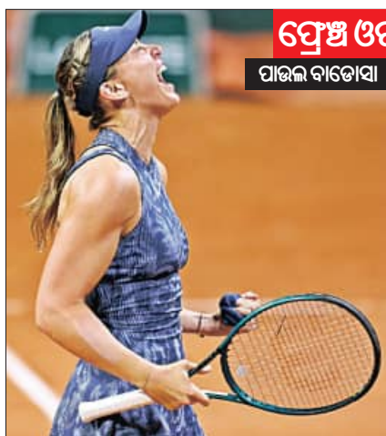
ଫ୍ରେଞ୍ଚ ଓପନ୍ ପାଇଲ୍ ବାଡୋସା