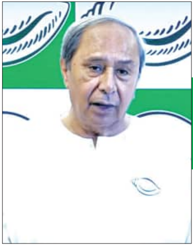
ସାଘ୍ୟକୁ ନେଇ ଅପପ୍ରଚାର କରି ଆସୁଛନ୍ତି। ହେଲେ ଗଲା ତିନିଟି ପର୍ଯ୍ୟାୟ ଭୋଟରେ ବିଜେଡିକୁ ପ୍ରତି ଅଶୀକାଳନ ଭାଷା ପ୍ରୟୋଗ କରିବା ସହ ତାଙ୍କ

■ ଭୁବନେଶ୍ୱର, ୨୮।୫ (ସମ୍ବିଧ): ହାତ ବାଡ଼େଇ ଦମ୍ଭ ଦେଖାଇଛନ୍ତି ମୁଖ୍ୟମନ୍ତ୍ରୀ ନବୀନ ପଟ୍ଟନାୟକ। ବିଜେପିକୁ ମୁଖ୍ୟମନ୍ତ୍ରୀ କଢ଼ା ସମାଲୋଚନା କରିବା ସହ ପାଇଟା ଜବାବ ଦେଇଛନ୍ତି। ତାଙ୍କ ହାତକୁ ନେଇ ବିଜେପି ଯେଉଁ ରାଜନୀତି କରୁଛି ତାହାକୁ ଅପପ୍ରଚାର ବୋଲି ଉଲ୍ଲେଖ କରି ଏପରି ହାନି ରାଜନୀତି କାମ ଦେବନାହିଁ ବୋଲି ମୁଖ୍ୟମନ୍ତ୍ରୀ ବ୍ୟାଘ୍ୟ କରୁଛନ୍ତି। ଅପପ୍ରଚାରକୁ ପ୍ରସଙ୍ଗ କରିବାରେ ବିଜେପି ସବୁବେଳେ ଆଗରେ ରହିଥାଏ। ହେଲେ ବିଜେପିର ଏହି ହାନି ରାଜନୀତି କାମ ଦେବନି ବୋଲି ମୁଖ୍ୟମନ୍ତ୍ରୀ କହିଛନ୍ତି।