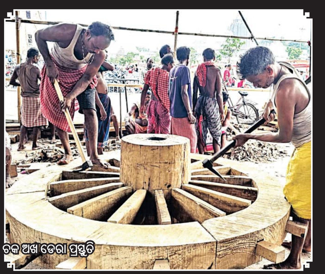
ରଥଖଳାରେ ନାହାକା ଚକ ଅଖ ତୋରା ପ୍ରସ୍ତୁତି