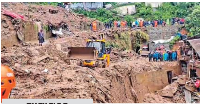
ଆସାମରେ ୨ ମୃତ, ୧୭ ଆହତ

■ ଗୌହାଟୀ, ୨୮।୫ (ଏକେନ୍ଦ୍ର): ସାମୁଦ୍ରିକ ଝଡ଼ ରେମୁଣ୍ଡା ଗତ ରବିବାର ରାତିରେ ପଶ୍ଚିମବଙ୍ଗ ଏବଂ ବାଙ୍ଗଳାଦେଶ ଉପକୂଳରେ ସୁଲଭା ଛୁଇଁବା ପରେ ଏହି ଅଞ୍ଚଳରେ ପ୍ରବଳ ବର୍ଷା ଯୋଗୁଁ ନାହିଁ ନଥିବା କ୍ଷତି ଘଟିଛି । କେବଳ ପଶ୍ଚିମବଙ୍ଗ କିମ୍ବା ବାଙ୍ଗଳାଦେଶ ନୁହେଁ; ଆସାମ, ମିଜୋରାମ ଭଳି ଉତ୍ତର ପୂର୍ବାଞ୍ଚଳର କିଛି ରାଜ୍ୟ ମଧ୍ୟ ରେମୁଣ୍ଡା ଦ୍ୱାରା ପ୍ରଭାବିତ ହୋଇଛି । ଏହି ଦୁଇ ରାଜ୍ୟରେ ବିଗତ ଦୁଇ ଦିନ ଧରି ପ୍ରବଳରୁ ଅତି ପ୍ରବଳ ବର୍ଷା ହେବା ଦ୍ୱାରା ମିଜୋରାମରେ ୧୭ ଜଣଙ୍କ ମୃତ୍ୟୁ ହେବା ସହିତ ଆସାମରେ ଦୁଇ ଜଣଙ୍କ ମୃତ୍ୟୁ ହୋଇଛି । ବିଭିନ୍ନ ଘଟଣାରେ ଉଭୟ ରାଜ୍ୟରେ ୨୦୦ରୁ ଅଧିକ ଲୋକ ଆହତ ହୋଇଛନ୍ତି । ମିଳିଥିବା ଖବର ଅନୁସାରେ ମିଜୋରାମର ଆଇଲୁଲ କିଲ୍ଲରେ