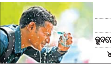
୪୫.୯ ଡିଗ୍ରୀ ସହ ବୌଦ୍ଧ ସବୁଠୁ ଉଚ୍ଚ ଉପକୂଳରେ କଲବଳ କଲା ଗୁରୁଗୁଳି ଭୁବନେଶ୍ୱରରେ ୩୯ ଡିଗ୍ରୀ, ୬୩ ଡିଗ୍ରୀ ଭଳି ଅନୁଭବ ୪୩ ଡିଗ୍ରୀ ଉପରେ ୧୦ ସହରର ତାପମାତ୍ରା

ବାଲାଙ୍ଗିରରେ ୪୪.୫, ହାରାକୁଦରେ ତାପମାତ୍ରା ୪୩.୬, ପୁଲଘାଣାରେ ୪୩.୩, ନୂଆପଡ଼ାରେ ୪୩.୩, ତାଳଚେରରେ ୪୨.୨, ବରଗଡ଼ରେ ୪୨.୨, ମାଲକାନଗିରିରେ ୪୧.୬, ସୁନ୍ଦରଗଡ଼ରେ ୪୧.୬, ପାରଳାଖେମୁଣ୍ଡିରେ ୪୧.୫, ଅନୁଗୋଳରେ ୪୧.୧ ଓ ନୟାଗଡ଼ରେ ୪୦.୩ ଡିଗ୍ରୀ ରେକର୍ଡ କରାଯାଇଛି। ବିଶେଷକରି ପଶ୍ଚିମ ଓଡ଼ିଶାରେ