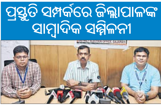
ପ୍ରସ୍ତୁତି ସମ୍ପର୍କରେ ଜିଲ୍ଲାପାଳଙ୍କ ସାମ୍ବାଦିକ ସମ୍ମିଳନୀ