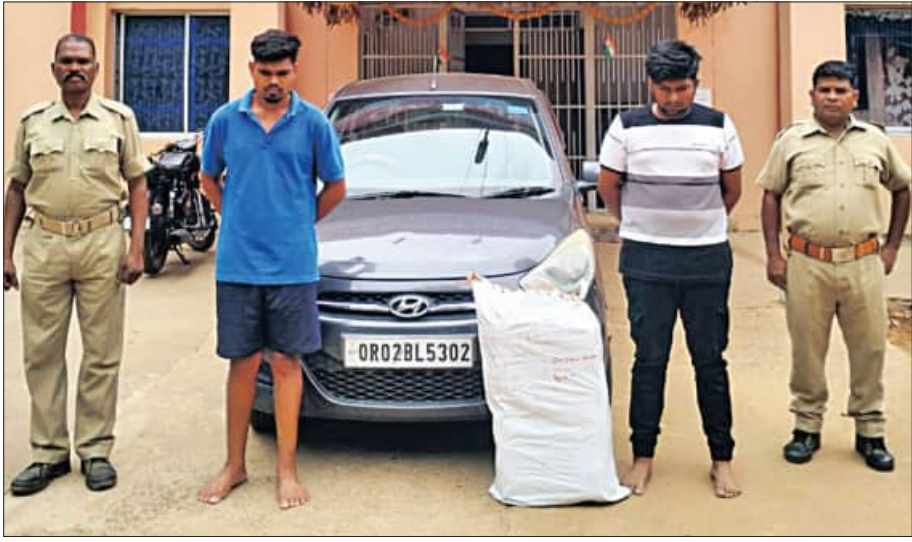
ପିରିଜିଆ, ୨୮।୫ (ସମିପ): କିଛିଦିନ ନାବବତା ପରେ ପିରିଜିଆ ପୁଲିସ ଏକ କାର ସହ ୧୬ କିଲୋ ବୁଲ୍ ଶହ ଗ୍ରାମ ଗଞ୍ଜେଇ ଜବତ କରିବାରେ ସଫଳ ହୋଇଛି । ଏସମ୍ପର୍କରେ

କାର ଡ୍ରାଇଭର ଓ ଗଞ୍ଜେଇ ଚୋରାଚାଲାଣକାରୀକୁ ଗିରଫ କରି କୋର୍ଟ ଚାଲାଣ କରିଛି ପୁଲିସ । ଗିରଫ ହୋଇଥିବା ବୁଲ୍ ଶହ ପିରିଜିଆ ଥାନା ବନ୍ଧଗଡ଼ ଗାଁ ବିଧାନ ସଭା ସହ