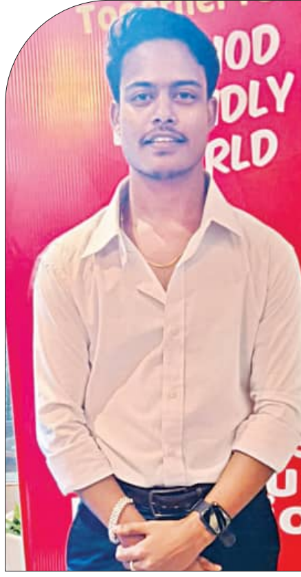
ବିବାହ କରିଛୁ । ଏଥିରେ ପରିବାର ସହମତି ମଧ୍ୟ ରହିଛି । ଆମେ ଖୁସି ରହିଛୁ ।

ଯେ ହେତୁ ମୁଁ ଝିଅ ଥିଲି, ସ୍କୁଲ ସମୟରୁ ଝିଅମାନଙ୍କ ପ୍ରତି ମୋର ଦୁର୍ବଳତା ରହିଥିଲା । କିନ୍ତୁ ଏହାକୁ ସେମାନେ ପ୍ରେମ ନୁହେଁ ବର୍ତ୍ତ ବନ୍ଧୁର ସମ୍ପର୍କ ଭାବୁଥିଲେ । ମୁଁ ମଧ୍ୟ ଭୟ ଓ ଲାଜରେ ମନକଥା କାହାରିକୁ କହିପାରୁ ନ ଥିଲି । ମୁଁ ଭାବେ ଦୁନିଆରେ ମୋ ଭଳି କେହି ନ ଥିବେ । କିନ୍ତୁ ଏକ କାର୍ଯ୍ୟକ୍ରମରେ ଜଣେ ଟ୍ରାନ୍ସଜେଣ୍ଡର ସହ ସାକ୍ଷାତ ହୋଇଥିଲା । ଦୁହେଁ ପରସ୍ପରକୁ ଭଲରେ ବୁଝିବା ପରେ