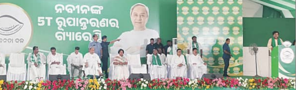
ଜଗତସିଂହପୁର, ୨୬।୫

ପଞ୍ଚମ ପର୍ଯ୍ୟାୟ ନିର୍ବାଚନ ପାଇଁ ମୁଖ୍ୟମନ୍ତ୍ରୀ ଜଗତସିଂହପୁର ସଂସଦୀୟ କ୍ଷେତ୍ରର ଦୁଇଟି ସ୍ଥାନରେ ଯୋଗ୍ୟତା ମାରାଧନ ପ୍ରଚାର କରିଛନ୍ତି। ଦକ୍ଷିଣ ପ୍ରାଣ୍ଟକୁ ବିଜୟ କରି ବିକାଶରଥାକୁ ଅବ୍ୟାହତ ରଖିବାକୁ ଜଗତସିଂହପୁର ସହରର ନବକୃଷ୍ଣ ଚୈତ୍ରୀଣୀ ସ୍ମାରକମଠାରେ ଅନୁଷ୍ଠିତ ବିଶାଳ ନିର୍ବାଚନ ସଭାରେ ମୁଖ୍ୟମନ୍ତ୍ରୀ ନବୀନ ପଟ୍ଟନାୟକ ଆହ୍ୱାନ ଦେଇଛନ୍ତି। ଆଗରୁ ଆସିଥିବା ବିଜୁ ଜନତା ଦଳ ଆସିବ ନାହିଁ ଓ ସମସ୍ତଙ୍କୁ ବିଏସକେଏଲରେ ସାମିଲ କରାଯିବ ବୋଲି କହିଥିଲେ। ଲୋକଙ୍କୁ ବିରୋଧୀମାନେ ମିଛ କହିବାକୁ ଚାହୁଁଛନ୍ତି ବୋଲି ଶ୍ରୀ ପଟ୍ଟନାୟକ ଅଭିଯୋଗ କରିବା ସହିତ ବିରୋଧୀ ଦଳ ଏବେ କୁମ୍ଭୀର କାନ୍ଦଣା କାନ୍ଦୁଛନ୍ତି ବୋଲି କହି ତାକୁ ସମାଲୋଚନା କରିଥିଲେ। ମୁଖ୍ୟମନ୍ତ୍ରୀ ପ୍ରଥମେ ଲୋକଙ୍କୁ ପ୍ରଥମେ ପ୍ରବଳ ଖରା ସହ୍ୟକରି ଦୂରକୁ ଆସିଥିବାରୁ ଧନ୍ୟବାଦ ଜଣାଇଥିଲେ। ଏହାପରେ ବିଏସକେଏଲ ଯୋଜନା, ମିଶନଶକ୍ତି, ମମତା ଯୋଜନା, ଲକ୍ଷ୍ମୀ ବସ୍ ସେବା, ୫-ଟି ସ୍କୁଲ ଯୋଜନା, କାଳିଆ ଯୋଜନା, ମଧୁରାଜୁ