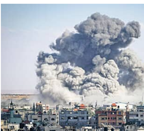
ଥବା ବିସ୍ମାପିତ ପାଲେଷ୍ଟାନୀୟ ଶିବିର ଉପରେ ଗତକାଲି ଲସ୍ତାଏଲ ସେନା

ରାଫା (ପାଲେଷ୍ଟାଇନ), ୨୬।୫ (ଏକେନ୍ଦ୍ରି) ଏକାଧିକ ବାର ଷ୍ଟେସିଆନ୍ ଆକ୍ରମଣ କରିଥିଲା । ସେଥିରେ ପ୍ରାୟ ୪୦ଜଣ ନିରସ୍ତ ପାଲେଷ୍ଟାନୀୟ ନିହତ ହୋଇଥିଲେ । ମୃତକଙ୍କ ମଧ୍ୟରୁ ଅଧିକାଂଶ ହେଲେ ମହିଳା