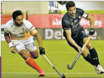
ହିତାୟ କାର୍ତ୍ତିକେ କିନ୍ତୁ ଭାରତ ୨ଟି ଓ ଆଜେଣ୍ଡା ଗୋଟିଏ ଗୋଲ୍ ଦେଇଥିଲା। ଫଳରେ ପ୍ରଥମାଞ୍ଚରେ ଭାରତ ୩-୨ରେ ୧-୧ର ବରାବରତ୍ୱକୁ ଆଣିଥିଲେ।