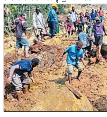
ଫଖୀର ଚିନିଗୁଣା ପିଏନ୍‌ଜିର ଏନଗା ପ୍ରଦେଶର ଯାମୁଲି ଗ୍ରାମ ଏହି ଭୂସ୍ଫଳନରେ ନିହତ ହୋଇଯାଇଛନ୍ତି । ସେହି ଗ୍ରାମ ଓ ନିକଟବର୍ତ୍ତୀ ପ୍ରାଚୀନ ଅଞ୍ଚଳରୁ ୧୨୫୦

ପପୁଆ ନିଉ ଗିନି (ପିଏନ୍‌ଜି) ଗତ ୨୪ତାରିଖରେ ଘଟିଥିବା ବଡ଼ ଧରଣର ଭୂସ୍ଫଳନରେ ୨ହଜାରରୁ ଅଧିକ ଲୋକ ଜୀବନ୍ତ ଯୋଡ଼ି ହୋଇ ମୃତ୍ୟୁ ଲାଭିଛନ୍ତି ବୋଲି ସେଠାକାର ସରକାର ଗତକାଲି ଜାତିସଂଘକୁ ଏକ ପତ୍ର ଲେଖି ଅବଗତ କରାଇଛନ୍ତି । ଅଧିକ ସେ ପତ୍ର ସାର୍ବଜନୀନ ହୋଇଛି । ଗତକାଲି ଜାତିସଂଘର ମାଇଗ୍ରେସନ୍ ଏକେଡ଼ି ଲକ୍ଷ୍ମଣନାଥମାନଙ୍କ ଅନୁମତିରେ ପତ୍ର ମାଇଗ୍ରେସନ୍ ପିଏନ୍‌ଜି ଭୂସ୍ଫଳନରେ ୨୦୦୦ ଜଣଙ୍କ ମୃତ୍ୟୁ ଘଟିଥିବା ପ୍ରକାଶ କରିଥିଲା । ଜାତିସଂଘ ମାଇଗ୍ରେସନ୍ ଏକେଡ଼ିର ଭୂମି ପରିଦର୍ଶନରେ ହତ୍ୟା କରିଥିଲେ । ନିମନ୍ତେ ପିଏନ୍‌ଜି ସରକାର ଜାତିସଂଘକୁ ଜଣାଇଛନ୍ତି ଯେ ଭୂସ୍ଫଳନ ପ୍ରକ୍ରେମରେ ୨