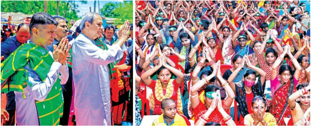
ମୟୂରଭଞ୍ଜ, ବାଲେଶ୍ୱର ଏବଂ ଯାଜପୁର ଜିଲ୍ଲାରେ ମୁଖ୍ୟମନ୍ତ୍ରୀ ନବୀନ ପଟ୍ଟନାୟକଙ୍କ ମାରାଧର୍ ପ୍ରଚାର

■ ଭୁବନେଶ୍ୱର, ୨୪।୫ (ସମିପ): ଆପଣମାନେ ବିରୋଧୀଙ୍କୁ ସଂସଦ କରି ଦିଲ୍ଲା ପଠାଇଲେ। ସେ ଆପଣମାନଙ୍କ ପାଇଁ କ'ଣ କରିଛନ୍ତି? ସେ କେବଳ ମିଛ କହି ଜାଣନ୍ତି; କାମରେ କିଛି ଶୂନ୍ୟ। ଲୋକ ସବୁ ବୁଝି ସାରିଲେଣି। ତାଙ୍କର ଛଳନା ଆଉ ତଳିବ ନାହିଁ। ମୟୂରଭଞ୍ଜ, ବାଲେଶ୍ୱର ଏବଂ ଯାଜପୁର ଜିଲ୍ଲାରେ ନିର୍ବାଚନ ପ୍ରଚାର କରିବା ଅବସରରେ ବିରୋଧୀଙ୍କୁ ଏକାକି ଭଙ୍ଗରେ ଶାଣିତ ସମାଲୋଚନା କରୁଛନ୍ତି ବିଜେଡି ସୁପ୍ରିମୋ ତଥା ମୁଖ୍ୟମନ୍ତ୍ରୀ ନବୀନ ପଟ୍ଟନାୟକ।