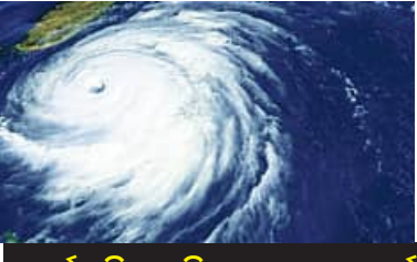
ସତର୍କ ରହିବାକୁ ଜିଲ୍ଲାପାଳଙ୍କୁ ପରାମର୍ଶ ୨୮ ରୁ ରାଜ୍ୟରେ ପୂର୍ଣ୍ଣ ବର୍ଷା ବାଟି

■ ଭୁବନେଶ୍ୱର, ୨୪।୫ (ସମିପ): ବଙ୍ଗୋପସାଗରରେ ସୃଷ୍ଟି ହୋଇଥିବା ଲଘୁଚାପ ଅବପାତରେ ପରିଣତ ହୋଇଛି। ଏହା ଅଧିକ ଶକ୍ତିଶାଳୀ ହୋଇ ୨୫ ତାରିଖ ସକାଳ ସୁଦ୍ଧା ବାତ୍ୟା ରେ ପରିଣତ ହେବାର ସମ୍ଭାବନା ରହିଛି। ୨୫ ତାରିଖ ରାତି ସୁଦ୍ଧା ଏହା ଭାଷଣ ରୂପ ନେଇ ଉତ୍ତର ଦିଗକୁ ଗତି କରିବ। ୨୬ ତାରିଖ ମଧ୍ୟରାତିରେ ବାତ୍ୟା 'ରେମଲ' ସାଗର ଦ୍ୱୀପ ଓ ଖେପୁପରା ମଝିରେ ବାଂଲାଦେଶ ଏବଂ ପଶ୍ଚିମବଙ୍ଗ ସୀମା ଦେଇ ସ୍ଥଳଭାଗ ଅତିକ୍ରମ କରିବ। ବାତ୍ୟାର ସିଧାସଳଖ ପ୍ରଭାବ ଓଡ଼ିଶା ଉପରେ ନ ପଡ଼ିଲେ ହେଁ ଉତ୍ତର ଓଡ଼ିଶାର କିଛି ଜିଲ୍ଲାରେ ପ୍ରବଳ ଥିବ ପ୍ରବଳ ବର୍ଷା ହେବ ବୋଲି ପାଣିପାଗ କେନ୍ଦ୍ର ଆକଳନ କରିଛି।