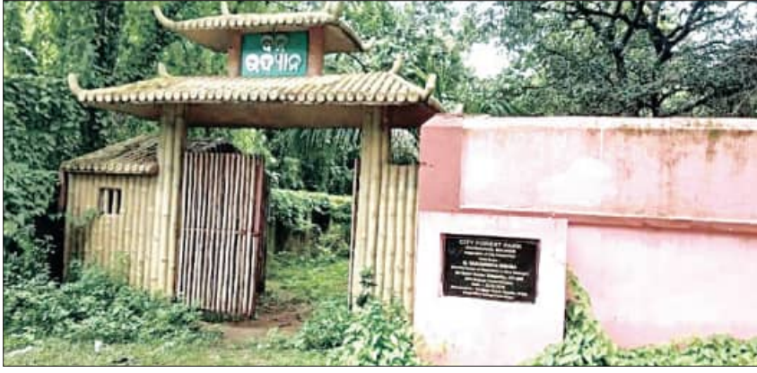
ବଲାଙ୍ଗିର, ୨୪।୫ (ସମିପ)

ସହର ଭିତରେ ଜଙ୍ଗଲର ଅନୁଭୂତି। ପ୍ରାୟତଃ ପ୍ରାୟତଃ ସହରବାସୀ ଏହାସହିତ ଜଙ୍ଗଲର ଅନୁଭୂତି ପାଇଁ ଯାଆନ୍ତି।