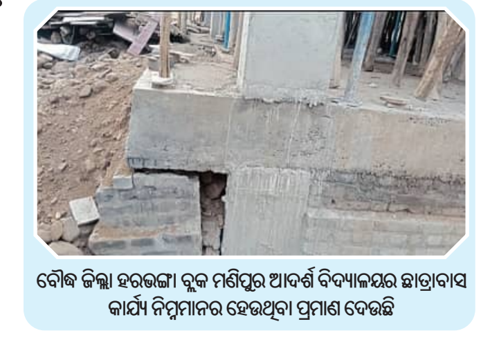
ବୌଦ୍ଧ ଜିଲ୍ଲା ହରଭଙ୍ଗା ବ୍ଲକ୍ ମଣିପୁର ଆଦର୍ଶ ବିଦ୍ୟାଳୟର ଛାତ୍ରାବାସ କାର୍ଯ୍ୟ ନିମ୍ନମାନର ହେଉଥିବା ପ୍ରମାଣ ଦେଖି