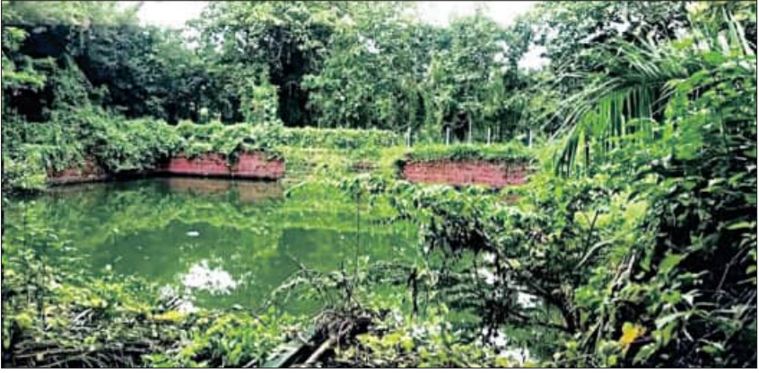
ପୂର୍ବରୁ ୨୦୧୯ରେ ହୋଇଥିବା ବନ୍ୟା ସମୟରେ ମଧ୍ୟ ପାର୍କ ଭିତରକୁ ନିକଟସ୍ଥ ଲକ୍ଷ୍ମୀଯୋଗର ପାଣି ମାଡ଼ିଯାଇ ବାକି ରହିଥିବା ଶୋଭାକୁ ମଧ୍ୟ ନଷ୍ଟ କରିଦେଇଥିଲା।

ଅନାବନା ଘାସ ମାଡ଼ି ବସିଥିବା ବେଳେ ପରିତ୍ୟକ୍ତ ଅବସ୍ଥାରେ ଏହି ପାର୍କ ପଡ଼ି ରହିଛି।