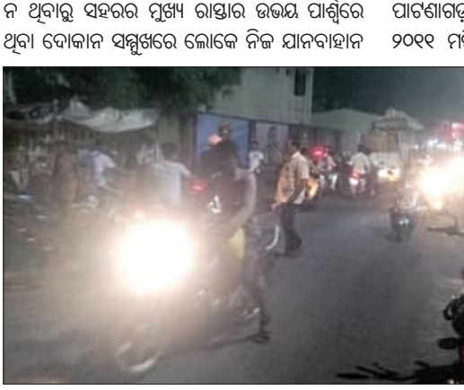
ରଖିଥିବା ଗ୍ରାମିକ ସମସ୍ୟା ଉପସ୍ଥାପନା ମତ ପ୍ରକାଶ କରାଯାଇଛି।

ପାଟଣାଗଡ଼, ୨୪।୫ (ସମିପ): ପାଟଣାଗଡ଼ ସହରର ମୁଖ୍ୟ ରାସ୍ତାରେ ଦୀର୍ଘ ଦିନ ଧରି ଗ୍ରାମିକ ସମସ୍ୟା ଲାଗି ରହିଛି। କିନ୍ତୁ ଏ ପର୍ଯ୍ୟନ୍ତ ଏହି ସମସ୍ୟାର ସ୍ଥାୟୀ ସମାଧାନ ହୋଇପାରି ନାହିଁ।