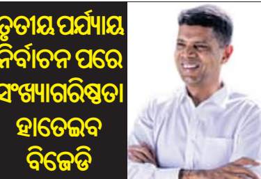
ତୃତୀୟ ପର୍ଯ୍ୟାୟ ନିର୍ବାଚନ ପରେ ସଂଖ୍ୟାଗରିଷ୍ଠତା ହାତେଇବ ବିଜେଡି

■ ଭୁବନେଶ୍ଵର, ୨୪।୫ (ସମିଧ) : ଓଡ଼ିଶାରେ ବଡ଼ ବ୍ୟବସାୟରେ ସରକାର କରିବ ବିଜେଡି । ରାଜ୍ୟରେ ତୃତୀୟ ପର୍ଯ୍ୟାୟ ନିର୍ବାଚନ ପରେ ରାଜ୍ୟବାସୀ ଓ ମହାପ୍ରଭୁଙ୍କ ଆଶୀର୍ବାଦରେ ମୁଖ୍ୟମନ୍ତ୍ରୀ ନବୀନ ପଟ୍ଟନାୟକଙ୍କୁ ସହକରେ ସଂଖ୍ୟାଗରିଷ୍ଠତା ମିଳିବ ବୋଲି ବିଜେଡି ନେତା କାର୍ତ୍ତିକ ପାଣିଆନ୍ କହିଛନ୍ତି । ଶୁକ୍ରବାର ଶ୍ରୀ ପାଣିଆନ୍ ସାମ୍ବାଦିକ ସମ୍ମିଳନୀରେ କହିଛନ୍ତି ଯେ ବିଜେପି ୨୦୧୪ରୁ ପରିବର୍ତ୍ତନ କଥା କହି ଆସୁଛି । ପ୍ରତି ଉପନିର୍ବାଚନରେ ମଧ୍ୟ ପରିବର୍ତ୍ତନ କଥା କହିଆସିଛି । ଏବେ ସେହି ପଥ ବିଜେପି ଆପଣାଇଛି । ଏହା ବିଜେପିର ରାଜନୈତିକ ରଣନୀତି । ମାତ୍ର ରାଜ୍ୟରେ ସବୁ ସ୍ଥାନରେ ନବୀନ ବାବୁଙ୍କର ହାତୀ