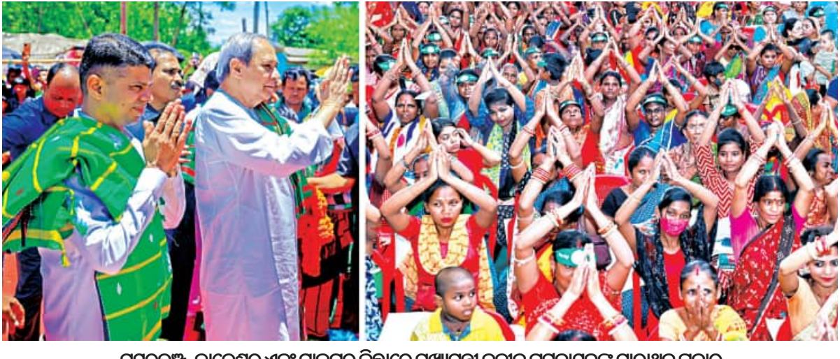
ମୟୂରଭଞ୍ଜ, ବାଲେଶ୍ୱର ଏବଂ ଯାଜପୁର ଜିଲ୍ଲାରେ ମୁଖ୍ୟମନ୍ତ୍ରୀ ନବୀନ ପଟ୍ଟନାୟକଙ୍କ ମାରାଧର୍ ପ୍ରଚାର

■ ଭୁବନେଶ୍ୱର, ୨୪।୫ (ସମିପ): ଆପଣମାନେ ବିରୋଧୀଙ୍କୁ ସଂସଦ କରି ଦିଲ୍ଲା ପଠାଇଲେ। ସେ ଆପଣମାନଙ୍କ ପାଇଁ କ'ଣ କରିଛନ୍ତି? ସେ କେବଳ ମିଛ କହି ଜାଣନ୍ତି; କାମରେ କିଛି ଶୂନ୍ୟ। ଲୋକ ସବୁ ବୁଝି ସାରିଲେଣି। ତାଙ୍କର ଛଳନା ଆଉ ଚଳିବ ନାହିଁ। ମୟୂରଭଞ୍ଜ, ବାଲେଶ୍ୱର ଏବଂ ଯାଜପୁର ଜିଲ୍ଲାରେ ନିର୍ବାଚନ ପ୍ରଚାର କରିବା ଅବସରରେ ବିରୋଧୀଙ୍କୁ ଏକାକି ଭଙ୍ଗରେ ଶାଣିତ ସମାଲୋଚନା କରୁଛନ୍ତି ବିଜେଡି ସୁପ୍ରିମୋ ତଥା ମୁଖ୍ୟମନ୍ତ୍ରୀ ନବୀନ ପଟ୍ଟନାୟକ।