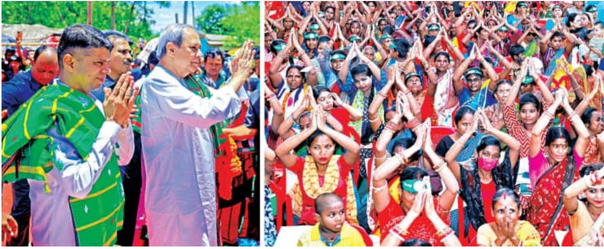
ମୟୂରଭଞ୍ଜ, ବାଲେଶ୍ୱର ଏବଂ ଯାଜପୁର ଜିଲ୍ଲାରେ ମୁଖ୍ୟମନ୍ତ୍ରୀ ନବୀନ ପଟ୍ଟନାୟକଙ୍କ ମାରାଧର୍ ପ୍ରଚାର

■ ଭୁବନେଶ୍ୱର, ୨୪।୫ (ସମିପ): ଆପଣମାନେ ବିରୋଧୀଙ୍କୁ ସଂସଦ କରି ଦିଲ୍ଲା ପଠାଇଲେ। ସେ ଆପଣମାନଙ୍କ ପାଇଁ କ'ଣ କରିଛନ୍ତି? ସେ କେବଳ ମିଛ କହି ଜାଣନ୍ତି; କାମରେ କିଛି ଶୂନ୍ୟ। ଲୋକ ସବୁ ବୁଝି ସାରିଲେଣି। ତାଙ୍କର ଛଳନା ଆଉ ଚଳିବ ନାହିଁ। ମୟୂରଭଞ୍ଜ, ବାଲେଶ୍ୱର ଏବଂ ଯାଜପୁର ଜିଲ୍ଲାରେ ନିର୍ବାଚନ ପ୍ରଚାର କରିବା ଅବସରରେ ବିରୋଧୀଙ୍କୁ ଏକାକି ଭଙ୍ଗରେ ଶାଣିତ ସମାଲୋଚନା କରୁଛନ୍ତି ବିଜେଡି ସୁପ୍ରିମୋ ତଥା ମୁଖ୍ୟମନ୍ତ୍ରୀ ନବୀନ ପଟ୍ଟନାୟକ।