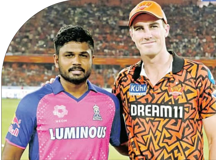
ପରସ୍ପରକୁ ୧୯ଥର ଭେଟିଥିବା ବେଳେ ହାଇଦ୍ରାବାଦ ୧୦ ଓ ରାଜସ୍ଥାନ ୯ଟି ମ୍ୟାଚ୍ରେ ବିଜୟ ହୋଇଛି ।

ଇଣ୍ଡିଆନ ପ୍ରିମିୟର ଲିଗ୍ (ଆଇପିଏଲ୍)ର ଚଳିତ ୧୭ତମ ସଂସ୍କରଣ ଅନ୍ତିମ ପର୍ଯ୍ୟାୟରେ ପହଞ୍ଚିଛି । ଆଜି ଦୁଇଟି ମ୍ୟାଚ୍ ପରେ କେଉଁ ଦଳ ଚାମ୍ପିଆନ୍ ହେବ ତାହା ସ୍ପଷ୍ଟ ହେବ । କ୍ୱାଲିଫାୟର ୧ରେ ଶ୍ରେୟସ୍ ଆୟରଙ୍କ ନେତୃତ୍ୱାଧୀନ କୋଲକାତା ନାଇଟ୍ ରାଇଡର୍ସ (କେକେଆର) ୮ ଓକେଟରେ ସନରାଇଜର୍ସ ହାଇଦ୍ରାବାଦ (ଏସ୍ଆରଏଚ୍)କୁ ପରାସ୍ତ କରି ସିଧାସଳଖ ଫାଇନାଲକୁ ଉଠିଥିଲା । ଶୁକ୍ରବାର କ୍ୱାଲିଫାୟର ୨ରେ ସାଣ୍ଟୁ ସାମସନଙ୍କ ରାଜସ୍ଥାନ ରୟାଲ୍ସ ଓ ପ୍ୟାଟ୍ କମିନ୍ସଙ୍କ ହାଇଦ୍ରାବାଦ ପରସ୍ପରକୁ ଭେଟିବେ । ସ୍ଥାନୀୟ ଏମ୍ ବିବାପୁରମ୍ ସ୍ଥାନରେ ଖେଳାଯିବାରୁ ଥିବା ଏହି ନିର୍ଣ୍ଣାୟକ ମ୍ୟାଚ୍ ବିଜୟୀ ଦଳ ଚାଲିଯିବ ପାଇଁ ରବିବାର ଫାଇନାଲ ମୁକାବିଲାରେ କୋଲକାତାକୁ ଭେଟିବ । ଏଲିମିନେଟରରେ ରାଜସ୍ଥାନ ରୟାଲ୍ସ ୪ ଓକେଟରେ ରୟାଲ୍ ଚ୍ୟାଲେଞ୍ଜର୍ସ ବେଙ୍ଗାଲୁରୁ (ଆରସିବି)କୁ ପରାସ୍ତ କରି କ୍ୱାଲିଫାୟର ୨ ଖେଳିବାକୁ ଯୋଗ୍ୟତା ଅର୍ଜନ କରିଥିଲା । ଏହି ନିର୍ଣ୍ଣାୟକ ମ୍ୟାଚ୍ରେ ବିଜୟ ହୋଇ ହାଇଦ୍ରାବାଦ ଓ ରାଜସ୍ଥାନ ଫାଇନାଲ ଟିକେଟ୍ ହାସଲ ଲକ୍ଷ୍ୟରେ ରହିଛନ୍ତି । ପୂର୍ବରୁ ଦୁଇ ଦଳ