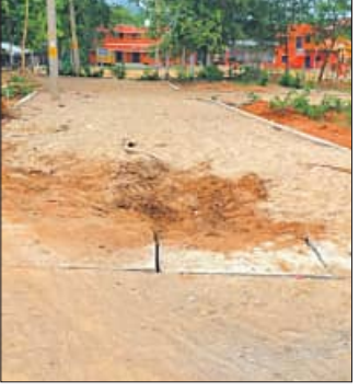
ଘଟୁଛି। ସୂଚନାଯୋଗ୍ୟ ଯେ, ଅଞ୍ଚଳର ଜନସାଧାରଣଙ୍କ ସୁବିଧା ନିମନ୍ତେ ପୌର ପରିଷଦ ପକ୍ଷରୁ ଟେଣ୍ଡର ମାଧ୍ୟମରେ ପେଭର

ଗୁରୁପୁର, ୨୩।୫ (ସମିପ୍): ପୌର ପରିଷଦ ଅଧୀନସ୍ଥ ୧୯ ନମ୍ବର ଖାର୍ଜି ବାଣୀଶ୍ରୀ ବିହାର ରାସ୍ତା କାମ ଅଧିକାଂଶ ଅଟକି ରହିଛି। ଠିକାଦାର ଜଣକ କାର୍ଯ୍ୟାଦେଶ ପାଇବାର କେନ୍ଦ୍ର ଦିନ ପରେ ରାସ୍ତା କାର୍ଯ୍ୟ ଆରମ୍ଭ ହୋଇଥିଲା। ଗତ ଦେଓଗୁଡ଼ା ପ୍ରଥମ ସପ୍ତାହରୁ ରାସ୍ତା କାର୍ଯ୍ୟ ଆରମ୍ଭ କରାଯାଇଥିବା ବେଳେ ବର୍ତ୍ତମାନ ଅଧିକାଂଶ ଅଟକି ରହିଛି। ତେବେ ରାସ୍ତା ନିର୍ମାଣ କାର୍ଯ୍ୟ ଶେଷ କରାଯିବାକୁ ପ୍ରୟାସ ବି କରାଯାଉ ନ ଥିବାରୁ ଲୋକେ ଅସନ୍ତୋଷ ପ୍ରକାଶ କରିଛନ୍ତି। ଏହି ଅଞ୍ଚଳର ଏକ ମାତ୍ର ରାସ୍ତା ଉପରେ ଛାଡ଼ିଛାଡ଼ି, ସରକାରୀ କର୍ମଚାରୀ, ବ୍ୟବସାୟୀଙ୍କ ସମେତ ୫ ଖଣ୍ଡ ସାହିର ଲୋକେ ନିର୍ଭର କରିଥାନ୍ତି। ତେବେ ଅସଜଡ଼ା ହୋଇ ପଡ଼ିରହିଥିବା ଅଟକିଥିବା ରାସ୍ତାରେ ଅତି ବିପଦ ଭାବେ ଚଳିପୁଚଳ କରିବାକୁ ବାଧ୍ୟ ହେଉଛନ୍ତି। ଜରୁରୀ କ୍ଷେତ୍ରରେ ଅଟକି ଚିକିତ୍ସା ବାଧ୍ୟତା ଚଳାଚଳ ମଧ୍ୟ କରିବାରେ ପୁସ୍ତିକ ହୋଇ ପଡ଼ୁଛି। ଏପରିକି ଏହି ରାସ୍ତା ଦେଇ କୌଣସି ଗାଡ଼ି ଗଲେ ଦୁର୍ଘଟଣା ମଧ୍ୟ