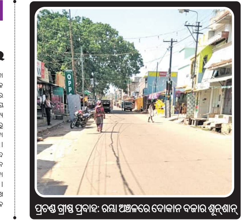
ପ୍ରତ୍ୟକ୍ଷ ଗ୍ରାଣ୍ଠ ପ୍ରବାହ: ରସା ଅଞ୍ଚଳରେ ଦୋକାନ ବଜାର ଶୂନ୍ୟଗାନ୍

ରହେନି କାରଣ ସେତେବେଳକୁ ତାଳ ସବୁ ବୁଢ଼ା ହୋଇଯାଇଥାଏ। ଗୋଲାପଡ଼ା ପଞ୍ଚାୟତରେ କେତେକ ଗ୍ରାମ ଓ ପ୍ରତାପୁର ଅଞ୍ଚଳର ବଣଆପାଳି ଗ୍ରାମର ଅନେକ ପରିବାର ବର୍ଷର ବୁଦ୍ଧ ମାସ ଏହି ବ୍ୟବସାୟ କରି ଭଲ ରୋଜଗାର କରିଥାନ୍ତି। କଣିକା ସାମ୍ନ୍ୟ ପକ୍ଷେ ହିତକାରୀ ହେବା ସହ କଳିଆ ହୋଇଥିବାରୁ ପାଟିକୁ ସୁଆଦିଆ ଲାଗିଥାଏ ଏବଂ ଏଥିରେ ଥିବା ଜଳାୟତ୍ତ ଉପଚାରିକର ତୃଷ୍ଣା ନିବାରଣ କରିଥାଏ। ତେଣୁ ଏହାକୁ ଅଧିକାଂଶ ଲୋକ ଖୁବ୍ ପସନ୍ଦ କରନ୍ଥାନ୍ତି। ଦର ମଧ୍ୟ କମ ହୋଇଥିବାରୁ ଲୋକମାନେ ରାସ୍ତା କଡ଼େ ବିକ୍ରି ହେଉଥିବା ତାଳକୁ ନିଜେ ଖାଇବା ସହ ଘରକୁ ମଧ୍ୟ ନେଉଥିବାର ଦେଖିବାକୁ ମିଳିଛି। ପ୍ରତିଦିନ ଭଞ୍ଜନଗର ସହରର ସୂତନା କେନ୍ଦ୍ର ସମ୍ମୁଖ ରାସ୍ତା ଓ କୋର୍ଟ ସାମ୍ନା ରାସ୍ତାରେ ବହୁ ସଂଖ୍ୟାରେ ତାଳ ବିକ୍ରି ହେଉଥିବା ଦେଖିବାକୁ ମିଳୁଛି।