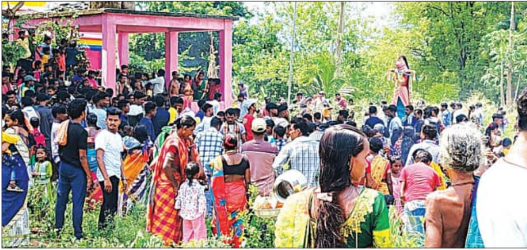
ରାୟଗଡ଼ା, ୨୩:୫ (ସମ୍ପାଦକ):

ରାୟଗଡ଼ା ଜିଲ୍ଲା ସଦର ବ୍ଲକ୍ ଗାଳିଗାଁ ପଞ୍ଚାୟତର ଗାଳିଗାଁ ଓ ଚମ୍ପିକୋଟାରେ ନଅ ଦିନ ଧରି ଚାଲିଥିବା ଅଗ୍ନିଗଙ୍ଗାମା ଠାକୁରାଣୀଙ୍କ ଘଟଯାତ୍ରା ବୃତ୍ତାନ୍ତରାଜ୍ୟରେ ହୋଇଯାଇଛି। ମା' ଅଗ୍ନିଗଙ୍ଗାମାଙ୍କ ଘଟଯାତ୍ରା