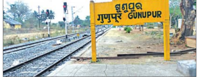
ଗୁଣ୍ଡପୁର, ୨୩:୫ (ସମ୍ପାଦକ):

ନୌପଡ଼ା-ପାରଳାଖେମୁଣ୍ଡି ରେଳପଥ ମରାମତି କାର୍ଯ୍ୟ ଯୋଗୁଁ ଆସନ୍ତା ୨୪ ଓ ୨୭ ତାରିଖ ଦୁଇ ଦିନ ପାଇଁ ବିଶାଖାପାଟଣା ରାଜ୍ୟ ରାଣୀ ଏକ୍ସପ୍ରେସ ଏବଂ ପୁରୀ-ଗୁଣ୍ଡପୁର ଟ୍ରେନ୍, ବାଟିକ କରାଯାଇଛି। ପ୍ରାୟ ଖବର ମୁତାବକ, ଆସନ୍ତା ୨୪ ଓ ୨୭ ତାରିଖ ଦିନ ବିଶାଖାପାଟଣା-ଗୁଣ୍ଡପୁର ଟ୍ରେନ୍ ସମ୍ପୂର୍ଣ୍ଣ