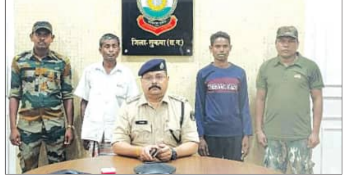
ମାଳକାନଗିରି, ୨୩:୫ (ସମ୍ପାଦକ):

ମାଳକାନଗିରି ଜିଲ୍ଲା ସାମାନ୍ତ ଛତିଶଗଡ଼ ସୁକୁମା ଜିଲ୍ଲା ପୁଲିସ ଦ୍ୱାରା ସକ୍ରିୟ ଦୁଇ ଡାରେଣ୍ଟି ମାଓବାଦୀ ଗିରଫ କରାଯାଇଛି। ତଥ୍ୟ ଅନୁଯାୟୀ, ସୁକୁମା ଜିଲ୍ଲା ଜଗରଗୁଣ୍ଡା ଥାନା ଅଞ୍ଚଳରେ ତିଆରି, ସିଆରପିଏସ୍ ଏବଂ ଜିଲ୍ଲା ପୁଲିସ ମିଳିତ ଭାବେ ତାରଳାଗୁଡ଼ା, କେରମେଟା ଗ୍ରାମ ନିକଟରେ ସର୍ବ ଅପରେସନ ସମୟରେ ବେଦନେ ଗ୍ରାମ ପାଖରୁ ତେଲମ ପାକକୁ ନାମକ ଜଣେ ମାଓବାଦୀକୁ ଗିରଫ କରିଥିଲେ। ଏହି ମାଓବାଦୀ ମଧ୍ୟ ବିଭିନ୍ନ ଘଟଣାରେ ସାମିଲ ଥିବା ପୁଲିସ ରେକର୍ଡରେ କରୁଥିଲେ। ତେବେ ତାରଳାଗୁଡ଼ା ଜଙ୍ଗଲ ନିକଟରେ ମାଓସଂଗଠନର ସକ୍ରିୟ ବେନପଲ୍ଲୀ ଆଉପିସି ମିଳିଥିଲା। ସଦସ୍ୟ ଗୁରୁବାର କୋର୍ଟ ଚାଲାଣ କରିଥିବା ସୁକୁମା ଜୁଜିମ ଜିଉ ଓରଫ ବୁଦ୍ଧକୁ ଗିରଫ