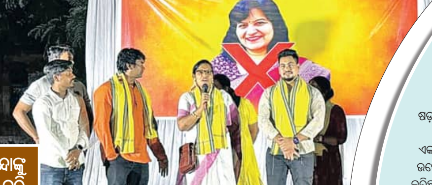
ବସ୍ତିବାସିନ୍ଦାଙ୍କୁ ଦେଖା ନ କରି ଫେରାଇ ଦିଅନ୍ତି ସାଂସଦ

ଭୁବନେଶ୍ୱର, ୨୩।୫ (ସମିଧ) ଆଜି ଦିନ ପରେ ନିର୍ବାଚନ ଥିବାବେଳେ ସାଂସଦ ଅପରାଜିତା ଷଡ଼ଙ୍ଗାଙ୍କ ଲାଗି ଅଭୂତା ବକ୍ତିବାର ଲାଗିଛି।