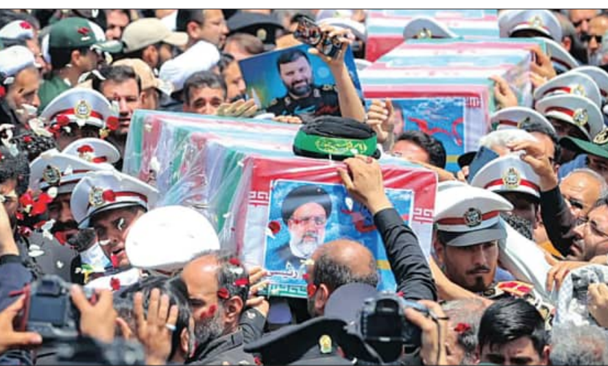
ଅଜରବୈଜାନ ପ୍ରଦେଶର ନବରଜ୍ ସହରରୁ ତେହରାନ ଆସିଥିବା ହେଲିକପ୍ଟର ଠିକଣା ସମୟରେ ଗତବ୍ୟ ସ୍ଥଳରେ ପହଞ୍ଚିଥିଲେ ହେଁ ରାଷ୍ଟ୍ରପତି ରଜସି ଏବଂ ବିଦେଶ ମନ୍ତ୍ରୀ ହୋସିଏନ ଅମିନୋଭାନୀହିୟନଙ୍କୁ ନେଇ ଆସୁଥିବା ହେଲିକପ୍ଟର ଖରାପ ପାଲଟି ଏକ ପାହାଡ଼ ନିକଟରେ ଦୁର୍ଘଟଣାଗ୍ରସ୍ତ ହୋଇଥିବା ଜଣାପଡ଼ିଥିଲା।