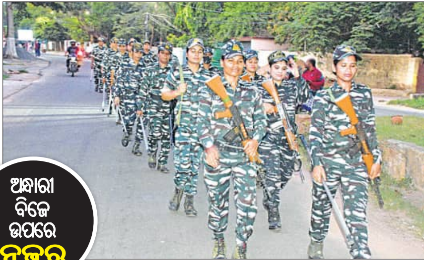
ଅନ୍ଧାର ବିଜେ ଉପରେ ନଜର

ଶନିବାର ରାଜଧାନୀବାସୀ ଦେବେ ଭୋଟ। ଭୋଟ ବାନ୍ଧିବା ପାଇଁ ପୁଲିସ ପଇଁଚରା କରିବାକୁ ନିର୍ଦ୍ଦେଶ ଦିଆଯାଇଛି।