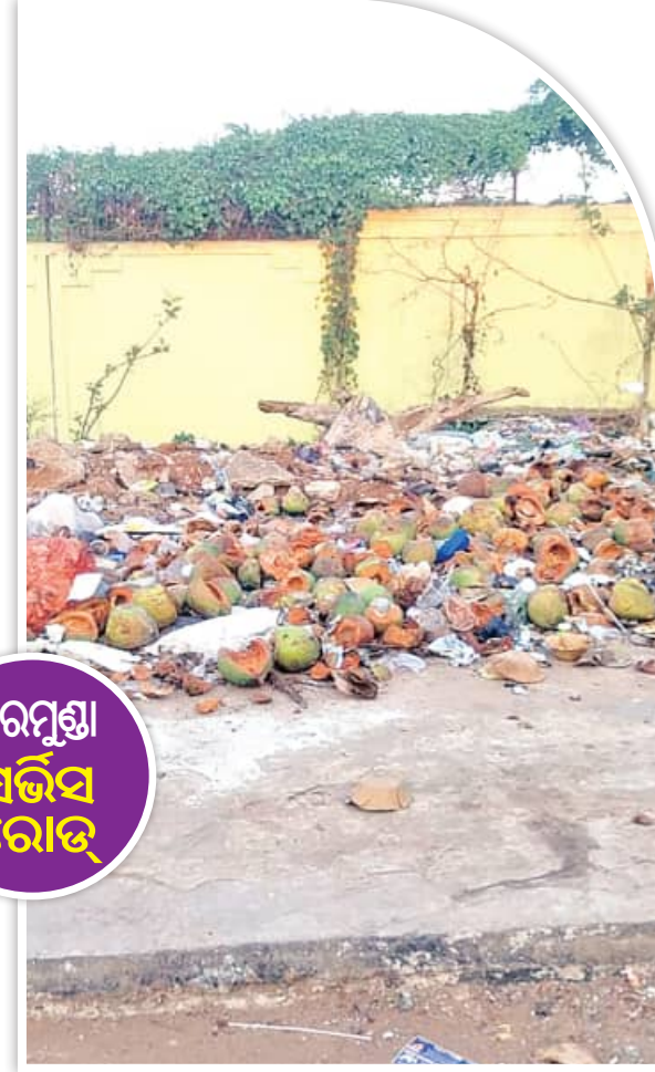
ବରମୁଣ୍ଡା ସର୍ବିସ ରୋଡ଼

ଛିଡ଼ା ହେଉଛନ୍ତି । ଗ୍ରାମିକ ଯୋଗୁଁ ଖଣ୍ଡଗିରି ଆଡ଼କୁ ଯାଉଥିବା ବସ୍‌ଗୁଡ଼ିକ ମଧ୍ୟ ଏଠାରେ ଛିଡ଼ା ହୋଇଗଲା ତେବେ ଗନ୍ଧ ଯୋଗୁଁ ବସ୍ ଭିତରେ ଯାତ୍ରୀ ବସିପାରୁନାହାନ୍ତି । ଲୋକେ ଏହାକୁ ନେଇ ଚାନ୍ଦୁ ଅସନ୍ତୋଷ ପ୍ରକାଶ କରୁଛନ୍ତି । ବରମୁଣ୍ଡା ନିକଟସ୍ଥ ବସ୍‌ଷ୍ଟାଣ୍ଡ ଦୀର୍ଘଦିନ ଧରି ଅସଜା ହୋଇ ପଡ଼ି ରହିଥିଲା । ମାତ୍ର ୩ ବର୍ଷ ମଧ୍ୟରେ ବିଏସ୍‌ସିଟିର ନକ୍ସା ପରିବର୍ତ୍ତନ ହୋଇଗଲା । ରୂପାନ୍ତରଣ ପରେ ଏହା ବିମାନବନ୍ଦର ଭଳି ପ୍ରତୀକ୍ଷାମାନ ହେଉଛି । ସାମାନ୍ୟ ଅଳିଆ ବି ଦେଖିବାକୁ ମିଳୁନି । ହେଲେ ୫ ବର୍ଷ ଧରି ଅଳିଆ ସ୍ଥାନ ଉପରେ ଗଦା ହୋଇଥିବା ଅଳିଆକୁ ବିଏମ୍‌ସି ସଫା କରିପାରୁ ନାହିଁ । ବିଏମ୍‌ସିର ଖାମଖାଆଳି ନୀତି ବିଶ୍ୱସ୍ତରାୟ ବସ୍‌ଷ୍ଟାଣ୍ଡର ଗରିମାକୁ କୁଠାରଯାତ କରୁଛି ବୋଲି ରାଜଧାନୀବାସୀ ଅଭିଯୋଗ କରିଛନ୍ତି ।