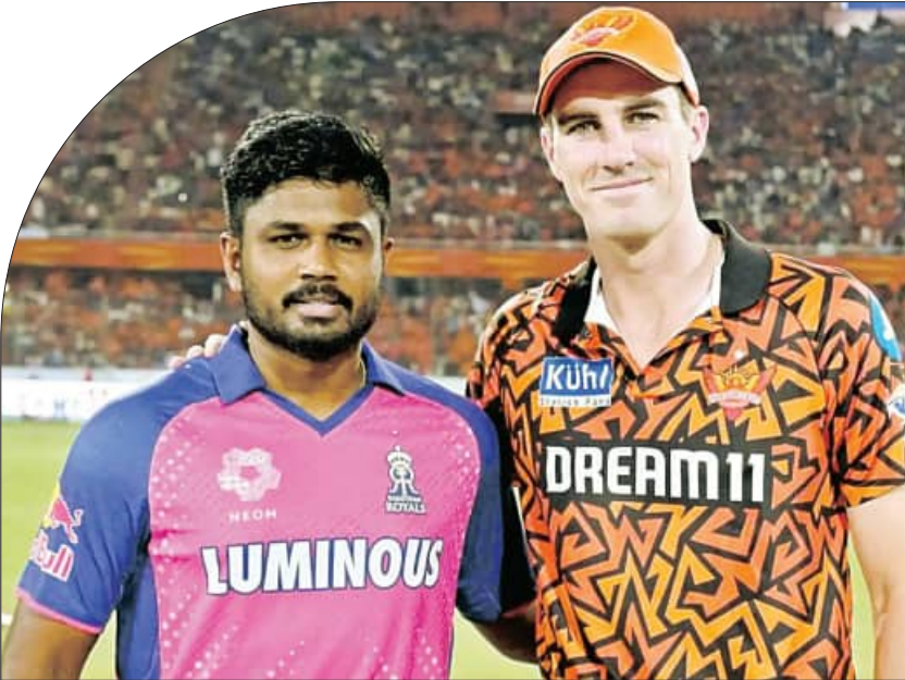
ପରସ୍ପରକୁ ୧୯ଥର ଭେଟିଥିବା କେକେ ହାଇଦ୍ରାବାଦ ୧୦ ଓ ରାଜସ୍ଥାନ ୯ଟି ମ୍ୟାଚ୍ରେ ବିଜୟ ହୋଇଛି ।

ଇଣ୍ଡିଆନ ପ୍ରିମିୟର ଲିଗ୍ (ଆଇପିଏଲ୍)ର ଚଳିତ ୧୭ତମ ସଂସ୍କରଣ ଅନ୍ତିମ ପର୍ଯ୍ୟାୟରେ ପହଞ୍ଚିଛି । ଆଜି ଦୁଇଟି ମ୍ୟାଚ୍ ପରେ କେଉଁ ଦଳ ଚାମ୍ପିଆନ୍ ହେବ ତାହା ସ୍ପଷ୍ଟ ହେବ । କାଲିଫୋର୍ଣ୍ଣ ୨ରେ ଶ୍ରେୟସ୍ ଆୟରଙ୍କ ନେତୃତ୍ୱାଧୀନ କୋଲକାତା ନାଇଟ୍ ରାଇଡର୍ସ (କେକେଆର୍) ୮ ଓକେଟରେ ସନରାଇଜର୍ସ ହାଇଦ୍ରାବାଦ (ଏସ୍ଆରଏଚ୍)କୁ ପରାସ୍ତ କରି ସିଧାସଳଖ ଫାଇନାଲକୁ ଉଠିଥିଲା । ଶୁକ୍ରବାର କାଲିଫୋର୍ଣ୍ଣ ୨ରେ ସାମ୍ବିତ୍ ସାମସନଙ୍କ ରାଜସ୍ଥାନ ରୟାଲ୍ସ ଓ ପ୍ୟାଟ୍ କମ୍ବିନ୍ସ ହାଇଦ୍ରାବାଦ ପରସ୍ପରକୁ ଭେଟିବେ । ସ୍ଥାନୀୟ ଏସ୍ ବିବାହମେ ଷ୍ଟାଡିୟମରେ ଖେଳାୟିତାଙ୍କୁ ଥିବା ଏହି ନିର୍ଣ୍ଣାୟକ ମ୍ୟାଚ୍ ବିଜୟୀ ଦଳ ଚାଲିଯାଇ ପାଇଁ ରବିବାର ଫାଇନାଲ ମୁକାବିଲାରେ କୋଲକାତାକୁ ଭେଟିବ । ଏଲିମିନେଟରରେ ରାଜସ୍ଥାନ ରୟାଲ୍ସ ୪ ଓକେଟରେ ରୟାଲ ଚ୍ୟାଲେଞ୍ଜର୍ସ ବେଙ୍ଗାଲୁରୁ (ଆରସିବି)କୁ ପରାସ୍ତ କରି କାଲିଫୋର୍ଣ୍ଣ ୨ ଖେଳିବାକୁ ଯୋଗ୍ୟତା ଅର୍ଜନ କରିଥିଲା । ଏହି ନିର୍ଣ୍ଣାୟକ ମ୍ୟାଚ୍ରେ ବିଜୟୀ ହୋଇ ହାଇଦ୍ରାବାଦ ଓ ରାଜସ୍ଥାନ ଫାଇନାଲ ଟିକେଟ୍ ହାସଲ ଲକ୍ଷ୍ୟରେ ରହିଛନ୍ତି । ପୂର୍ବରୁ ଦୁଇ ଦଳ