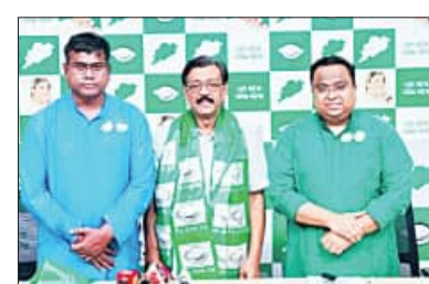
କହିଥିଲେ, ମୁଖ୍ୟମନ୍ତ୍ରୀ ତଥା ବିଜେଡି ସୁପ୍ରିମୋ ନବାନ ପଟ୍ଟନାୟକଙ୍କ ଲୋକାଭିମୁଖୀ କାର୍ଯ୍ୟ,