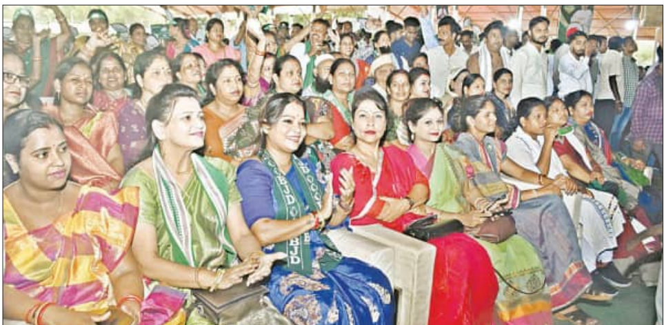
କଟକ, ୨୨।୫ (ସମ୍ପାଦକ)

ବାଲିଯାତ୍ରା ପଡ଼ିଆରେ ଆଜି ବିଜୁ ଜନତା ଦଳର ହାର୍ଡଭୋଲଟେବଲ ପ୍ରଚାର କାର୍ଯ୍ୟକ୍ରମରେ ଗୁଞ୍ଜାରିତ ହୋଇଥିଲା 'ଆମ ନବୀନ ନମ୍ବର-୧'। ହେଲିପ୍ୟାଡରୁ ମଞ୍ଚ ଯାଏଁ ଯୋଡ଼ି ଶଙ୍ଖର ଧ୍ବଜାରେ ପ୍ରକାଶିତ ହୋଇ ଉପସ୍ଥାପନା ପରିବେଶୀ ହଜାର ହଜାର ବିଜେଡି ପ୍ରେମୀ ହାତରେ ବିଜେଡି ପତାକା ଧରି ନବୀନଙ୍କୁ ସାଗର କରିଥିଲେ। ସର୍ବୋଚ୍ଚ ମୁହଁରେ ଥିଲା