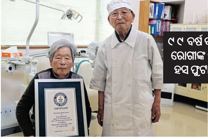
୯୯ ବର୍ଷ ବୟସରେ ରୋଗୀଙ୍କ ମୁହଁରେ ହସ ପୁଟାଉଛନ୍ତି