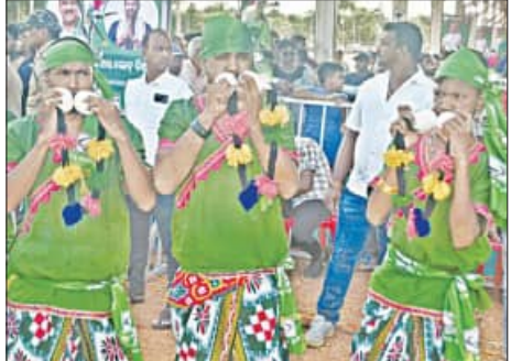
ନବୀନ ୫-ଟି ରୂପାନ୍ତରଣ ଗ୍ୟାରେଟ୍ଟି

ହୋଇଥିଲା। ମଞ୍ଚରେ ରାଜ୍ୟସଭା ସଂସଦ ଦେବାଶିଷ ସାମନ୍ତରାୟ ଯୋଷଣା କଲେ ଆଉ ମାତ୍ର ୫ ମିନିଟ୍ ଭିତରେ କୋଟି ଓଡ଼ିଆର ମଉଜୁମା ତଥା ଶ୍ରେଷ୍ଠ ଜନନାୟକ ବିଶ୍ୱର ନମ୍ବର-୧ ମୁଖ୍ୟମନ୍ତ୍ରୀ ନବୀନ ପଟ୍ଟନାୟକ ସଭାସଭାରେ ପହଞ୍ଚିବେ। ଏହାପରେ ଶଙ୍ଖ ବଜାଇବାକୁ ଆସିଥିବା ସଂସ୍କୃତିକ ଦଳ ହେଲିପ୍ୟାଡ଼ଠାରୁ ସଭାମଞ୍ଚ ଯାଏଁ ଧାଡ଼ି ବାନ୍ଧି ଛିଡ଼ା ହୋଇ ଶଙ୍ଖ ବଜାଇଥିଲେ। ମିଶନ ଶକ୍ତିର ମା' ମାନେ ହୁଲୁଲୁଳି ପକାଇ ସାଗର କରିଥିଲେ ବିଜେଡି ସୁପ୍ରିମୋ ତଥା ମୁଖ୍ୟମନ୍ତ୍ରୀ ନବୀନ ପଟ୍ଟନାୟକଙ୍କୁ। ସାଙ୍ଗରେ ଥିଲେ ବିଜେଡିର ସ୍ୱାଧୀନ ପ୍ରଚାରକ କାର୍ତ୍ତିକ ପାଣିଆନ। ଭବ୍ୟ ସାଗର କାର୍ଯ୍ୟକ୍ରମ ପରେ ଦକ୍ଷିଣ ନେତା ଓ କର୍ମୀମାନେ ତାଙ୍କୁ ପାଛୋଟି ନେଇଥିଲେ ମଞ୍ଚକୁ। ଅପେକ୍ଷା'ର ଅନ୍ତ ଘଟିଥିଲା। ମଞ୍ଚ ତଳେ ଉତ୍ସାହ, ଉଦ୍‌ଘୋଷଣା ସାଙ୍ଗକୁ ନବୀନ